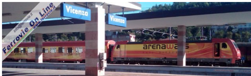
1. Il primo convoglio completo di ArenaWays in sosta a Vicenza, durante il trasferimento dalla Romania al Piemonte via Villa Opicina. (Foto Luca Trentin, 22 settembre 2010)

VILLA OPICINA (Trieste) - Sono giunte ieri in Italia tramite il valico di Villa Opicina le tanto attese carrozze di ArenaWays, che al traino della locomotiva E.483.018 hanno proseguito il viaggio alla volta del Piemonte.