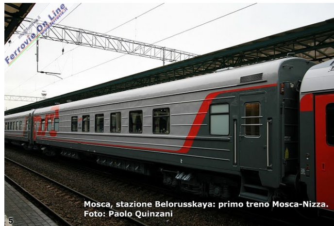
Mosca, stazione Belorusskaya: primo treno Mosca-Nizza. Foto: Paolo Quinzani

5. Ecco le due vetture ristorante che i viaggiatori hanno a disposizione in partenza da Mosca. Si noti la sagoma decisamente differente. Normalmente tali vetture circolano solo sul territorio della ex-URSS. Vediamo come giungerà il treno in Italia. (Foto Paolo Quinzani, 23 settembre 2010)