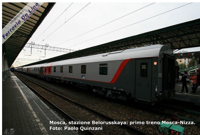
Mosca, stazione Belorusskaya: primo treno Mosca-Nizza. Foto: Paolo Quinzani

4.3. Vista della coda del treno. (Foto Paolo Quinzani, 23 settembre 2010)