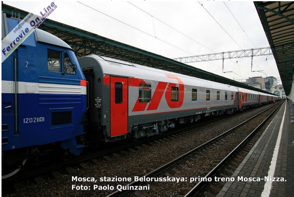
Mosca, stazione Belorusskaya: primo treno Mosca-Nizza. Foto: Paolo Quinzani

C7, macchina a 3000 V c.c. da 6000 kW e 180 km/h di velocità massima. (Foto Paolo Quinzani, 23 settembre 2010)" href="https://www.ferrovie.it/portale/images/articoli/02735103.jpg" target="_blank">