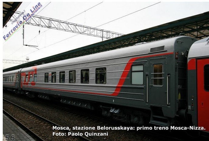
Mosca, stazione Belorusskaya: primo treno Mosca-Nizza.

Agli occhi di noi Italiani un collegamento di questo tipo può sembrare anacronistico, ma così non è per il viaggiatore russo che ha un diverso modo di vedere il tempo e di pensare al viaggio. Quest'ultimo fa parte della vacanza, il lento fluire del tempo fa parte del normale modo di spostarsi. Se poi pensiamo al lusso di questo treno, ai servizi e alla qualità del materiale allora possiamo capire i motivi che spingono numerosi viaggiatori a sceglierlo al posto del sovente più economico aereo. I prezzi variano da circa 300 euro a 1200, anche se sono previsti sensibili sconti per gli acquisti fatti da gruppi familiari.