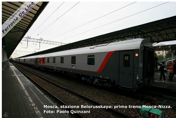
Mosca, stazione Belorusskaya: primo treno Mosca-Nizza. Foto: Paolo Quinzani

4. Vista della coda del treno. (Foto Paolo Quinzani, 23 settembre 2010)