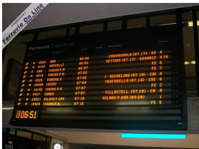
20. Il tabellone RFI di Torino Lingotto; si nota la penultima riga aggiornata con il logo di AW (15 novembre 2010)

Il treno, classificato da RFI come regionale 24221, presentava tre carrozze di cui quella centrale - la "Unica" - con servizi ristoro e market; la composizione era inquadrata fra due locomotive, in testa la E.483.018, in coda la E.483.020. A bordo della corsa inaugurale una decina di passeggeri e l'Amministratore Delegato della società, Giuseppe Arena.