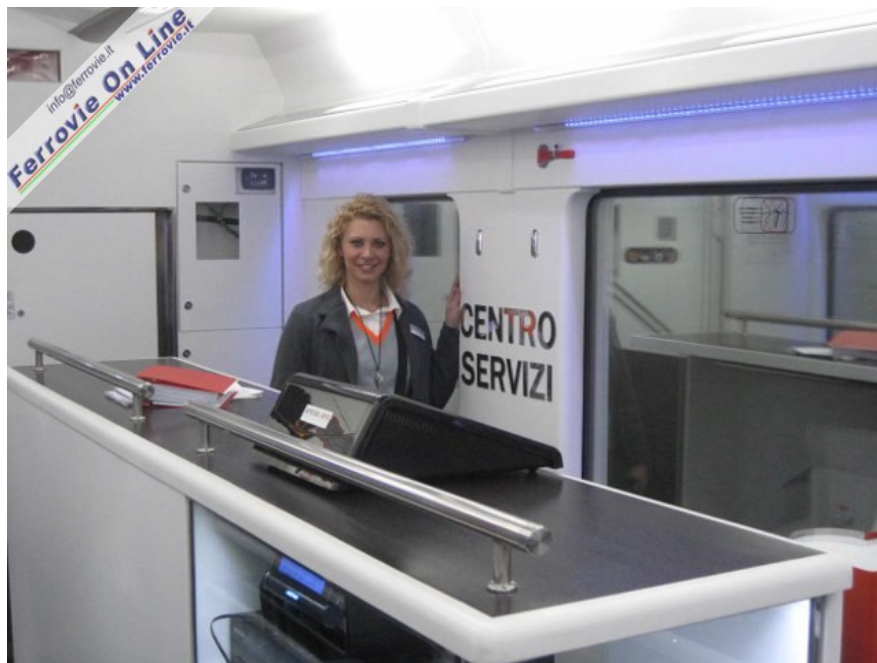
7. La capotreno nel suo "ufficio", il Centro Servizi di bordo, a disposizione dei passeggeri. (Foto Claudio Brenna, 15 novembre 2010)

Di lì a poco due sorridenti hostess passano con il carrellino ed offrono il caffè, per la prima settimana offerto direttamente al posto, con tanto di biscottino, crema di latte e cioccolatino marchiato AW e un volantino con i prodotti in vendita nella boutique di bordo informandoci della possibilità di fare la lista della spesa, consegnarla a loro e ritirarla poi sul treno del ritorno. Sembra proprio la scusa adatta per visitare il settore negozio di Unica, sempre molto luminoso: all'ingresso sulla sinistra c'è un grande banco frigo con yogurt, latte, zuppe pronte e bibite; gli scaffali ben allocati tra un finestrino e l'altro espongono confezioni di pasta, vini pregiati ed addirittura vini griffati AW; il bancone mette invece in bella vista brioches, focacce, panini, tramezzini e pane fresco. Come nota di colore, sopra i finestrini c'è una fila di luci a led che cambiano colore in continuazione.