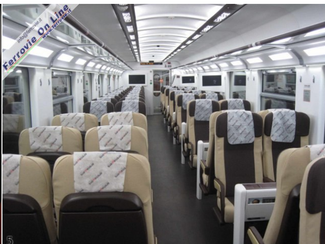
4. Gli scalini con il nome dell'impresa in rilievo; qualcosa che non si vedeva da un certo tempo... (Foto Claudio Brenna, 15 novembre 2010) 5. L'interno di una carrozza ArenaWays appena saliti: pulita e luminosa. (Foto Claudio Brenna, 15 novembre 2010)

Si parte in orario alle 7.04, a bordo oltre allo scrivente sono presenti, 3 giornalisti, 2 tecnici ArenaWays, 3 hostess in servizio sulla carrozza "Unica", la CT ed un altro giovane componente del personale. La locomotiva comincia subito ad accelerare ma la comodità delle sedute e l'atmosfera delle carrozze quasi non permettono di accorgersi che si sta viaggiando. I sedili sono simili a quelli montati sugli EuroStarCity, decisamente migliori però sia nella seduta che nel poggiatesta. L'atmosfera è rilassante e l'altissima luminosità delle carrozze, accentuata dalle pareti e dal soffitto bianchi, rende il viaggio ancora più tranquillo.