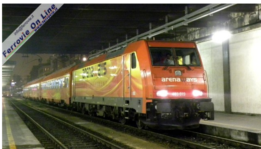
22. In serata sono partite anche le due corse in senso opposto; qui la E.483.019 ripresa a Milano P. G. al traino del R24223 Torino Lingotto - Milano Rogoredo (15 novembre 2010)

Dopo i molti problemi degli ultimi mesi, e nonostante le limitazioni al servizio imposte dall'URS, i servizi commerciali passeggeri dell'impresa piemontese sono finalmente una realtà. Al momento sono previste due corse da Milano verso Torino Lingotto, con partenza da Rogoredo alle 6.23 e da Porta Garibaldi alle 19.48, e due corse da Torino Lingotto verso Milano, in partenza alle 7.10 per Porta Garibaldi e alle 18.05 per Rogoredo.