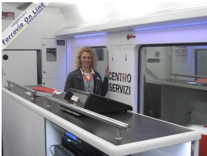
7. La capotreno nel suo "ufficio", il Centro Servizi di bordo, a disposizione dei passeggeri. (Foto Claudio Brenna, 15 novembre 2010)

Di lì a poco due sorridenti hostess passano con il carrellino ed offrono il caffè, per la prima settimana offerto direttamente al posto, con tanto di biscottino, crema di latte e cioccolatino marchiato AW e un volantino con i prodotti in vendita nella boutique di bordo informandoci della possibilità di fare la lista della spesa, consegnarla a loro e ritirarla poi sul treno del ritorno. Sembra proprio la scusa adatta per visitare il settore negozio di Unica, sempre molto luminoso: all'ingresso sulla sinistra c'è un grande banco frigo con yogurt, latte, zuppe pronte e bibite; gli scaffali ben allocati tra un finestrino e l'altro espongono confezioni di pasta, vini pregiati ed addirittura vini griffati AW; il bancone mette invece in bella vista brioches, focacce, panini, tramezzini e pane fresco. Come nota di colore, sopra i finestrini c'è una fila di luci a led che cambiano colore in continuazione.