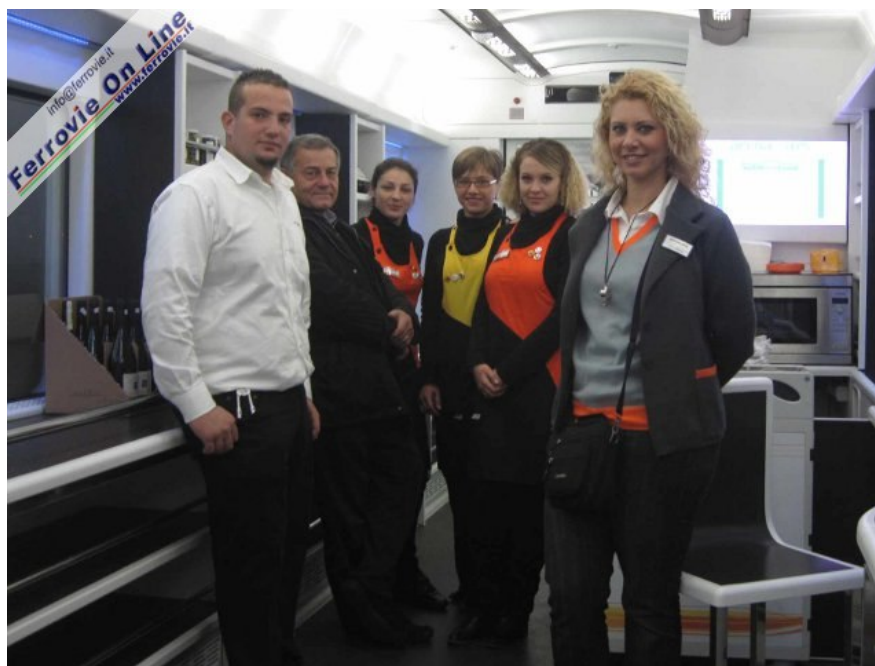
6. Lo staff ArenaWays a bordo del treno inaugurale posa per il nostro fotografo. Nel nostro viaggio siamo stati bene assistiti da persone sorridenti e motivate: auguri di buon lavoro a tutto il personale! (Foto Claudio Brenna, 15 novembre 2010)

Si parte in orario alle 7.04, a bordo oltre allo scrivente sono presenti, 3 giornalisti, 2 tecnici Arenaways, 3 hostess in servizio sulla carrozza "Unica", la CT ed un altro giovane componente del personale. La locomotiva comincia subito ad accelerare ma la comodità delle sedute e l'atmosfera delle carrozze quasi non permettono di accorgersi che si sta viaggiando. I sedili sono simili a quelli montati sugli EuroStarCity, decisamente migliori però sia nella seduta che nel poggiatesta. L'atmosfera è rilassante e l'altissima luminosità delle carrozze, accentuata dalle pareti e dal soffitto bianchi, rende il viaggio ancora più tranquillo.