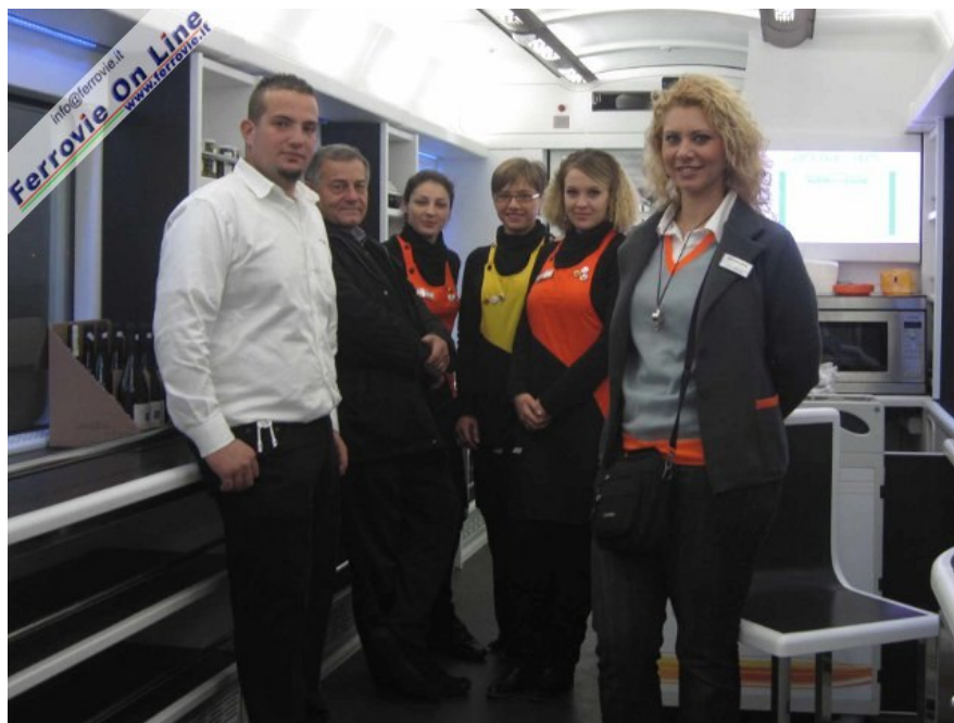
6. Lo staff ArenaWays a bordo del treno inaugurale posa per il nostro fotografo. Nel nostro viaggio siamo stati bene assistiti da persone sorridenti e motivate: auguri di buon lavoro a tutto il personale! (Foto Claudio Brenna, 15 novembre 2010)

Si parte in orario alle 7.04, a bordo oltre allo scrivente sono presenti, 3 giornalisti, 2 tecnici ArenaWays, 3 hostess in servizio sulla carrozza "Unica", la CT ed un altro giovane componente del personale. La locomotiva comincia subito ad accelerare ma la comodità delle sedute e l'atmosfera delle carrozze quasi non permettono di accorgersi che si sta viaggiando. I sedili sono simili a quelli montati sugli EuroStarCity, decisamente migliori però sia nella seduta che nel poggiatesta. L'atmosfera è rilassante e l'altissima luminosità delle carrozze, accentuata dalle pareti e dal soffitto bianchi, rende il viaggio ancora più tranquillo.