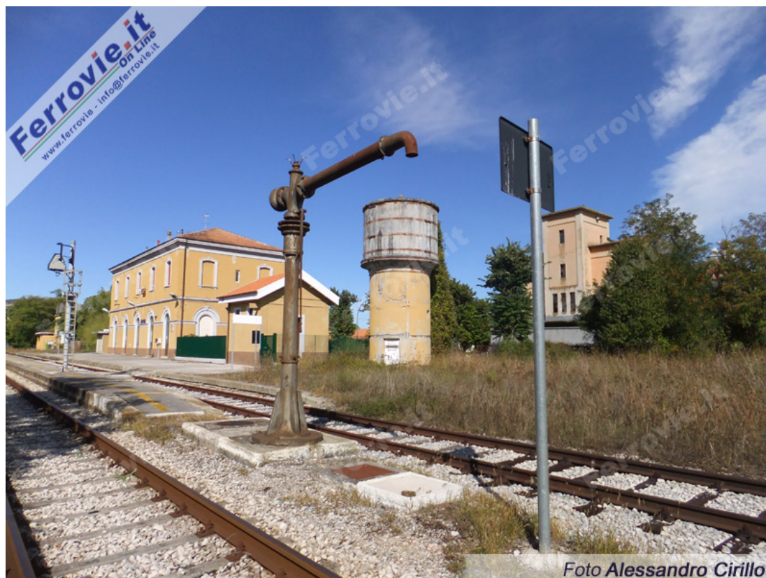
3. La stazione di Pergola nel suo ultimo giorno di esercizio ordinario. (8 ottobre 2011)

Il servizio nel 1902 comprendeva due coppie di treni a vapore Urbino - Fabriano, che tra Pergola e Fabriano impiegavano 75 minuti. Prima del Secondo conflitto Mondiale il servizio passeggeri, 5 coppie, veniva effettuato con automotrici (con percorrenza ridotta a circa 45 minuti), mentre restò affidato al vapore quello merci, derivante dalle miniere di zolfo.