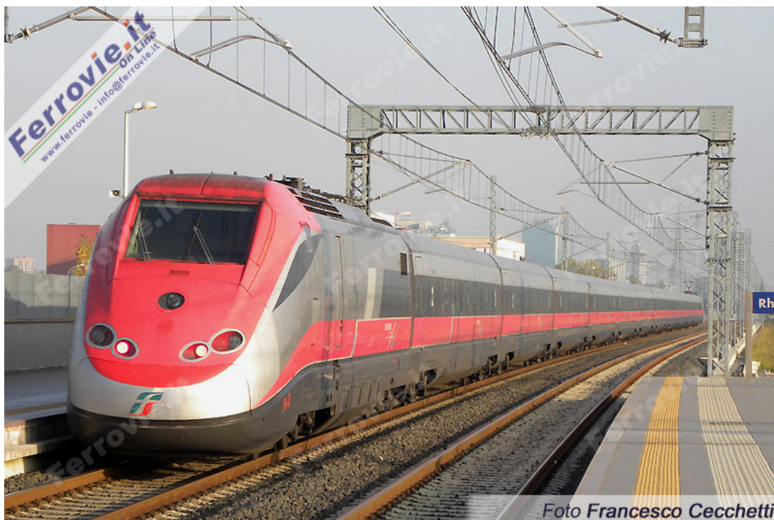
7. In occasione delle principali manifestazioni fieristiche, alcuni Frecciarossa fermeranno nella stazione di Rho Fiera di Milano. Anche a Rimini Fiera fermerà una coppia di Frecciabianca in occasione delle manifestazioni. (Foto Francesco Cecchetti, 6 novembre 2010)

La conferenza stampa è anche l'occasione per annunciare la fermata di alcuni treni Frecciarossa presso la stazione Rho Fiera di Milano in concomitanza delle più importanti manifestazioni fieristiche in calendario nei padiglioni della nuova Fiera milanese; in analogia anche la Fiera di Rimini, dotata di stazione ferroviaria al suo interno, vedrà fermare alcuni Frecciabianca durante le principali fiere riminesi.