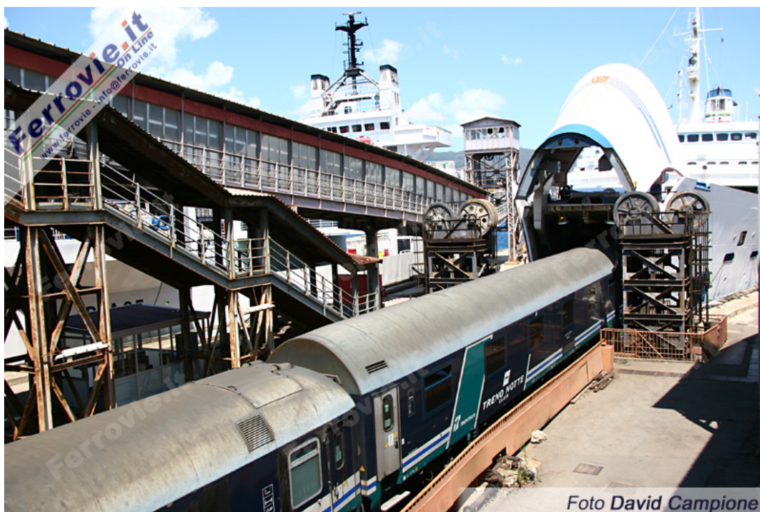
6. Tornano i treni notturni sull'intera percorrenza Milano - Sicilia, con traghettamento tra Villa San Giovanni e Messina. Una coppia di treni con carrozze letto e cuccette collegherà Milano a Palermo e Siracusa, con divisione in due sezioni a Messina. Ripristinati anche altri collegamenti da Puglia e Calabria verso Milano. (31 luglio 2011)

Infine novità tra Roma e Reggio Calabria, dove due coppie di Intercity in precedenza affidate a materiale ordinario o ETR.450, viaggiano adesso con otto carrozze (due prime classi e sei seconde) serie Gran Comfort e UIC-Z rinnovate, dello stesso tipo in composizione ai Frecciabianca ma con livrea esterna XMPR.