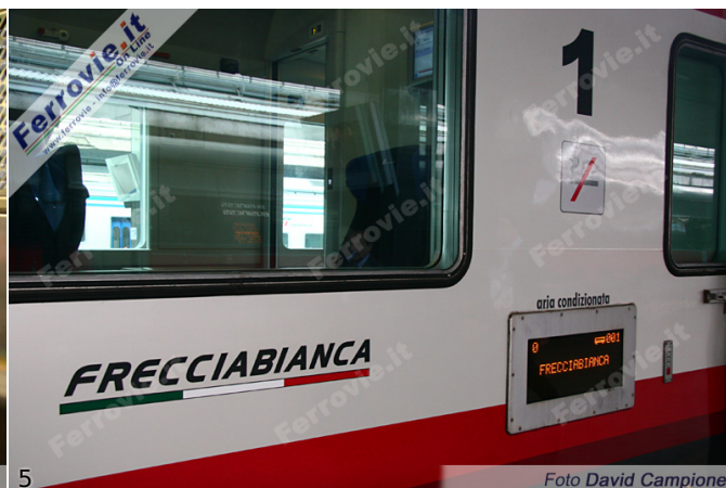
4. Il nuovo angolo bar nella carrozza di seconda classe speciale dei Frecciabianca. (Foto David Campione, 29 maggio 2012) 5. Il logo "Frecciabianca" su una carrozza di prima classe. (Foto David Campione, 29 maggio 2012)

Dopo le numerose proteste, Trenitalia torna sui suoi passi e ripristina alcuni dei servizi notturni recentemente tagliati. Nell'ambito del Contratto di Servizio dal 10 giugno Trenitalia torna a collegare Puglia, Calabria e Sicilia a Milano con treni notte composti da carrozze cuccette e vetture letti.