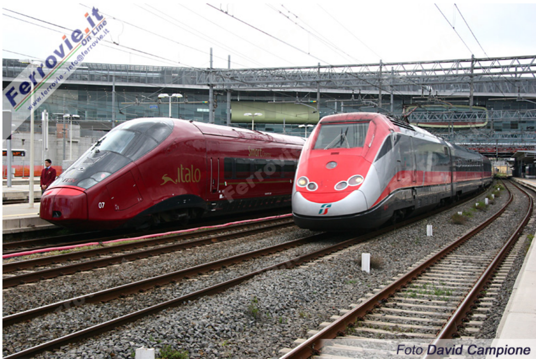
88 Un ETR.500 Frecciarossa di Trenitalia e Italo di Nuovo Trasporto Viaggiatori a Roma Tiburtina. (Foto David Campione, 20 aprile 2012)