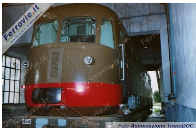
2. L'automotrice RALn 60.12 del 1950 accantonata a Castelvetro. (Foto Associazione TrenoDOC, 18 gennaio 1998)

E' stato già posato il binario che molto probabilmente ospiterà l'automotrice RALn 60.12 e la locomotiva R.302.23, ma questi rotabili si trovano ancora accantonati a centinaia di chilometri di distanza presso Castelvetro (TP), il che non renderà facile il loro trasferimento.