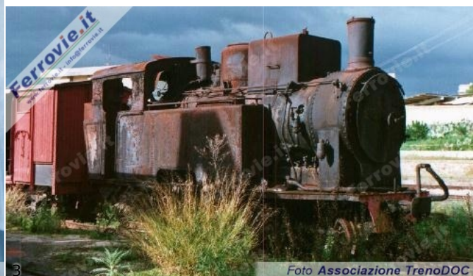
3. Locomotiva R302.23 inizialmente destinata all'esposizione nel museo di Pietrarsa, ma poi rimasta inutilizzata, poiché al suo posto fu inviata la R302.019. Adesso la R302.23 dovrebbe essere destinata al Museo dello scartamento ridotto di Villarosa. (Foto Associazione TrenoDOC, 18 gennaio 1998)