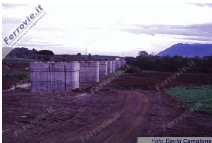
Le pile del viadotto La Masona, lungo 535,20 che è in costruzione nei pressi di Colleferro (31 ottobre 1997)