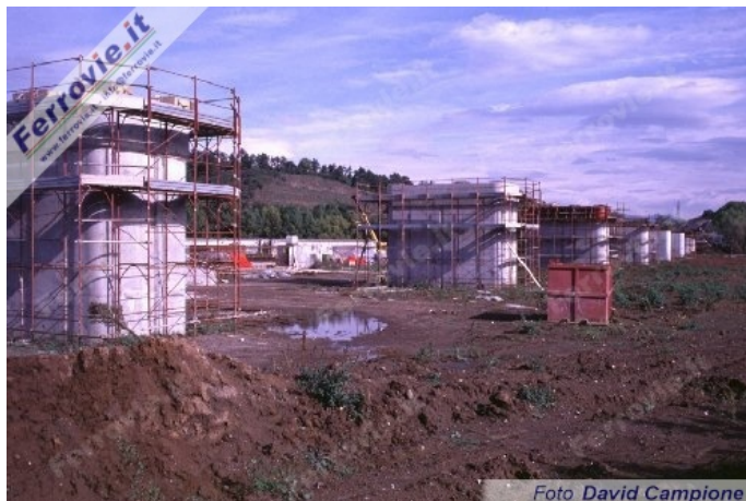
Le pile del viadotto Colleferro, lungo 829,42 metri. (31 ottobre 1997)