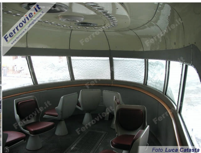
4. La vettura dell'ETR.252, ribattezzata ETR.301 "Settebello", esposta ai piedi del Duomo di Milano il primo giorno di apertura della mostra. Al suo fianco un nutrito gruppo di passanti attende di poter salire a bordo per visitarne gli interni. (Foto Luca Catasta, 3 marzo 2005) 5. L'interno del Belvedere dell'ETR.252. (Foto Luca Catasta, 3 marzo 2005)