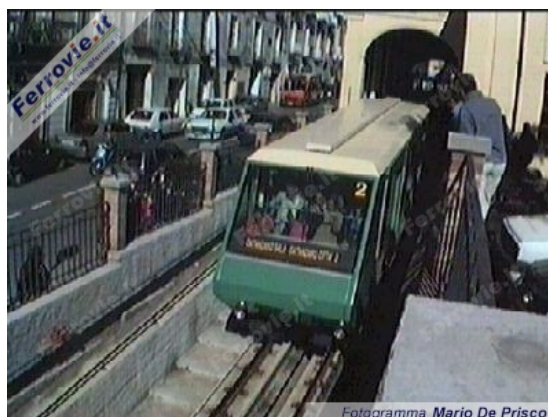
2 2 Carrozza 2 in partenza dalla stazione superiore (Fotogramma Mario De Prisco, 4 ottobre 1998)

In previsione di un vistoso successo e gradimento da parte del pubblico è prevista inoltre l'effettuazione di corse straordinarie in presenza di un numero di viaggiatori superiore a 25.