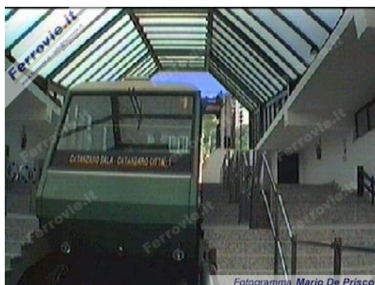
1 1 Carrozza 1 alla stazione inferiore (Fotogramma Mario De Prisco, 4 ottobre 1998)

Qui vogliamo illustrare con le immagini la cronaca della giornata inaugurale che, oltre alla presenza delle autorità civili e religiose, ha visto la popolazione intervenire numerosa a far da cornice all'evento.