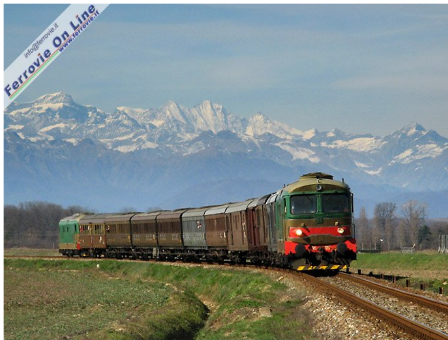
Lo speciale Novara-Varallo affidato alla D.345.1052 con il rinforzo in spinta della D.345.1002 nei pressi di S.Bernardino (NO) sullo sfondo delle cime del Mischabel. (2 marzo 2008)

ROMA - Si è svolta domenica 2 marzo la Giornata Nazionale delle Ferrovie Dimenticate, organizzata dalla Co.Mo.Do, la Confederazione Mobilità Dolce. Per una volta facciamo parlare le immagini, che ci sono giunte in redazione.