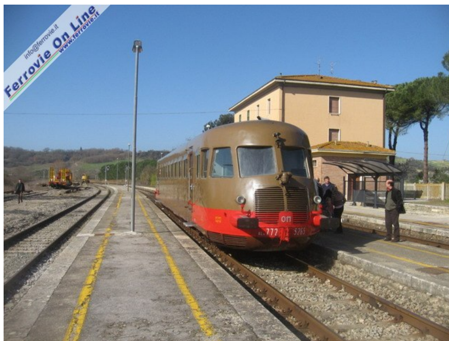
Uno degli eventi in Toscana è stato un viaggio con la ALn 772.3265 da Asciano a Monte Antico organizzato dalla Ferrovia della Val d'Orcia per la sagra del tartufo marzaio di San Giovanni d'Asso, in provincia di Siena. (Foto Roberto Granai, 2 marzo 2008)