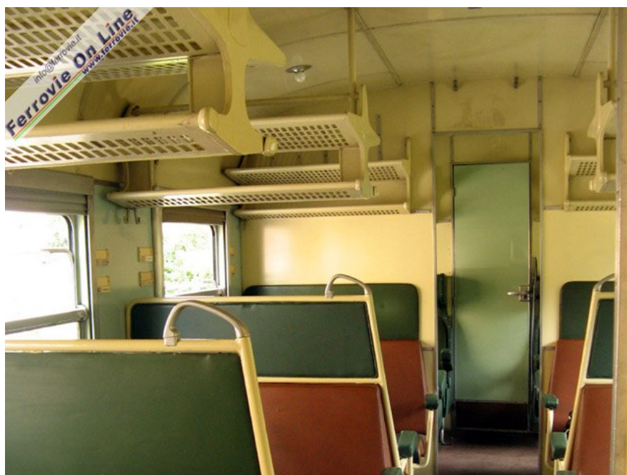
Paratico-Sarnico - L'interno della restaurata ALn 668.1452. (Foto Pietro de' Castiglioni, 08 giugno 2008)