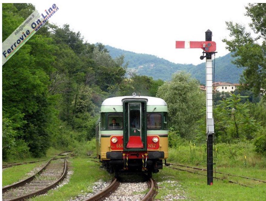
La ALn 668.1452 proveniente da Palazzolo supera il segnale ad ala (non funzionante) all'ingresso della stazione di Paratico-Sarnico. (Foto Pietro de' Castiglioni, 08 giugno 2008)

Dopo il recente restauro e il ripristino della livrea giallo coloniale - verde lichene comincia quindi il servizio delle due automotrici per la stagione turistica del Treno Blu.