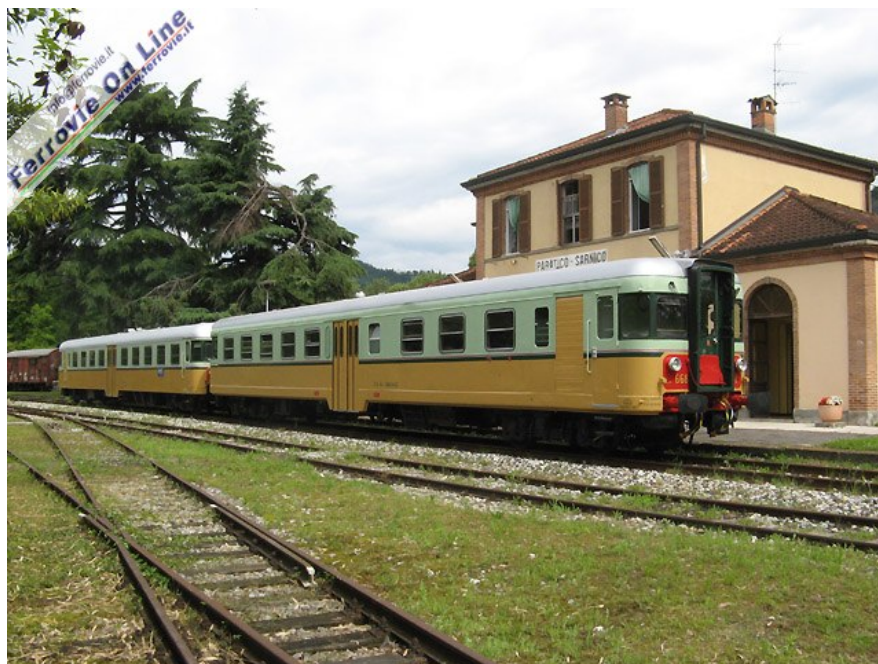
La coppia di ALn 668.1452 (in testa) e 1401 in sosta davanti allo storico fabbricato della stazione di Paratico-Sarnico. (08 giugno 2008)