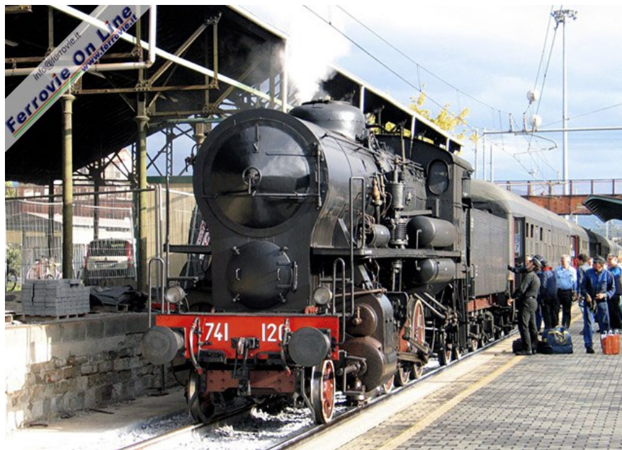
5 Percorsa la ferrovia faentina, nel pomeriggio la 741.120 con il suo convoglio speciale si è attestata a Firenze Campo di Marte. 3 ottobre 2008