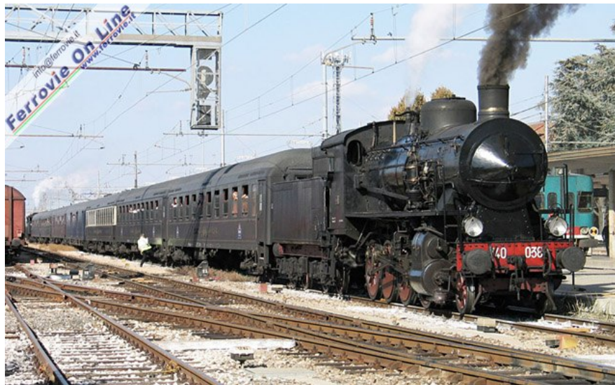
La 740.038 spartisce con la 685.196 all'altro capo del treno il compito della trazione. Qui in sosta a Rovigo in attesa di partire per Legnago e Verona. (Foto Arnaldo Vescovo, 6 ottobre 2008)