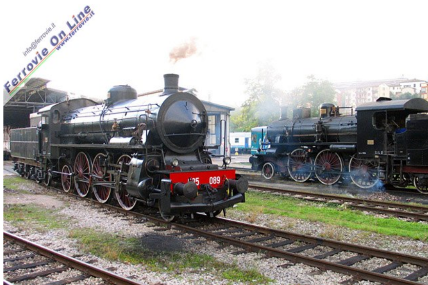
Ancora la 685.089 in compagnia della 640.003, alle prime luci dell'alba nel deposito di Siena. Foto Arnaldo Vescovo, 4 ottobre 2008