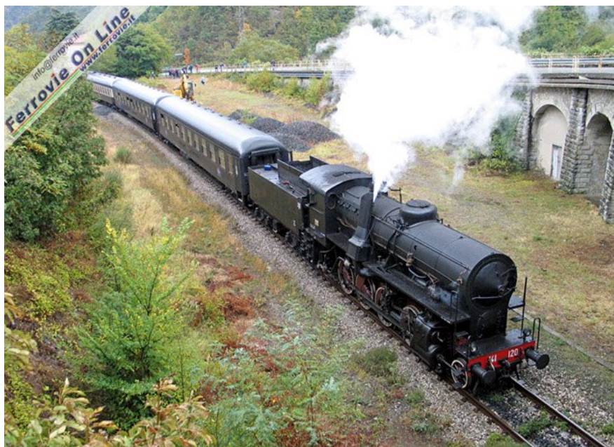
4 Ancora la 741.120 in sosta tra Marradi e Crespino al Lamone. 3 ottobre 2008

Ma oltre al treno proveniente dalla Germania sabato 4 è stato anche effettuato un Rimini - Cesenatico e ritorno trainato dalla 740.409, mentre domenica 5 ottobre c'è stato il grande exploit del vapore italiano!