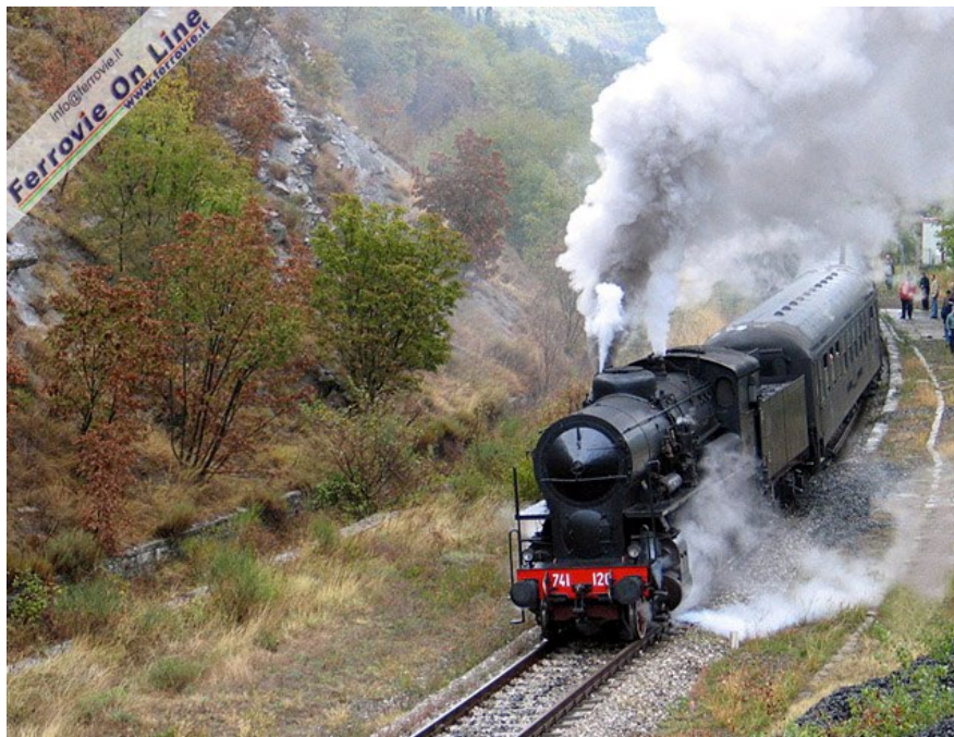
3 Sosta fotografica tra Marradi e Crespino del Lamone. Foto Arnaldo Vescovo, 3 ottobre 2008

E.645.023, la 685.196, di nuovo la 740.038 ed infine l'E. 645.104 per un totale di 4 locomotori elettrici d'epoca e di 6 locomotive a vapore.