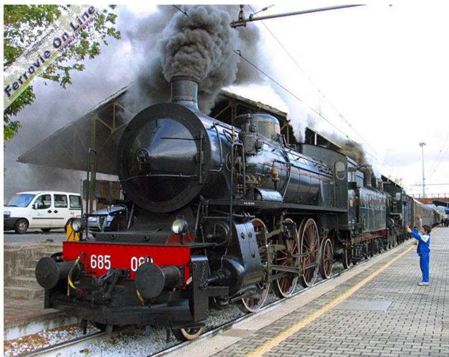
La 685.089 e la 640.003 a Firenze Campo di Marte, in procinto di ripartire verso Siena. Foto Arnaldo Vescovo, 3 ottobre 2008