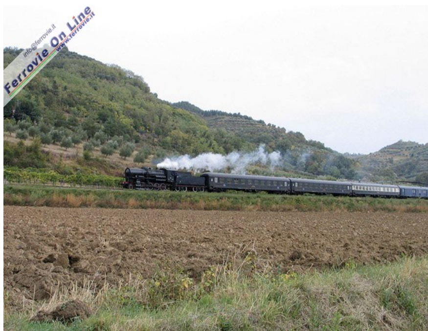
2-La 741.120 in corsa tra Brisighella e Marradi. (Foto Arnaldo Vescovo, 3 ottobre 2008)

Dal Brennero il convoglio ha compiuto un esteso tour in Italia sempre trainato da vaporeiere ed elettrici storici delle FS, lungo il percorso Bolzano - Trento - Bassano del Grappa - Vicenza - Padova - Ferrara - Bologna - Faenza - Borgo S.Lorenzo - Firenze - Empoli - Siena - Asciano - Monte Antico - Asciano - Siena - Empoli - Firenze - Pistoia - Bologna - Rimini - Ravenna - Ferrara - Rovigo - Legnago - Verona - Trento - Bolzano - Brennero, per poi far ritorno a Stoccarda.