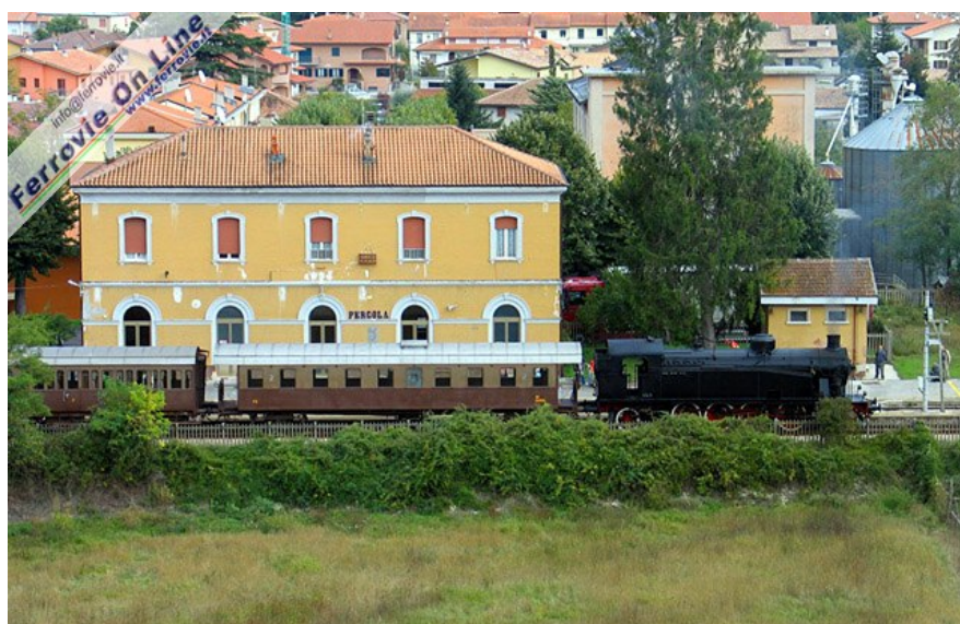
Il breve convoglio nella stazione di Pergola. (5 ottobre 2008)