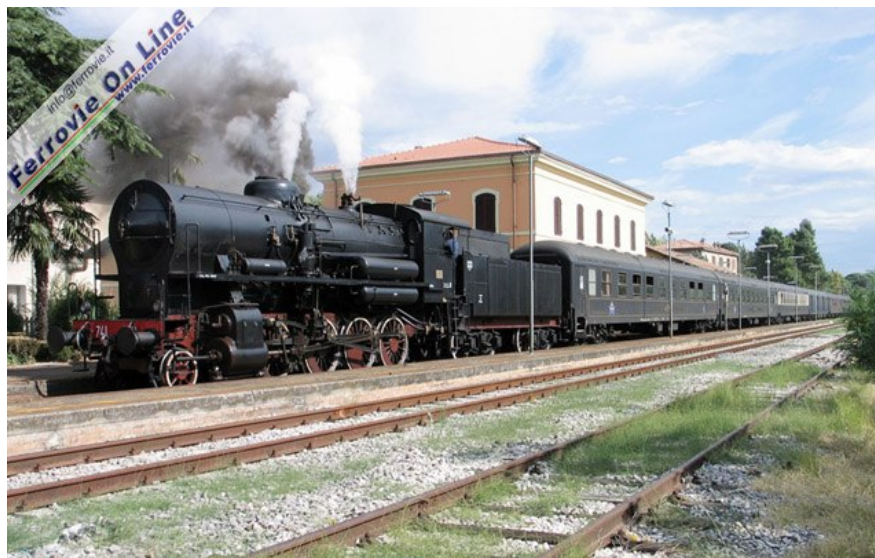
1, Il treno speciale dell'IGE, Tour Operator tedesco, composto da sette carrozze UIC-X. Qui è ripreso in sosta a Brisighella, lungo la ferrovia faentina, con in testa la 741.120. (Foto Arnaldo Vescovo, 3 ottobre 2008)

ROMA - Grande "abbuffata" di treni storici nel primo week end di ottobre. Dal 1° al 7 ottobre l'IGE, tour operator tedesco specializzato in viaggi ferroviari, ha organizzato un treno crociera straordinario composto da 7 carrozze UIC-X tedesche modificate; il convoglio ha viaggiato nell'Italia centro-settentrionale sempre trainato da locomotive a vapore e da locomotori elettrici storici.