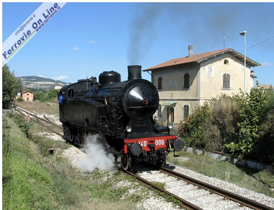
Altro treno speciale domenica 5 ottobre, che ha visto come protagonista la 940.006, qui in manovra a Pergola. (Foto Arnaldo Vescovo, 5 ottobre 2008)