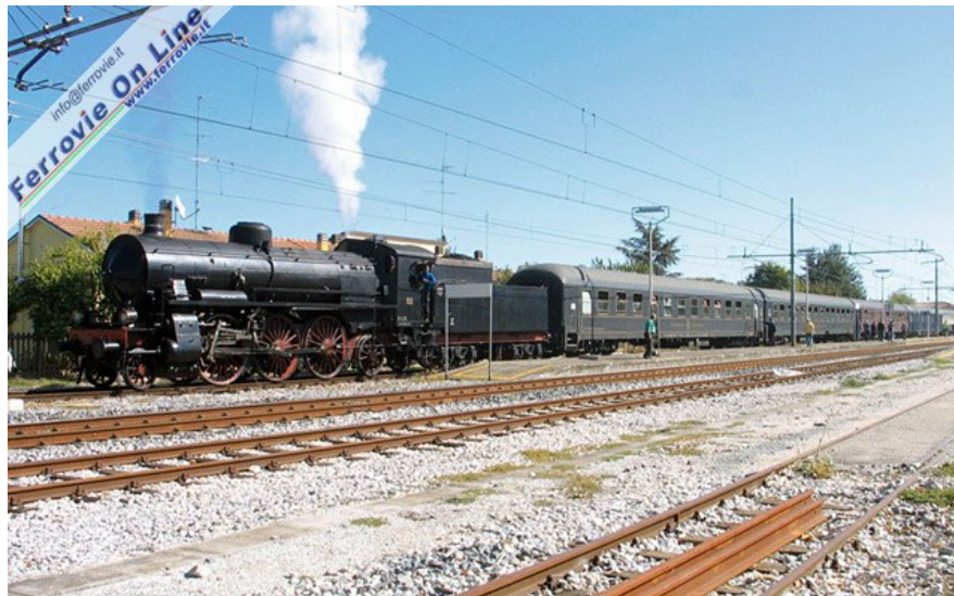
Il viaggio di ritorno, con la 685.196 ed il suo treno di agenzia ad Alfonsine, sulla linea tra Ravenna e Ferrara. 6 ottobre 2008