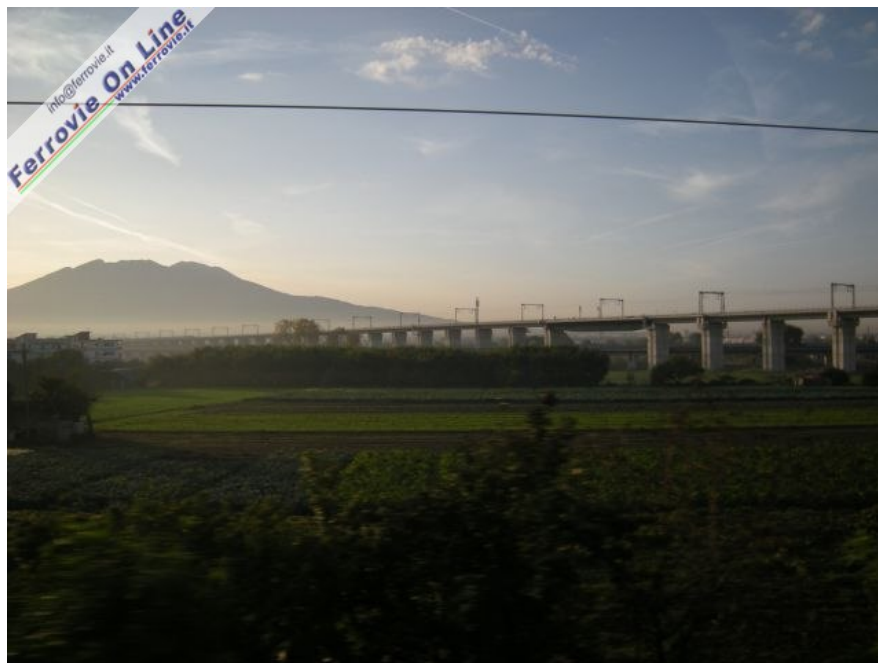
2 Foto della nuova linea così come la si vede dalla Napoli-Cancello: alle spalle del fotografo è la linea Napoli - Roma AV.