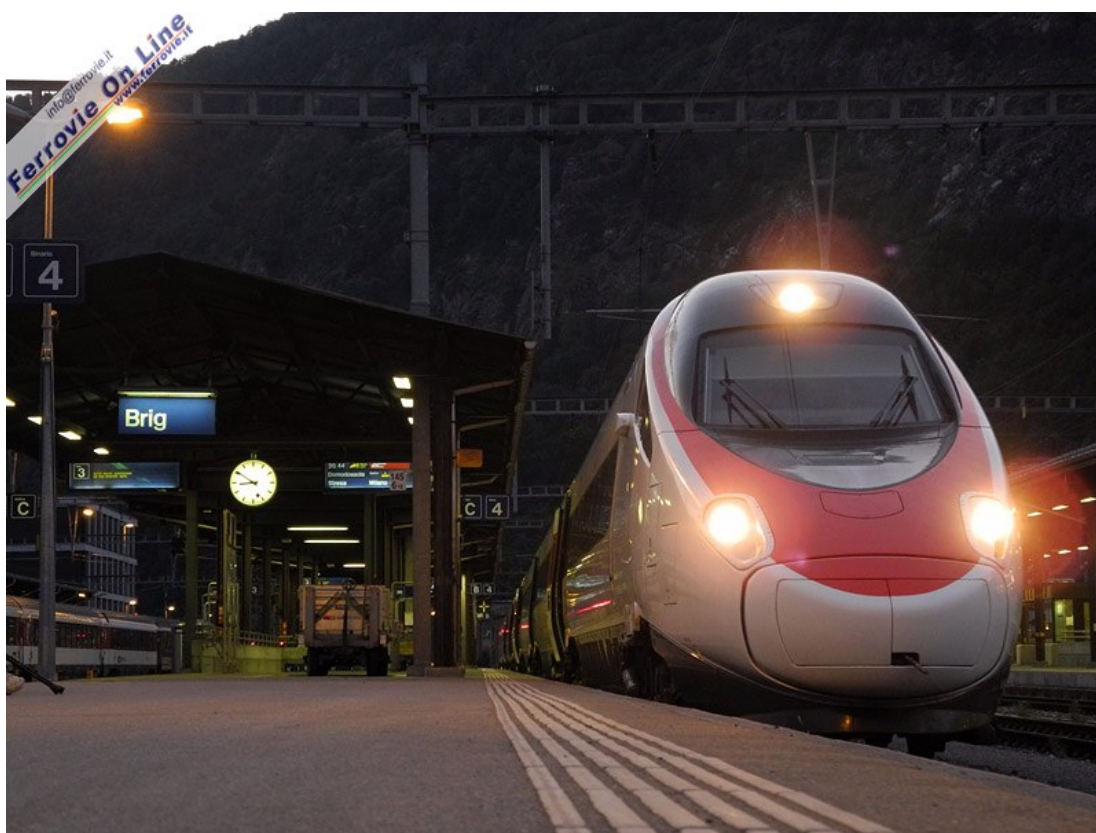
4. L'EC 41 Ginevra - Milano C.le attende a Briga la partenza verso l'Italia. (15 agosto 2013)

Dal lato italiano, per rispondere alle esigenze degli studenti in partenza per Domodossola dalle stazioni di Iselle, Varzo e Preglia, le FFS hanno anticipato il primo treno da Briga alle ore 6. L'orario è stato adattato per facilitare anche gli spostamenti verso Milano garantendo corrispondenze con i regionali di Trenord.