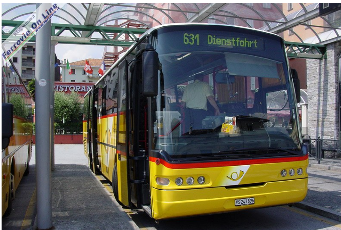
5. Un bus di Autopostale, utilizzato per i collegamenti tra Canton Vallese e Piemonte attraverso il Passo del Sempione, sosta presso l'autostazione di Domodossola. (Foto Fabio Veronesi, 15 agosto 2012)