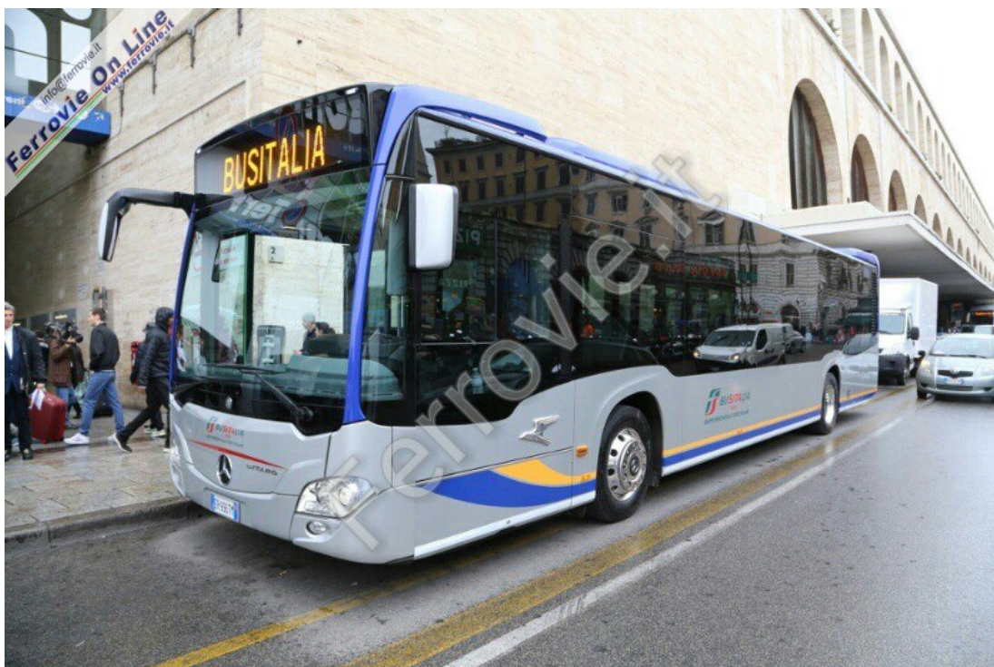
4.1 nuovi Mercedes Citaro per Busitalia. (Foto David Campione, 27 marzo 2014)

Moretti ne ha approfittato per rispondere al ministro delle Infrastrutture Lupi sulla quotazione in Borsa di FSI. "Non ho mai proposto la quotazione - ha detto stamattina Moretti - io sto facendo quello che il Mef mi sta chiedendo: mettere in chiarezza i conti per poter decidere che fare". Sul nodo del trasporto regionale, l'ad FSI ha spiegato che c'è un problema di risorse disponibili, con una piccola tiratina d'orecchie alle Regioni: "Non possiamo continuare a fare i servizi se ci sono clienti che pensano di pagarci tra due anni o due anni e mezzo. FS ha bisogno della certezza dei pagamenti. I pagamenti della Pa devono essere certi e nei tempi previsti".