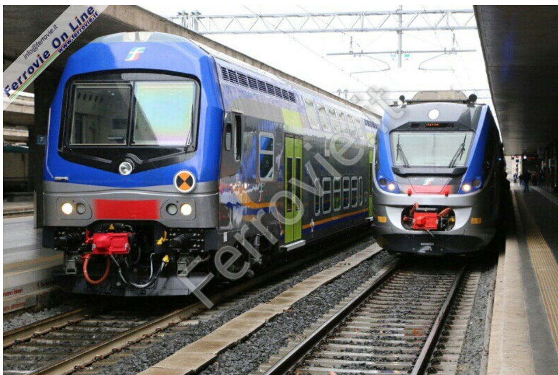
1. Il nuovo ETR.425 "Jazz" a Roma Termini. (27 marzo 2014)

I convogli battezzati "Jazz" e costruiti da Alstom, andranno inizialmente a rinforzare la flotta delle Regioni Marche, Umbria, Piemonte, Abruzzo, Calabria, Lombardia e Lazio.