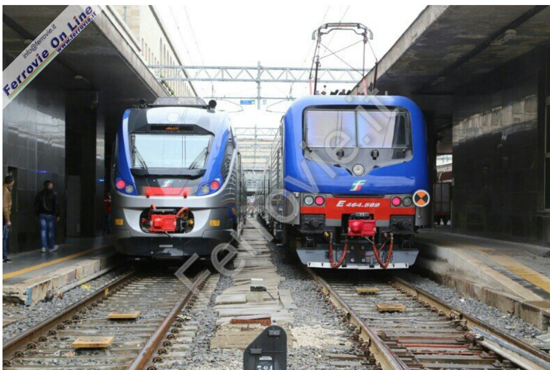
5. ETR.425 con la E.464.589 fianco a fianco durante la presentazione a Roma Termini. 27 marzo 2014

Moretti ne ha approfittato per rispondere al ministro delle Infrastrutture Lupi sulla quotazione in Borsa di FSI. "Non ho mai proposto la quotazione - ha detto stamattina Moretti - io sto facendo quello che il Mef mi sta chiedendo: mettere in chiarezza i conti per poter decidere che fare". Sul nodo del trasporto regionale, l'ad FSI ha spiegato che c'è un problema di risorse disponibili, con una piccola tiratina d'orecchie alle Regioni: "Non possiamo continuare a fare i servizi se ci sono clienti che pensano di pagarci tra due anni o due anni e mezzo. FS ha bisogno della certezza dei pagamenti. I pagamenti della Pa devono essere certi e nei tempi previsti".