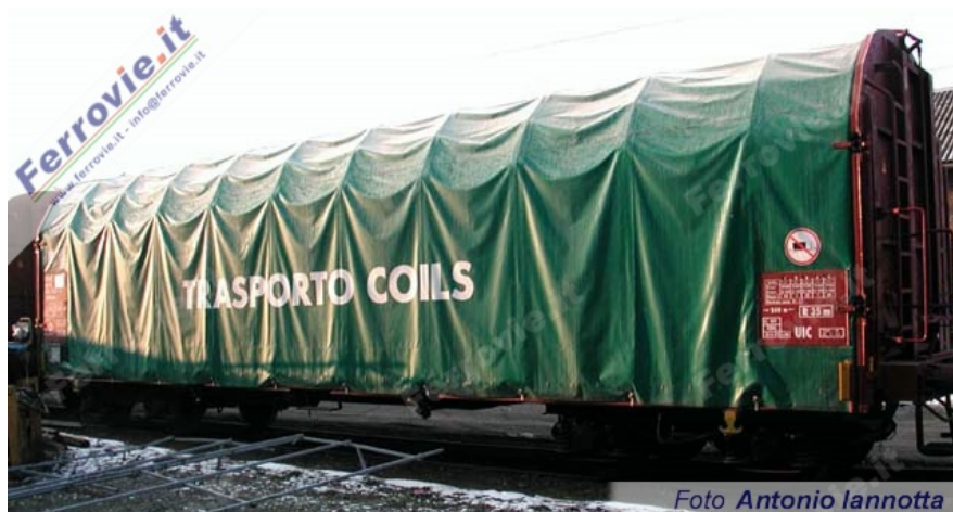
22 Un carro Rhilms al vero.