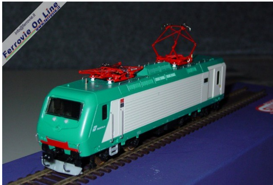
Vista di 3/4 (Foto Fabio Veronesi, 3 dicembre 2005)