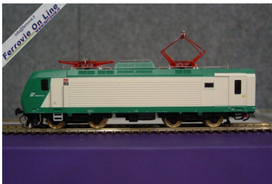
La vista laterale mette in evidenza i carrelli e la fiancata. (Foto Fabio Veronesi, 3 dicembre 2005)