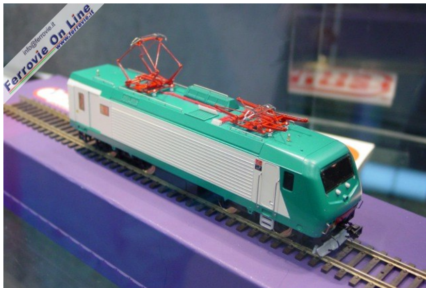
Vista d'insieme per la E.464 ViTrains, con in evidenza i pantografi. (Foto Fabio Veronesi, 3 dicembre 2005)