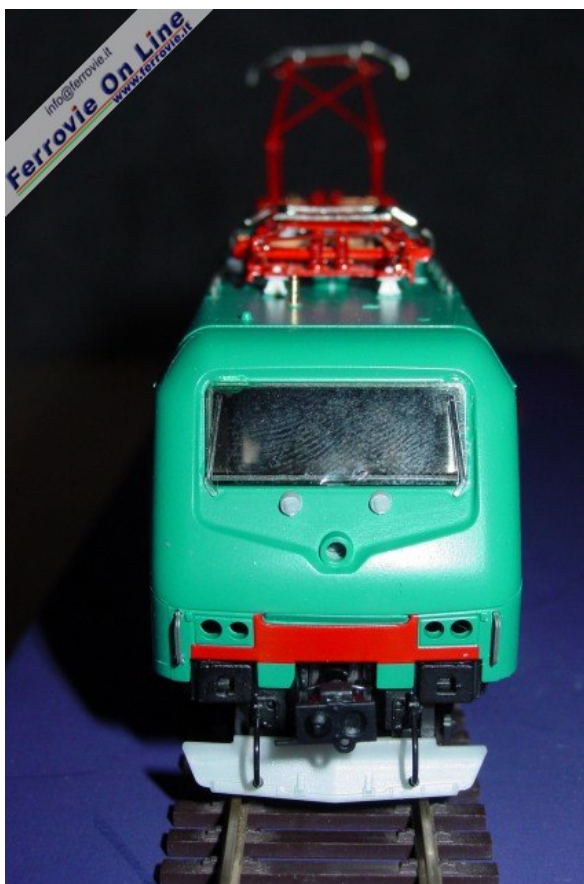
Vista frontale per la E.464 ViTrains. (Foto Fabio Veronesi, 3 dicembre 2005)

Oltre che dalla vicentina ViTrains, la E.464 sarà prodotta da ACME e Comofer (Gieffeci). Le immagini di seguito documentano lo stato di avanzamento del modello, pressoché completo.