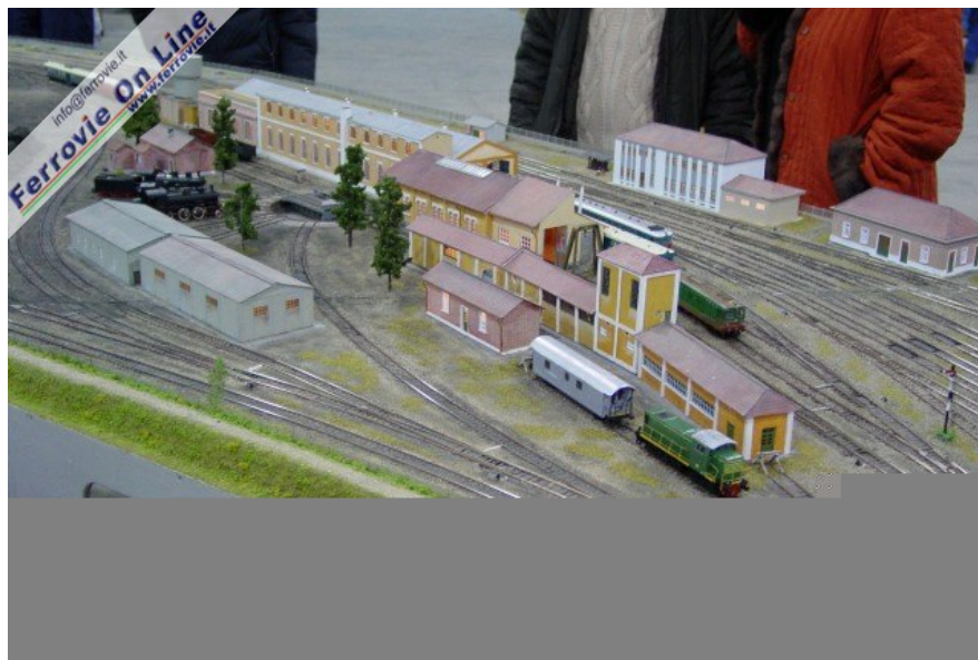
3 3 Vista del deposito locomotive all'estremità nord della stazione. (Foto Fabio Veronesi, 3 dicembre 2005)