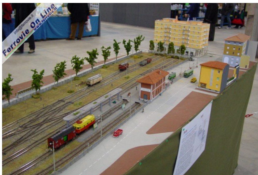
10. L'ormai celebre plastico di Treni & Tram Club riproducente la ferrovia Casalecchio - Vignola. (3 dicembre 2005)