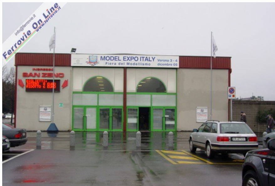
1 L'ingresso del Model Expo Italy in Fiera a Verona. (3 dicembre 2005)

VERONA - Si è svolta sabato 3 e domenica 4 dicembre nel quartiere fieristico di Verona la prima edizione di Model Expo Italy, Fiera internazionale del modellismo statico e dinamico, a cui hanno partecipato un centinaio tra aziende, club e associazioni di appassionati provenienti da tutte le regioni italiane.