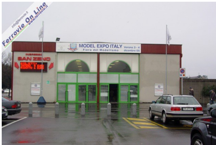
1. L'ingresso del Model Expo Italy in Fiera a Verona. (3 dicembre 2005)

VERONA - Si è svolta sabato 3 e domenica 4 dicembre nel quartiere fieristico di Verona la prima edizione di Model Expo Italy, Fiera internazionale del modellismo statico e dinamico, a cui hanno partecipato un centinaio tra aziende, club e associazioni di appassionati provenienti da tutte le regioni italiane.