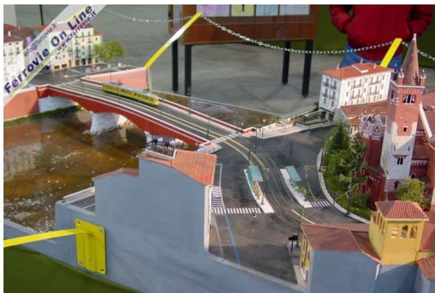
6. Incredibile la cura del dettaglio di questo diorama esposto negli spazi del DLF Verona. E' riprodotta la simulazione del percorso della futura tranvia di Verona in corrispondenza della chiesa di S. Fermo e di Ponte Navi. (Foto Fabio Veronesi, 3 dicembre 2005)