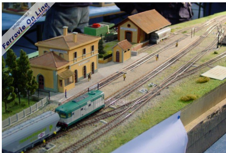
9. Ambientazione tipicamente italiana per questo bel diorama operativo, realizzato da Antonio Quaresima, esposto insieme ad altre notevoli realizzazioni dell'Associazione Modellismo Storico di Verona. (Foto Fabio Veronesi, 3 dicembre 2005)