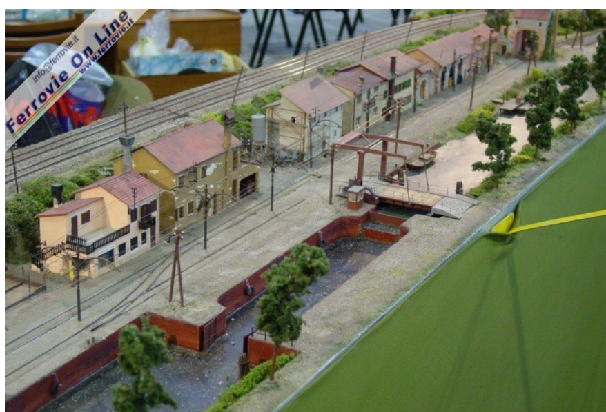
8. Ambientazione tranviaria per questo diorama operativo esposto negli spazi del DLF di Verona. Noto la riproduzione del ponte mobile e del sistema di chiuse del canale. (Foto Fabio Veronesi, 3 dicembre 2005)