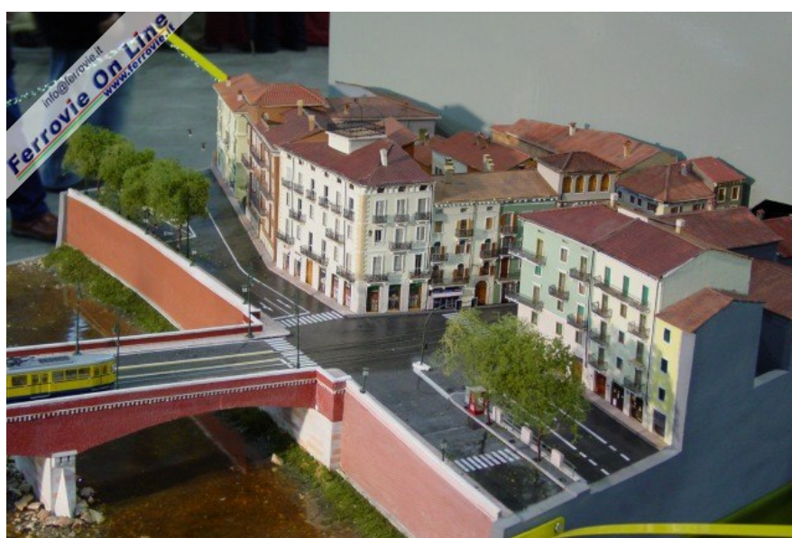
7. Altra vista con il dettaglio su Ponte Navi e Lungadige Sammiceli. (Foto Fabio Veronesi, 3 dicembre 2005)