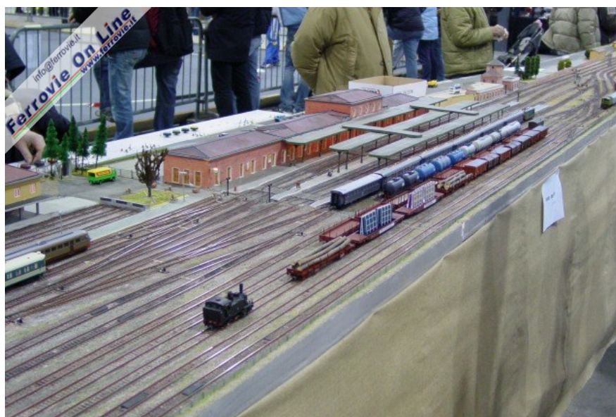
2. Il bel plastico del Gruppo fermodellistico del DLF di Mantova con la riproduzione della caratteristica stazione di Mantova; alla radice sud sono riprodotte anche le dramazioni verso Monselice, Modena e Cremona.

Di seguito una breve rassegna fotografica dei plastici e dei diorami a carattere ferroviario esposti in Fiera.