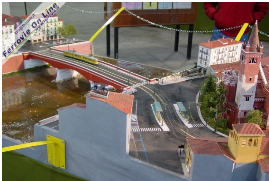
6. Incredibile la cura del dettaglio di questo diorama esposto negli spazi del DLF Verona. E' riprodotta la simulazione del percorso della futura tranvia di Verona in corrispondenza della chiesa di S. Fermo e di Ponte Navi. (Foto Fabio Veronesi, 3 dicembre 2005)