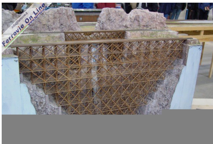
4 4 Superbo ponte in legno sul plastico di ambientazione americana di Antonio Zambelli di Bergamo. (Foto Fabio Veronesi, 3 dicembre 2005)