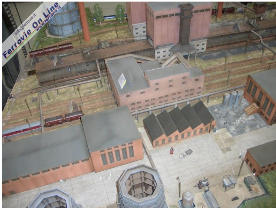
Un'altra vista degli impianti