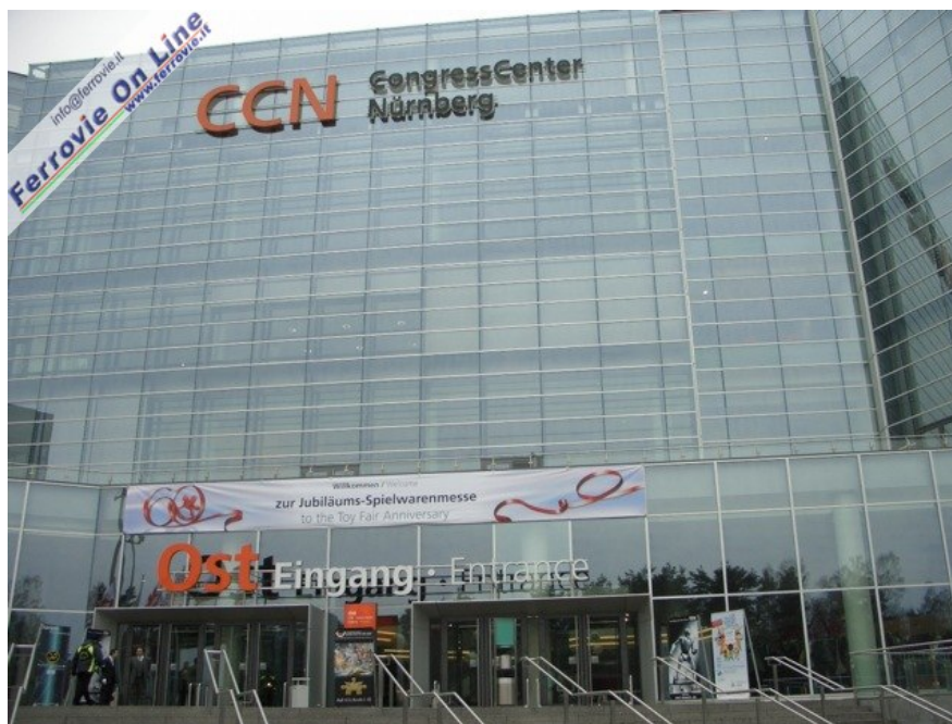
L'ingresso est del centro congressi che dal 5 al 10 febbraio ha ospitato la 60° Fiera del Giocattolo di Norimberga. (Foto Giancarlo Cariati, 6 febbraio 2009)

Con questa sequenza di foto scattate dall'amico Giancarlo Cariati, proviamo a vedere la kermesse di Norimberga da un'altra angolazione: quella di chi predilige i diorami che fanno degna cornice ai modelli proposti.