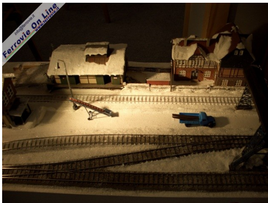
Ed il relativo scalo merci (Foto Giancarlo Cariati, 6 febbraio 2009)