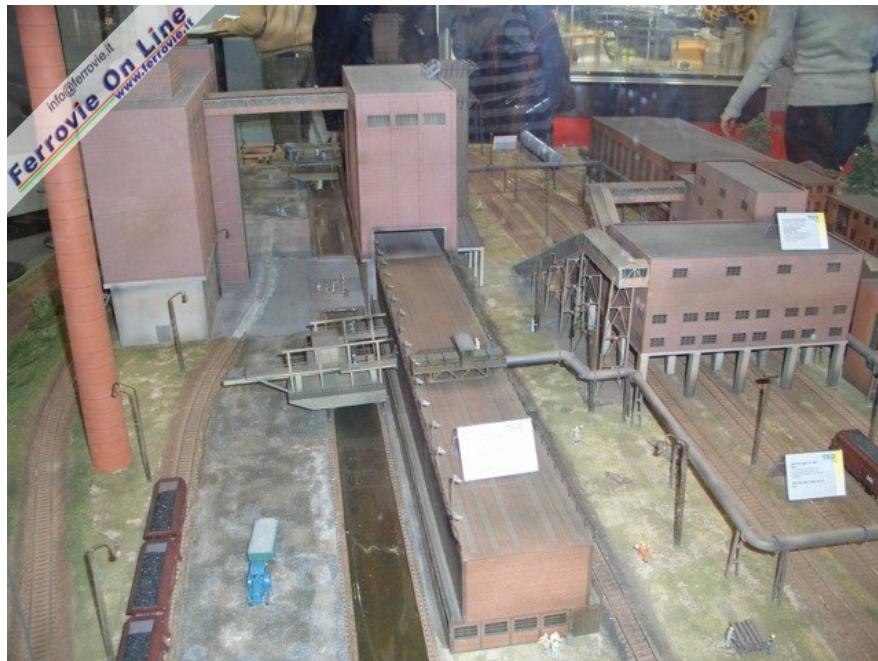
Canali e carri carichi di carbone (Foto Giancarlo Cariati, 6 marzo 2006)