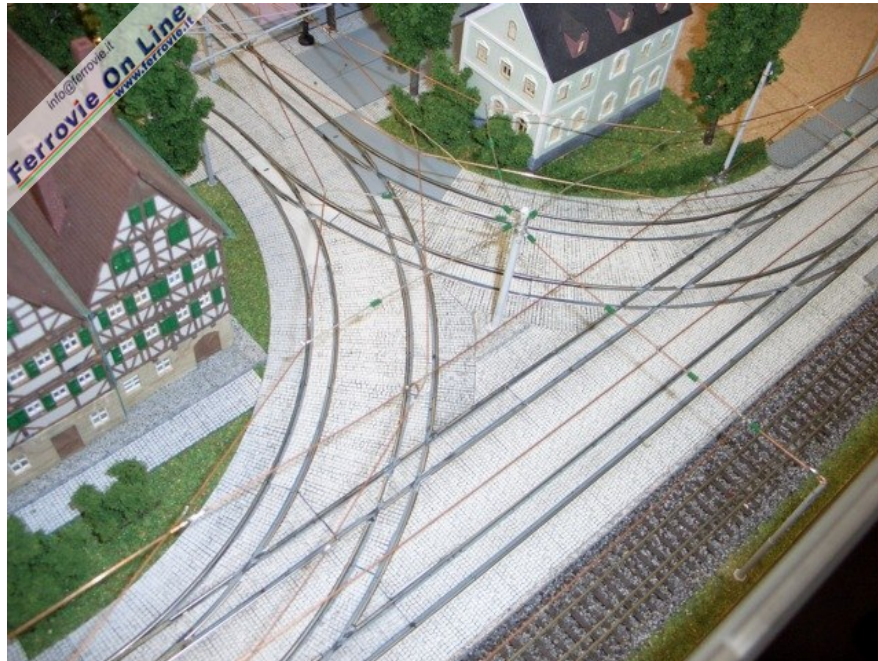
Impressionante questo crocevia tramviario. (6 febbraio 2009)