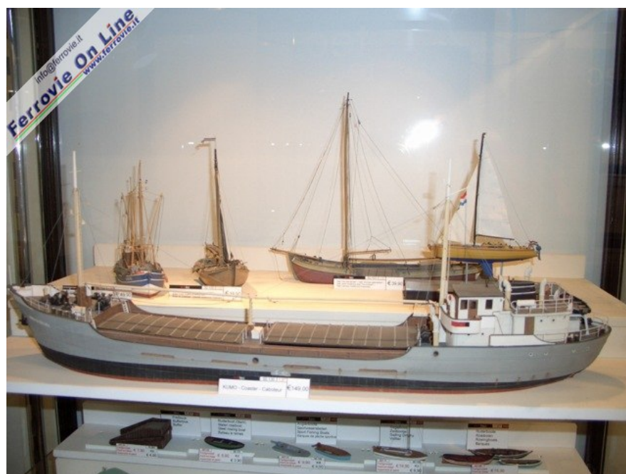
... anche in grande scala (Foto Giancarlo Cariati, 6 febbraio 2009)