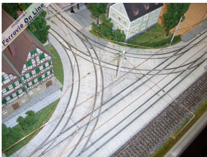
Impressionante questo crocevia tramviario. (Foto Giancarlo Cariati, 6 febbraio 2009)