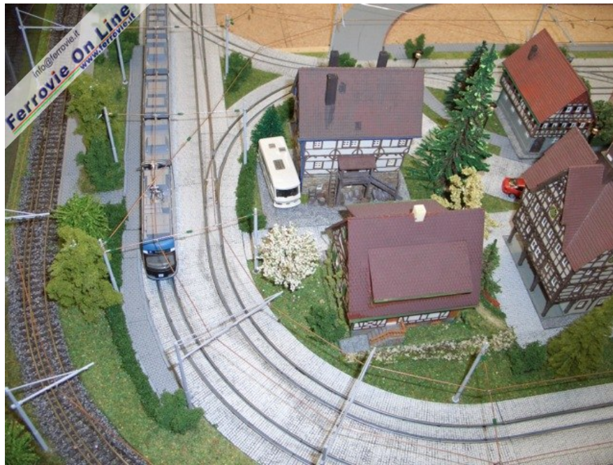
Molto interessante questo plastico con ferrovia a doppio scartamento e borgo servito da una estesa rete tramviaria...Foto Giancarlo Cariati, 6 febbraio 2009)