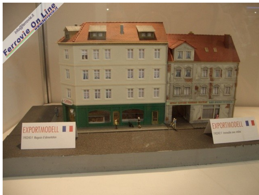
Dalla Francia due fabbricati per un centro storico proposti da Exportmodell (Foto Giancarlo Cariatì, 6 febbraio 2009)