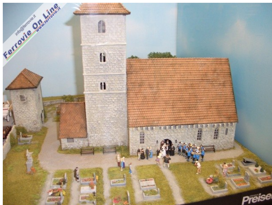
... culminante con uno sposalizio all'uscita della chiesetta. (Foto Giancarlo Cariatì, 6 febbraio 2009)