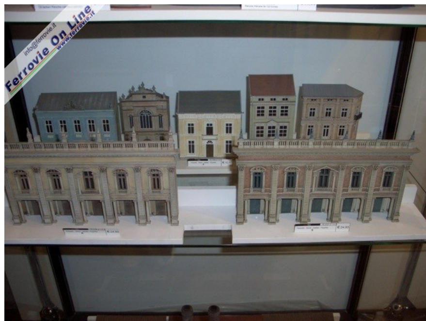
Eccone altri esempi ( Foto Giancarlo Cariati, 6 febbraio 2009 )