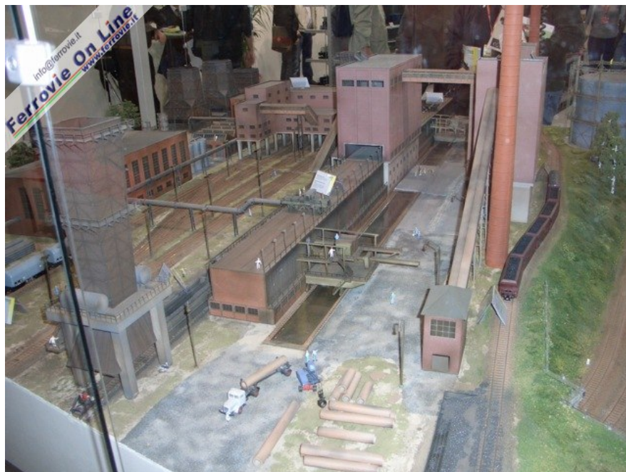
Da Trix questo imponente diorama a carattere industriale. (Foto Giancarlo Cariati, 6 febbraio 2009)