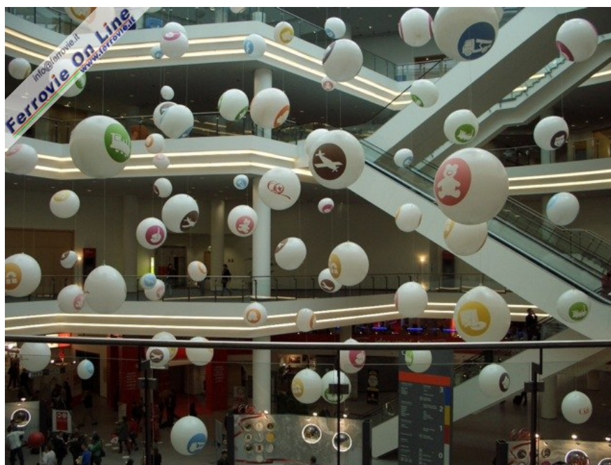
L'ampio salone di ingresso decorato con palloni rappresentativi dei diversi tipi di giocattoli. (Foto Giancarlo Cariati, 6 febbraio 2009)