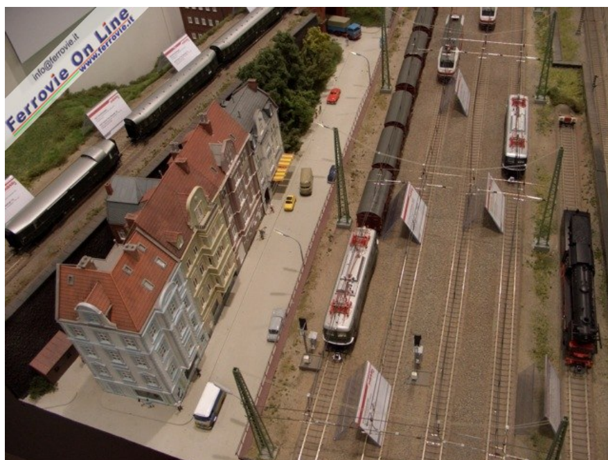
Uno scorcio dell'impianto dove erano esposti i rotabili della casa tedesca che sta attraversando un periodo di crisi. (Foto Giancarlo Cariatì, 6 febbraio 2009)