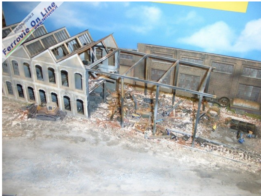
... si lavora per buttare giù anche il vecchio opificio. (Foto Giancarlo Cariati, 6 febbraio 2009)