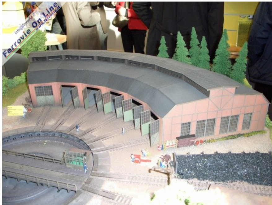
Da Noch questo deposito locomotive... (6 febbraio 2009)