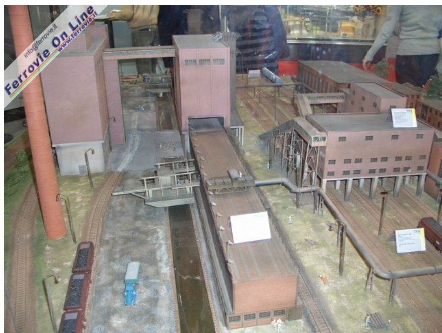
Canali e carri carichi di carbone (Foto Giancarlo Cariatì, 6 marzo 2006)