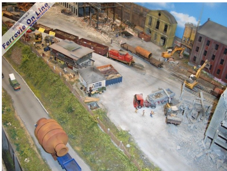
Poco più avanti fervono le attività di smaltimento delle macerie. (Foto Giancarlo Cariati, 6 febbraio 2009)