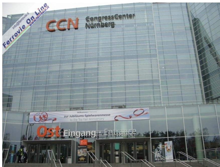
L'ingresso est del centro congressi che dal 5 al 10 febbraio ha ospitato la 60° Fiera del Giocattolo di Norimberga. 6 febbraio 2009

Con questa sequenza di foto scattate dall'amico Giancarlo Cariati, proviamo a vedere la kermesse di Norimberga da un'altra angolazione: quella di chi predilige i diorami che fanno degna cornice ai modelli proposti.