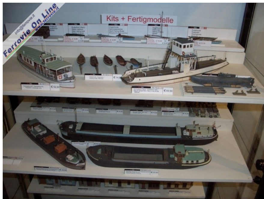
Bella varietà di imbarcazioni: dai semplici gozzi a chiatte e traghetti... (Foto Giancarlo Cariati, 6 febbraio 2009)