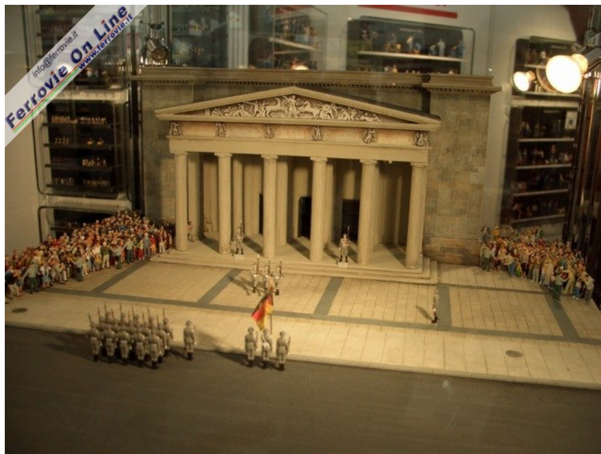
Da Preiser un tuffo nel passato con scene storiche...