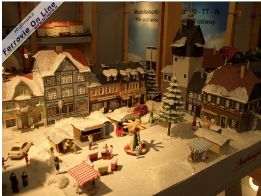
Un caratteristico borgo dall'architettura spiccatamente teutonica: la recente nevicata non impedisce una vivace vita sociale. (Foto Giancarlo Cariatì, 6 febbraio 2009)