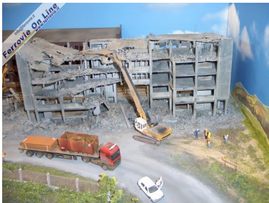
Ladeguter Bauer ha presentato un diorama ispirato al degrado delle periferie industriali in corso di ristrutturazione urbanistica. In questa prima immagine la demolizione di un fabbricato. (Foto Giancarlo Cariati, 6 febbraio 2009)