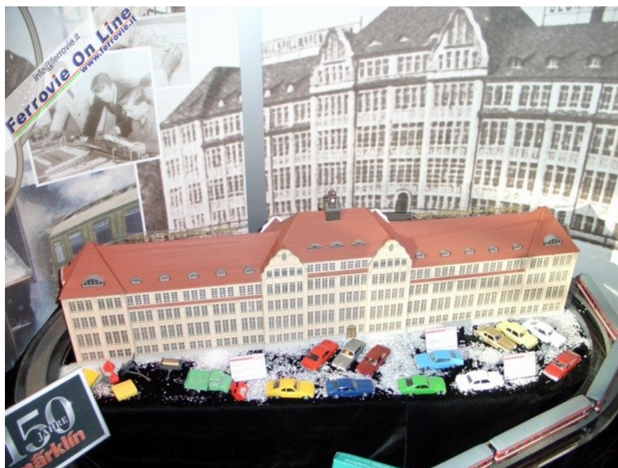
Märklin ha festeggiato i suoi 150 anni, ed i sessanta di partecipazione alla Spielwarenmesse, riproducendo lo storico fabbricato che accoglieva le attività produttive. (Foto Giancarlo Cariatì, 6 febbraio 2009)