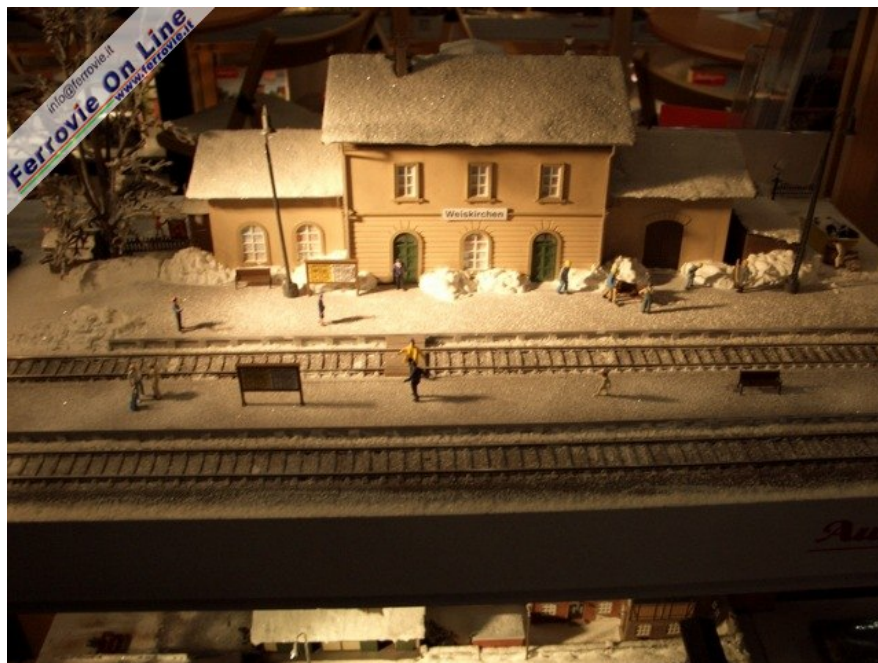
Un fabbricato viaggiatori non troppo caratterizzato.