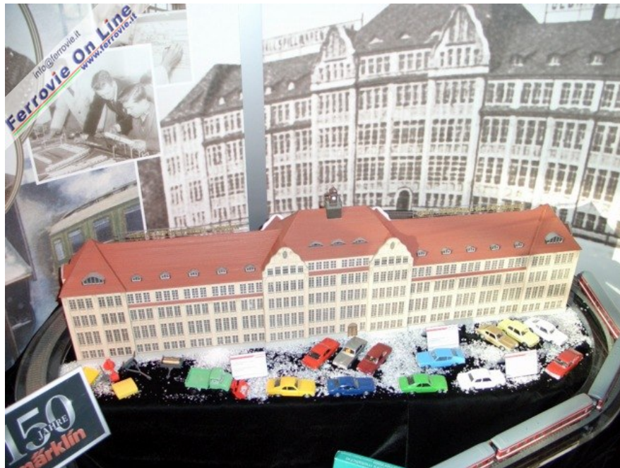
Märklin ha festeggiato i suoi 150 anni, ed i sessanta di partecipazione alla Spielwarenmesse, riproducendo lo storico fabbricato che accoglieva le attività produttive. Foto Giancarlo Cariati, 6 febbraio 2009