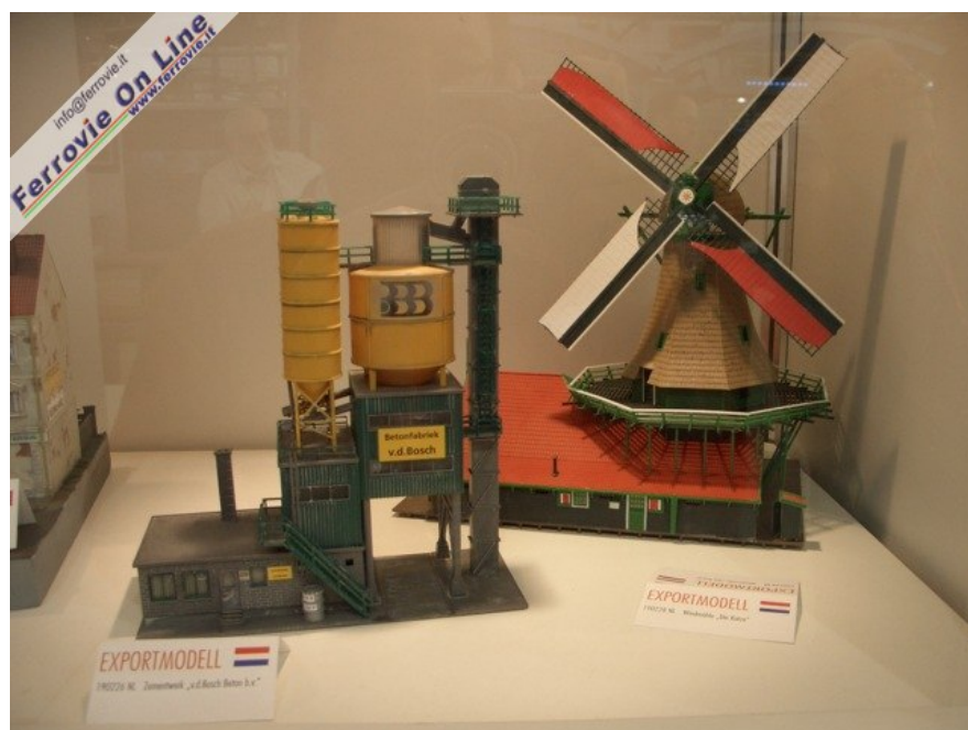
Un Silos ed un mulino a vento (Foto Giancarlo Cariatì, 6 febbraio 2009)