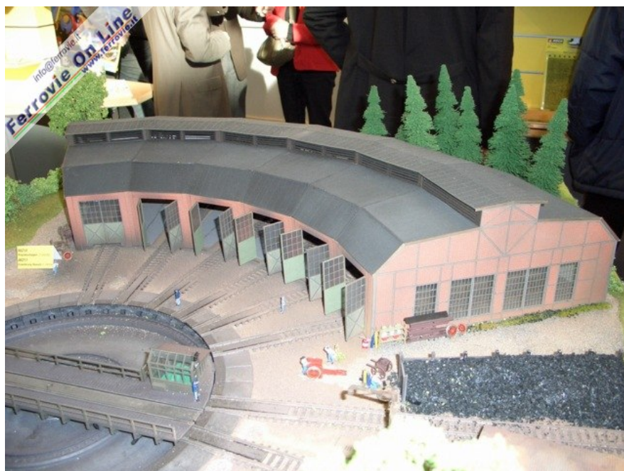
Da Noch questo deposito locomotive... (6 febbraio 2009)