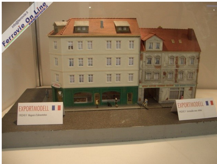
Dalla Francia due fabbricati per un centro storico proposti da Exportmodell (Foto Giancarlo Cariati, 6 febbraio 2009)