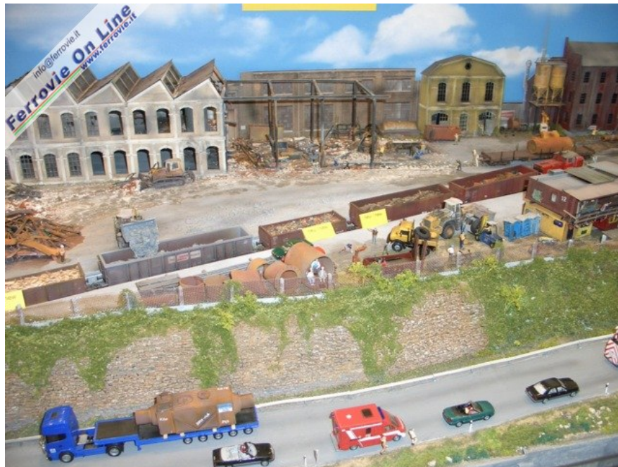
... per i quali ovviamente si impiega un treno di carri a sponde alte, mentre sullo sfondo... Foto Giancarlo Cariati, 6 febbraio 2009