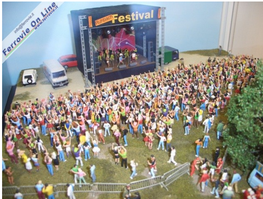
... fino all'allegria dei giorni d'oggi... (6 febbraio 2009)