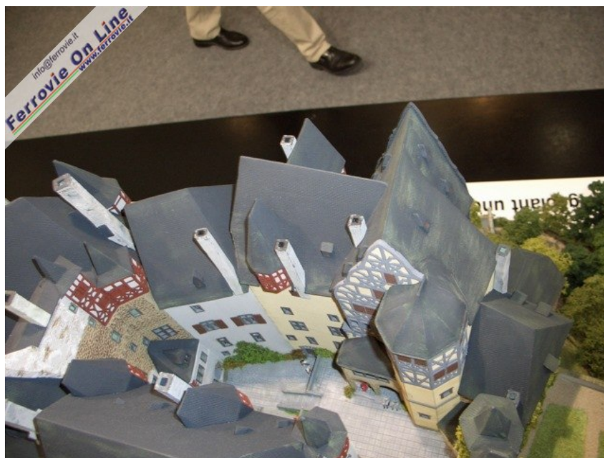
... ben curato anche nel cortile interno (Foto Giancarlo Cariatì, 6 febbraio 2009)