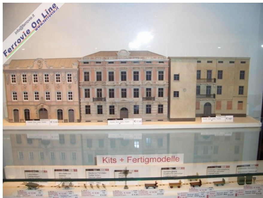
Le vetrine di Artitech presentavano queste belle facciate di palazzi ottocenteschi ed una bella varietà di carri, biciclette ad altri decori urbani. (Foto Giancarlo Cariatì, 6 febbraio 2009)