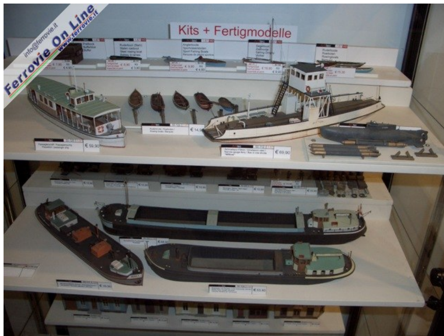
Bella varietà di imbarcazioni: dai semplici gozzi a chiatte e traghetti... (Foto Giancarlo Cariati, 6 febbraio 2009)