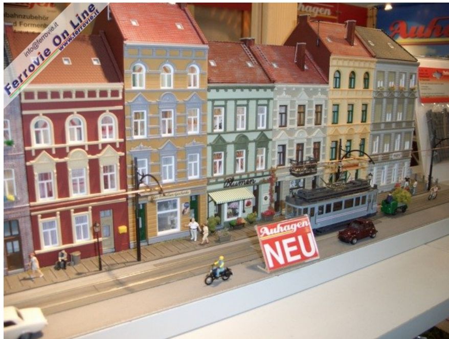
Da Auhagen questo bello scorcio di un centro storico attraversato da un tram (Foto Giancarlo Cariatì, 6 febbraio 2009)