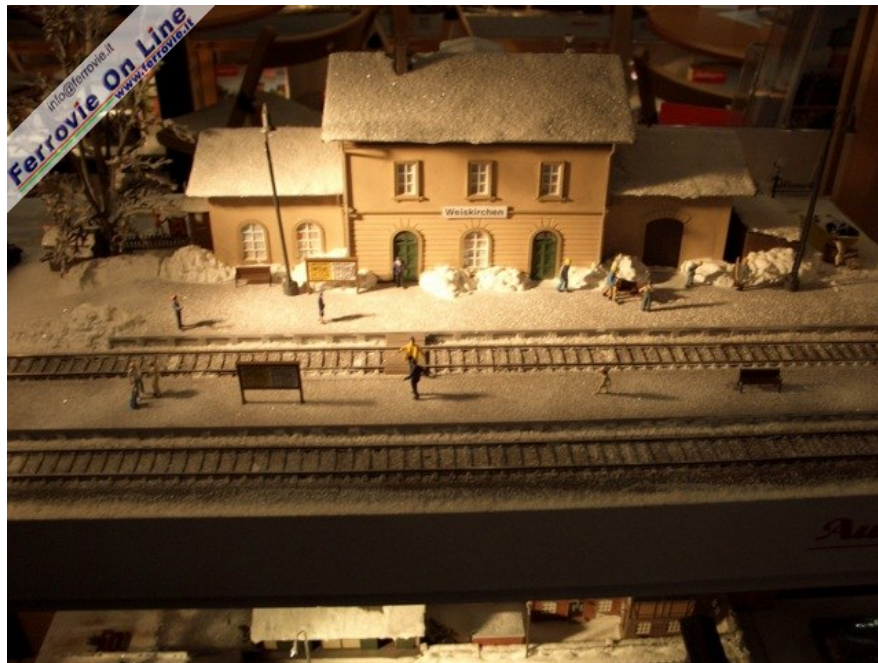
Un fabbricato viaggiatori non troppo caratterizzato. (Foto Giancarlo Cariati, 6 febbraio 2009)