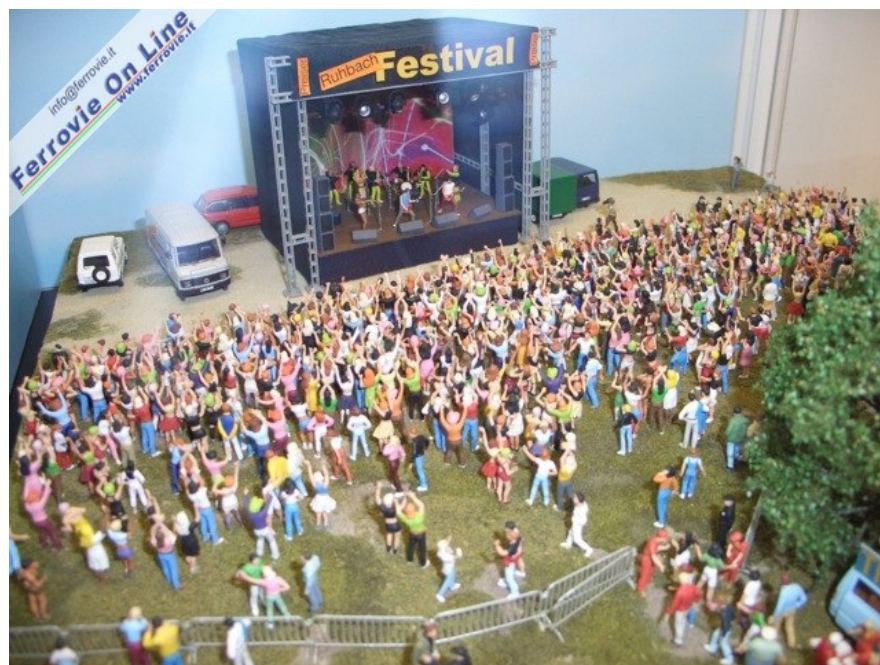
... fino all'allegria dei giorni d'oggi... (6 febbraio 2009)