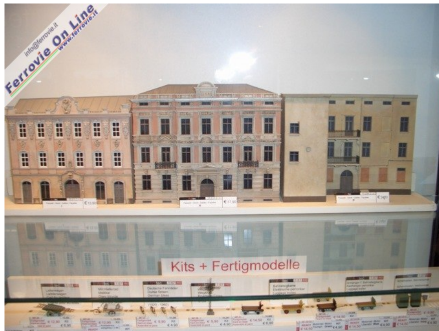
Le vetrine di Artitech presentavano queste belle facciate di palazzi ottocenteschi ed una bella varietà di carri, biciclette ad altri decori urbani. Foto Giancarlo Cariati, 6 febbraio 2009