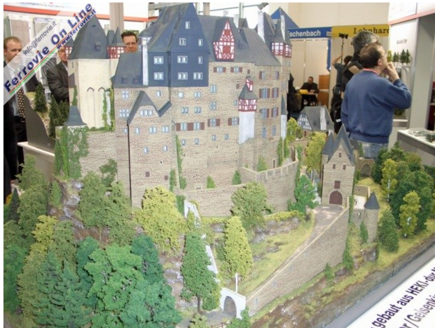
Nello stand della Heki troneggiava questo imponente castello (Foto Giancarlo Cariati, 6 febbraio 2009)