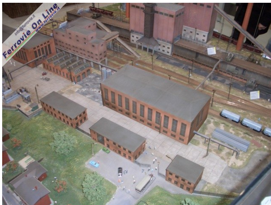
L'ingresso con le palazzine uffici. (Foto Giancarlo Cariati, 6 febbraio 2009)