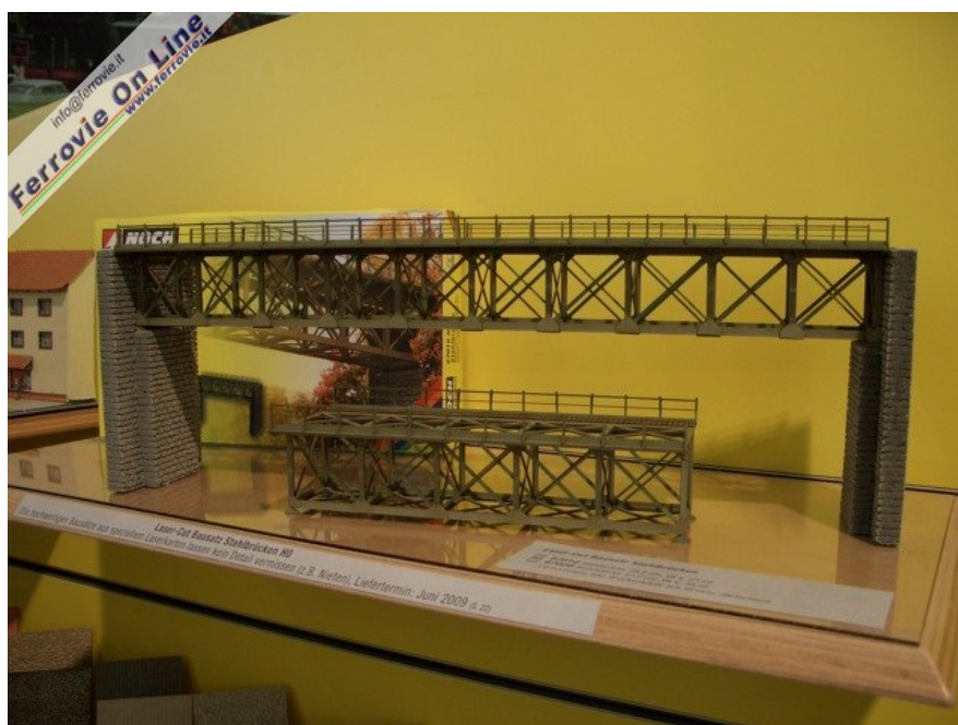
... e queste snelle travate metalliche. (Foto Giancarlo Cariati, 6 febbraio 2009)