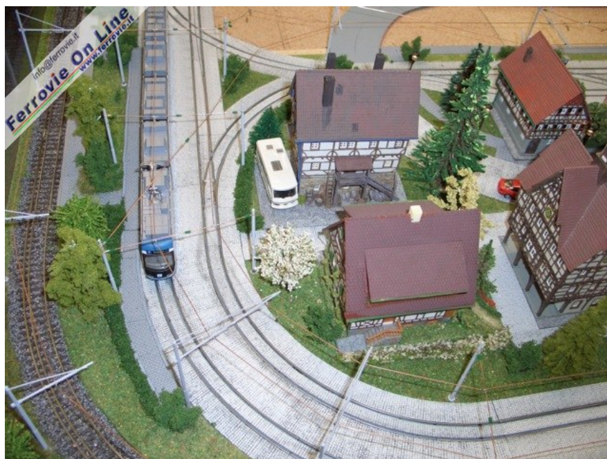
Molto interessante questo plastico con ferrovia a doppio scartamento e borgo servito da una estesa rete tramviaria... (Foto Giancarlo Cariati, 6 febbraio 2009)