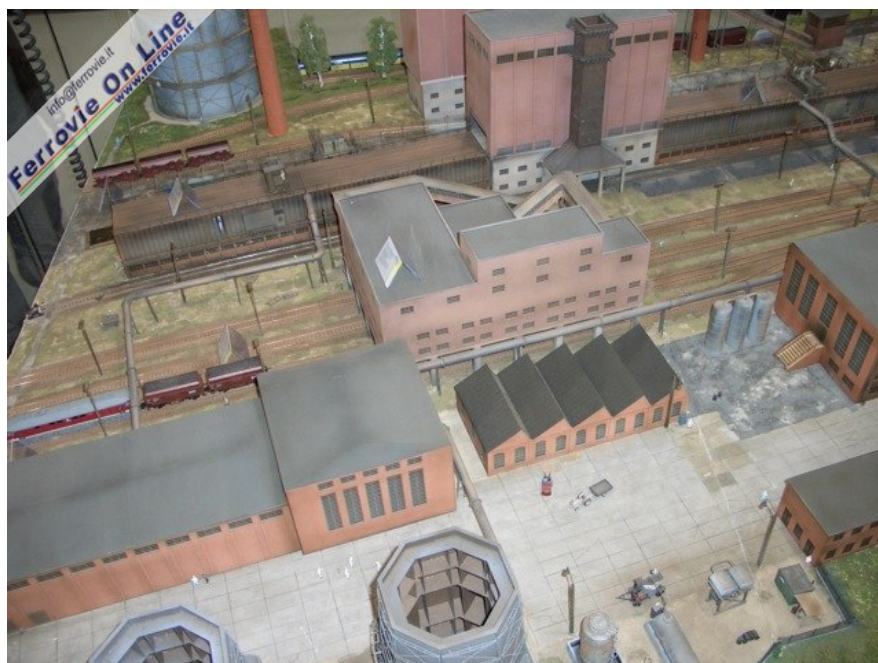
Un'altra vista degli impianti (Foto Giancarlo Cariatì, 6 febbraio 2009)