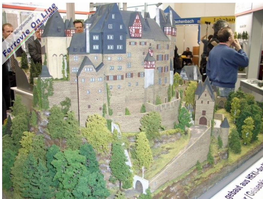
Nello stand della Heki troneggiava questo imponente castello (Foto Giancarlo Cariatì, 6 febbraio 2009)