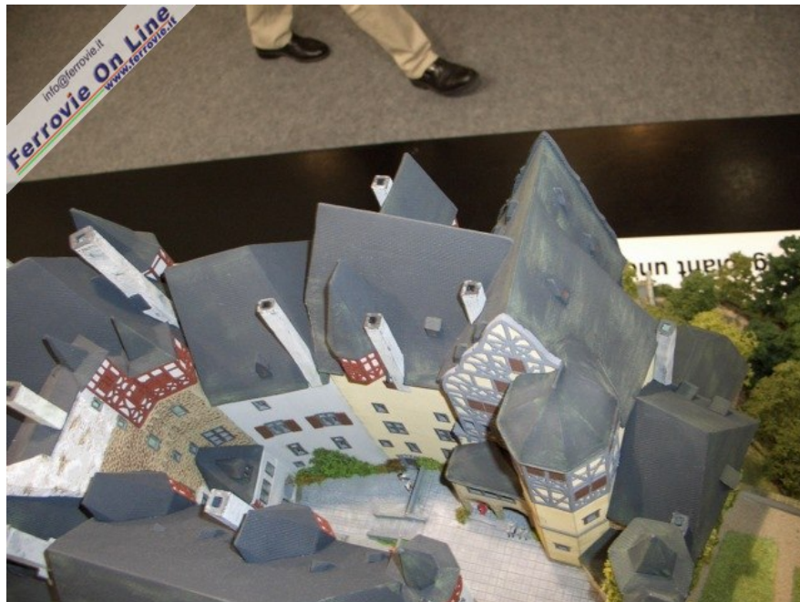
... ben curato anche nel cortile interno (Foto Giancarlo Cariati, 6 febbraio 2009)