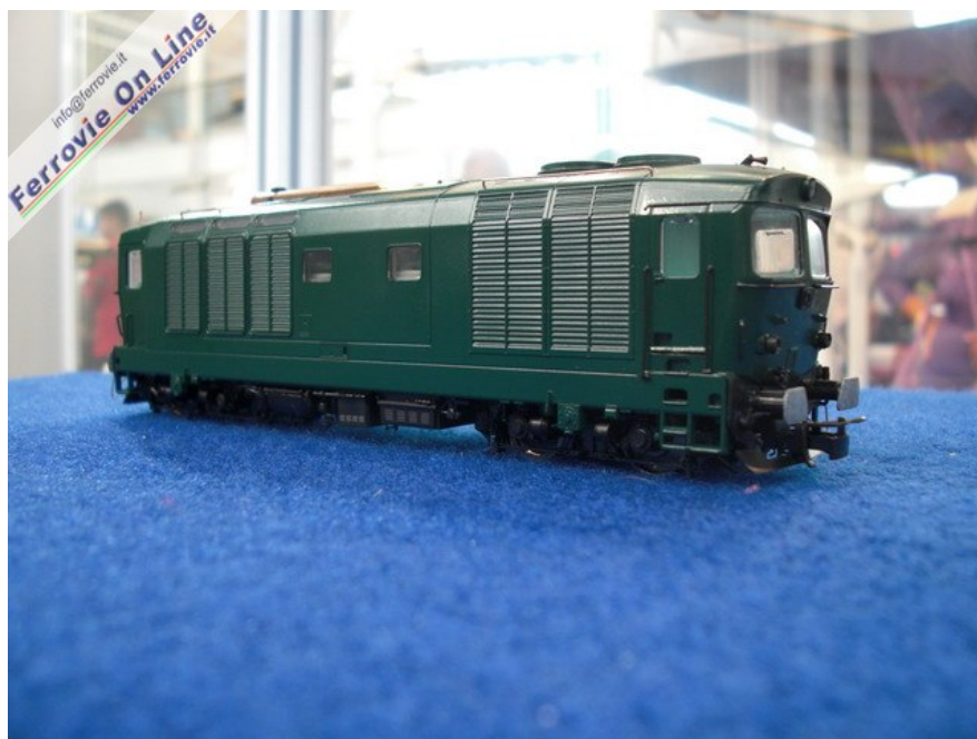
6 La D.445 in avanzato stadio di realizzazione.

Imminente la consegna della D.445 seconda serie. Caratteristiche tecniche e tecnologia allineate alla D.443 già uscita. Previste tre numerazioni, due MDVC ed una XMPR, tutte con presa per decoder e predisposte per il sound. Anche il prezzo si allinea con quello delle D.443, intorno ai 180 euro.