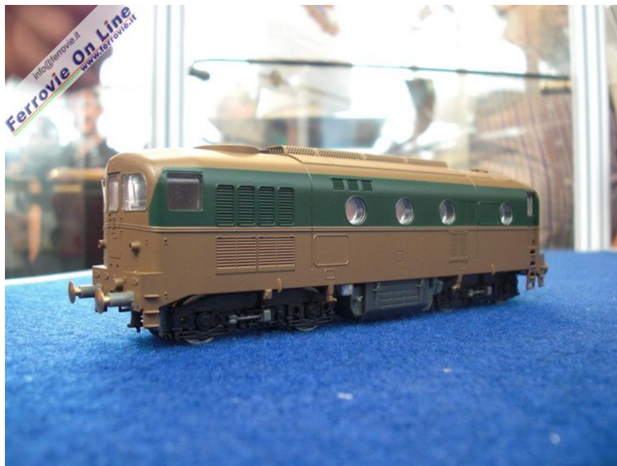
5 La D.341 completamente rifatta e con la livrea incompleta per evidenziare la cassa realizzata in un unico pezzo.

I possessori della precedente versione avranno la possibilità di sostituirla gratuitamente con la nuova. Chi vorrà trattenere il vecchio modello potrà farlo ad un prezzo forfettario ancora da stabilire.