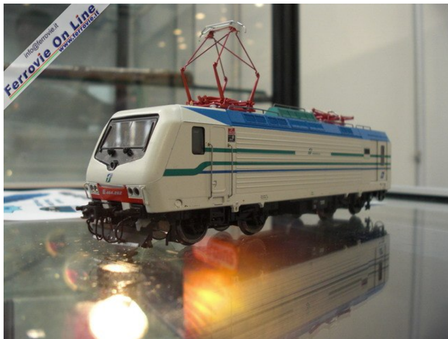
Livrea Vivalto per la E.464

Le foto ritraggono campioni di preproduzione solo indicativi della qualità dei modelli definitivi.