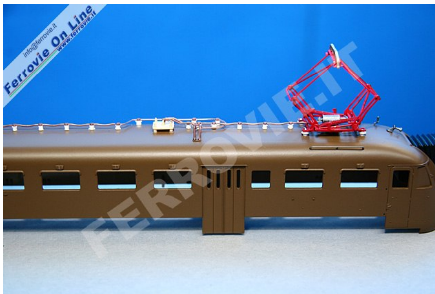
1. Particolare della nuova carrozzeria per l'ALe 840.010 di ViTrains. Oltre al corretto posizionamento del tetto, risalta il pantografo adesso più basso sull'imperiale. Foto David Campione, 7 marzo 2010

Come anticipato dalla stessa ViTrains lo scorso febbraio, le casse saranno fornite gratuitamente in sostituzione di quelle errate attraverso i negozianti, che riceveranno lo stesso quantitativo delle confezioni acquistate. Non verrà richiesta la restituzione della cassa originale.