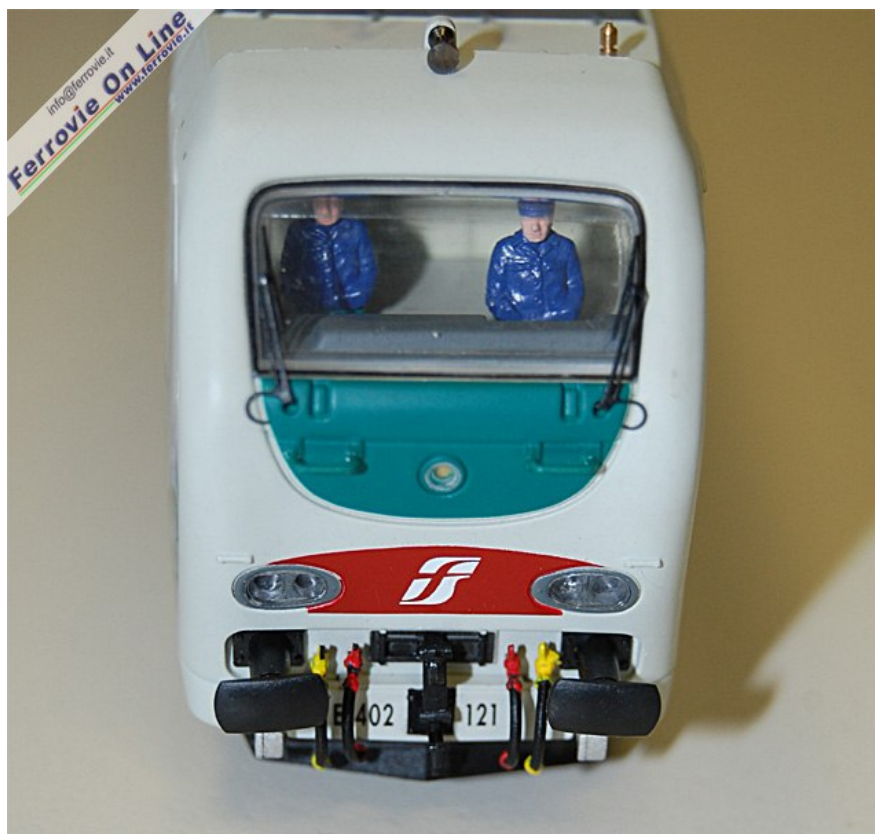
1. Frontale della E.402.121. Spiccano i tergicristallo in metallo e l'interno della cabina ben visibile attraverso l'ampio vetro frontale.

Tornano sugli scaffali dei negozi di modellismo le E.402B. Con gli articoli HR2219 e HR2220, rispettivamente E.402B.121 in livrea XMPR e 172 in livrea d'origine, Rivarossi Hornby ripropone con alcune migliorie il modello già commercializzato nel 2000 da Rivarossi Italia.