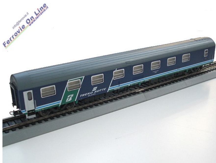
1 1 Scala H0 - Carrozza letti tipo T2s di Trenitalia in livrea XMPR, nella versione con carrelli FIAT e logo FS grande - Heris Art. 16037 25 settembre 2010

Di quest'ultima casa sono state presentate in fiera alcune novità, tra cui due carrozze letti tipo T2s di Trenitalia in livrea XMPR. Una versione monta carrelli FIAT e logo FS grande, Art. 16037; l'altra dispone di carrelli Minden-Deutz, logo FS piccolo con scritta "Trenitalia" e pittogramma "non fumatori" in prossimità delle porte di salita, Art.16038. Disponibili nei negozi nelle prossime settimane.