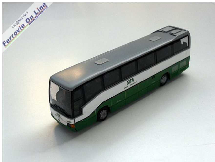
2 Scala H0 - Pullman Mercedes in livrea SITA - Rietze (Foto Fabio Veronesi, 25 settembre 2010)

Da Rietze in scala H0 un inedito pullman Mercedes in livrea SITA.