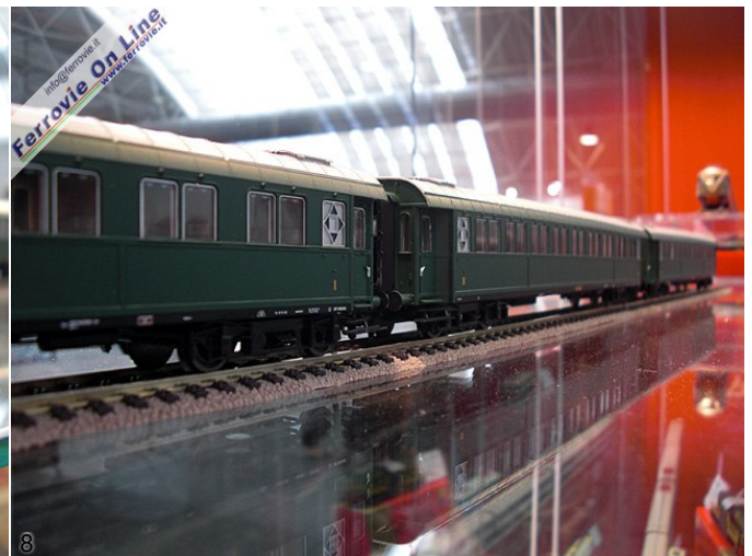
7. Praticamente pronta la Regina 685, che sarà disponibile entro fine anno. (Foto David Campione, 26 settembre 2010) 8. Le tre carrozze Tipo 1931 che compongono il Diretto 479 Venezia - Bologna. (Foto David Campione, 26 settembre 2010)

Modello completamente nuovo la carrozza letti T2s con carrelli Minden Deutz, in livrea di origine con scritta TEN e nell'attuale livrea XMPR. Seguono i modelli ÖBB, DB (di cui verrà presentata anche la versione in livrea rossa) e SBB presentati a Norimberga 2010. Nei negozi per novembre, prezzo di listino 50 Euro circa.