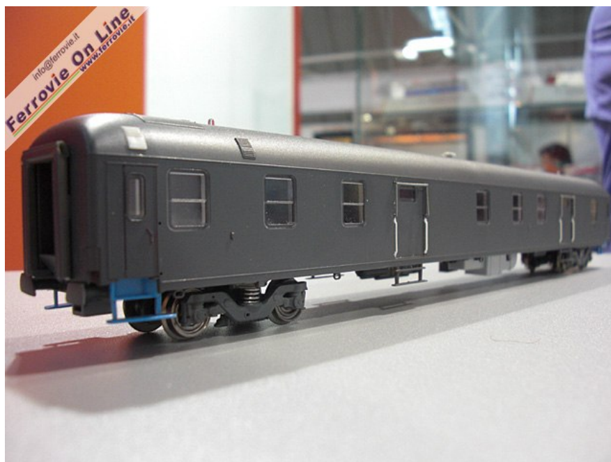
11. L'inedito postale UIC-X di ACME, con nuovi carrelli particolarmente dettagliati con la riproduzione dei dischi dei freni e della sospensione primaria riportata. (Foto David Campione, 26 settembre 2010)

Pressoché pronta anche la D.342, di cui in fiera è stato presentato uno stampo della cassa definitivo.