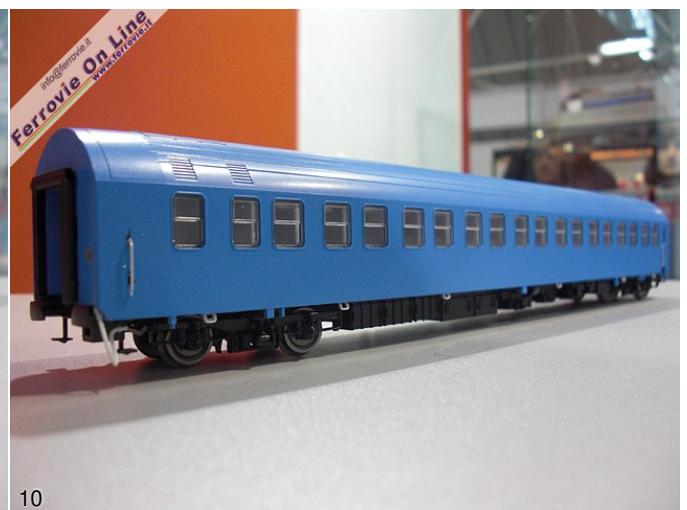
9. La nuova T2s di ACME, con carrelli Minden Deutz, vista lato corridoio. (Foto David Campione, 26 settembre 2010) 10. La medesima carrozza vista lato cabine con la lunga fila di finestrini. (Foto David Campione, 26 settembre 2010)

Completamente nuovo anche il postale Tipo X 1976, che monta carrelli FIAT di nuovo tipo con riportati i freni a disco e sospensione primaria è riprodotta con un aggiuntivo in metallo.