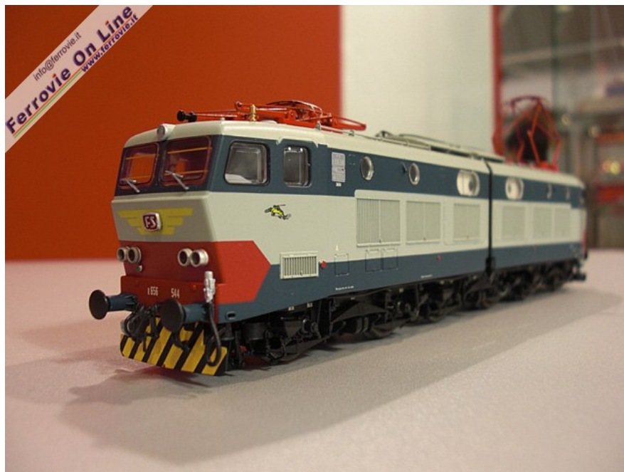
14. Nuova versione di V serie per la E.656 ACME. (Foto David Campione, 26 settembre 2010)

Infine sul piano dell'editoria ACME annuncia all'Hobby Model Expo di Novegro due interessanti novità.