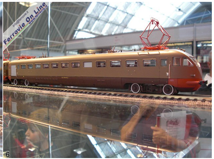
5. ALe 880 con copripugno di ACME, articolo 70017, disponibile nei negozi nell'ultima settimana di settembre. (Foto David Campione, 26 settembre 2010) 6. Sarà disponibile successivamente la coppia di ALe 790, articolo 70018. (Foto David Campione, 26 settembre 2010)

In consegna anche il Diretto 479 Venezia - Bologna (Roma), treno in Epoca II in confezione da tre carrozze Tipo 1931 rispettivamente di I, II e III classe, ideali da inserire in composizione con locomotive trifase E.432 in nero, con il quale hanno viaggiato fino al 1934 tra Firenze - Pistoia - Bologna.