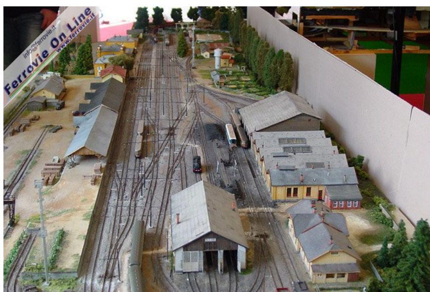
Plastico "Da Merano alla Toscana" Autori Renato e Rudi Ippindo Scala N La realizzazione del plastico modulare rappresenta due tappe del percorso esistenziale dell'autore Renato che, nato e cresciuto a Merano, ha poi completato gli studi ed ha iniziato a lavorare in Toscana. Costruito in scala N, congiunge la stazione di Merano, rappresentata nel periodo a cavallo tra gli anni '50 e '60...