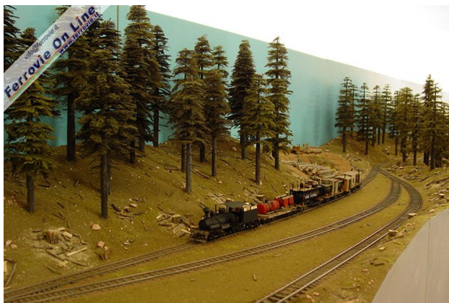
Plastico "Woodbridge Lumber" Autore Club Fermodellisti Silandro Scala H0 Il plastico è costituito da 14 elementi e mostra una riproduzione dettagliata, degli anni che vanno dal 1920 al 1950, di una ferrovia americana per il trasporto di legname e per il trasporto di materiale minerario.