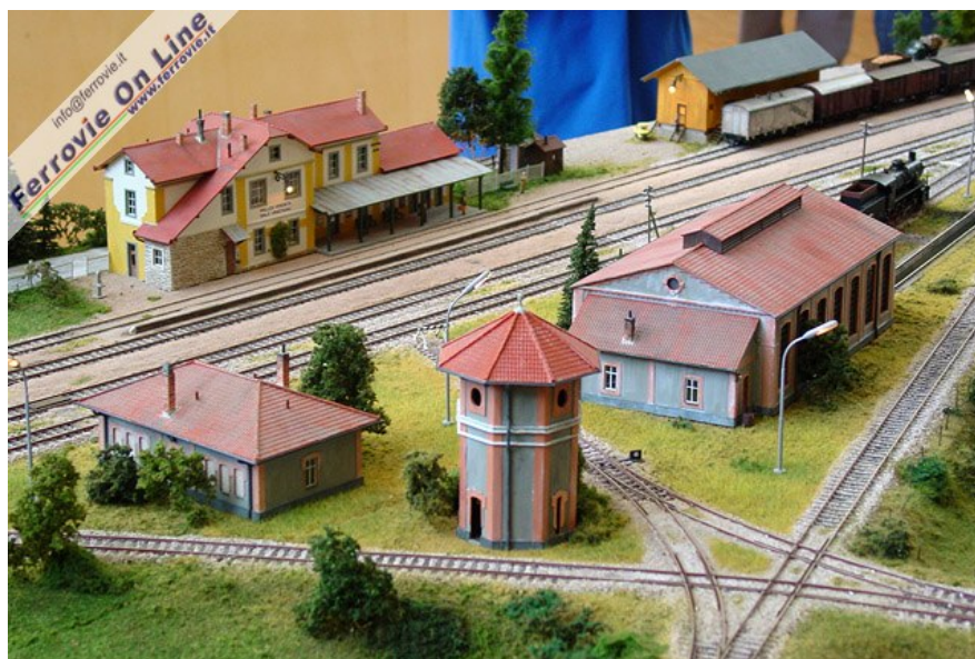
Plastico "Stazione di Malles" Autore Moritz Gretzschel Scala H0 Parte del grande plastico modulare a norma FREMO "Ferrovia della Val Venosta", riproduce la stazione terminale di Malles Venosta. La stella per la giratura delle locomotive è un'autocostruzione integrale.