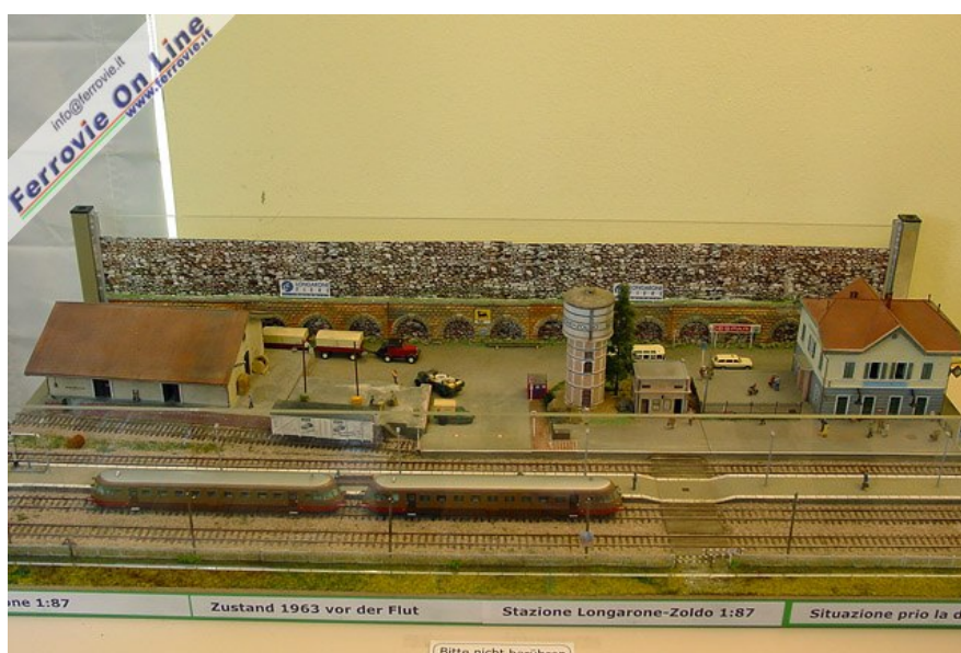
Diorama "Stazione di Longarone" Autore Detlef Vogel Scala H0 Su un diorama di 120 x 60 cm è stata riprodotta la stazione di Longarone, sulla linea Venezia - Calalzo, come si presentava prima della tragedia del Vajont del 1963 che l'ha completamente rasa al suolo.