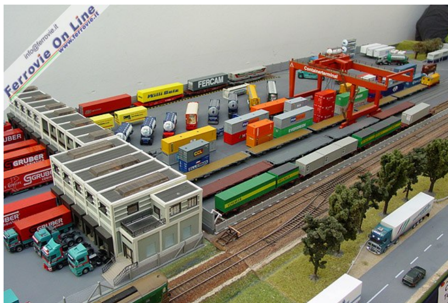
Plastico "Terminal intermodale" Autore Rino Danzico Scala H0 Il Terminal Intermodale è dotato di una gru a portale digitalizzata che consente il carico e lo scarico dei container e delle casse mobili dai convogli ferroviari che operano all'interno dell'area, movimentando gli stessi dai raccordi di scarico al binario di presa e consegna e successivamente da e per il binario di transito. Decine e decine di casse mobili, di container e di semirimorchi fanno di questo impianto un unico multicolore diorama.