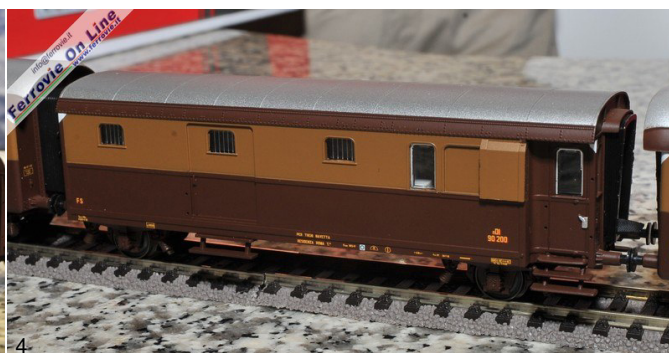
3. Il set per allungare la composizione del convoglio navetta con E.424, include ulteriori due carrozze Corbellini in castano - Isabella... (Foto Mauro Terrone, 11 maggio 2013) 4. ...ed un bagagliaio a due assi serie nDi 90000. (Foto Mauro Terrone, 11 maggio 2013)

Versione definitiva anche per la E.402B presentata. Sarà riprodotto il numero di servizio 134, con dettagli sconosciuti per le precedenti produzioni commerciali di questo modello, con trazione bassa fedelmente riprodotta, così come il tetto completo di tutte le apparecchiature. La consegna della E.402.134 è prevista per fine giugno.