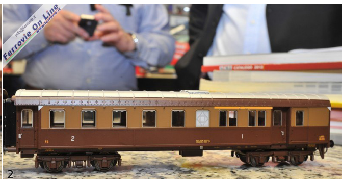
1. La E.424.070 di ACME con porta frontale, inclusa nel set con due carrozze Corbellini ed una pilota. (Foto Mauro Terrone, 11 maggio 2013) 2. La carrozza pilota Abdz 68000 (Foto Mauro Terrone, 11 maggio 2013)

Per il completamento del "treno navetta" in castano - Isabella è pronto anche il set aggiuntivo che sarà composto da ulteriori due Corbellini ed un bagagliaio due assi nDI. Anche in questo caso l'appuntamento nei negozi è fissato per fine maggio, con il prezzo indicativo di 160 euro.