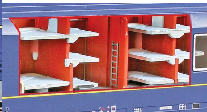
3. Spaccato della carrozza che lascia vedere gli arredamenti interni fedelmente riprodotti, con allestimenti differenti in ciascuna cabina.

Quattro le versioni proposte da Acme, disponibili in due fasi: