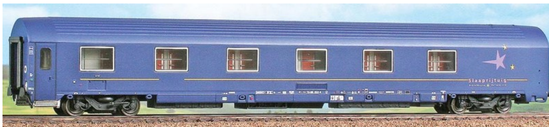
1. Carrozza con letti con marcatura internazionale 61 14 70-90, con livrea attuale ambientabile in epoca VI.

Novità notturna a sorpresa da ACME. In occasione del Modelbouw di Utrecht e del Modellbau di Vienna, la casa milanese ha presentato il nuovo modello della carrozza letti Tipo MUn, ultimo tipo di vettura letti realizzata dalla Compagnia Internazionale delle Carrozze Letti.