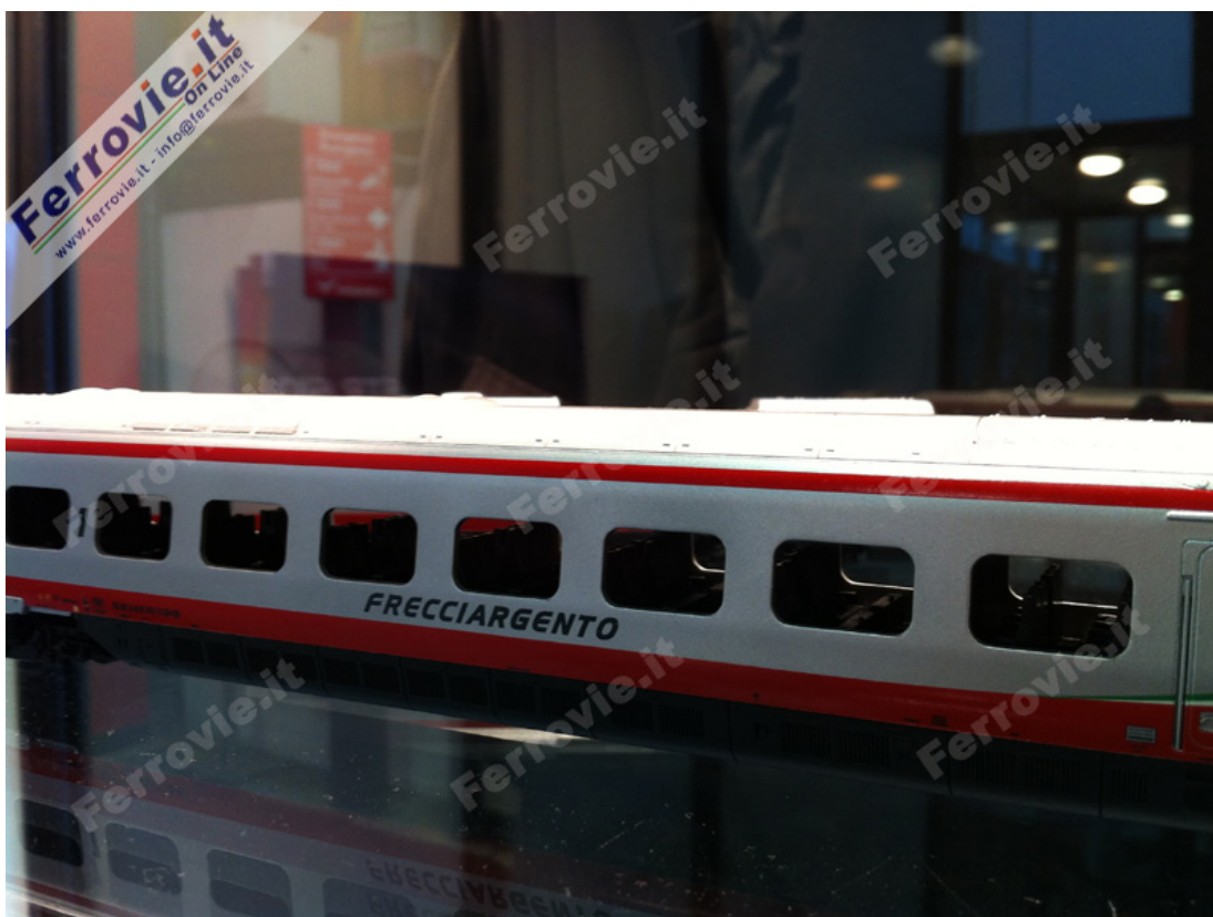
Gli ampi finestrini del nuovo Pendolino lasciano vedere gli interni, con arredamenti completamente riprodotto. La prima versione proposta sarà in livrea Frecciargento allo stato attuale. (Foto Ferrovie.it , 16 novembre 2013)