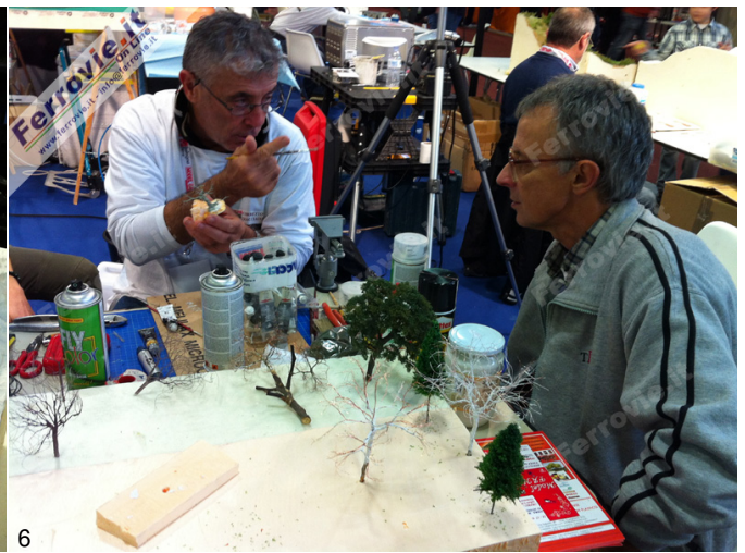
5. Un diorama in costruzione nello stand di Corretto tracciato (Foto Ferrovie.it, 16 novembre 2013)