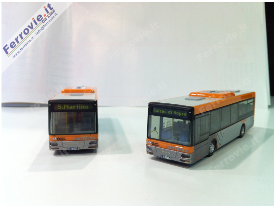
11. Due pullman MAN per l'alto atesina Gatterer, con destinazione S.Martino e Falzes di Sopra, sono prodotti da VK Models. 16 novembre 2013

Gieffeci, importatore per l'Italia di Roco e Fleischmann, esponeva l'ormai collaudata centralina Z21, che attira sempre le attenzioni di giovani e meno giovani. Attraverso la Z21 collegata in Wi-Fi ad un tablet o smartphone è infatti possibile gestire liberamente la circolazione su un impianto, senza i vincoli imposti dai tradizionali apparati a filo.