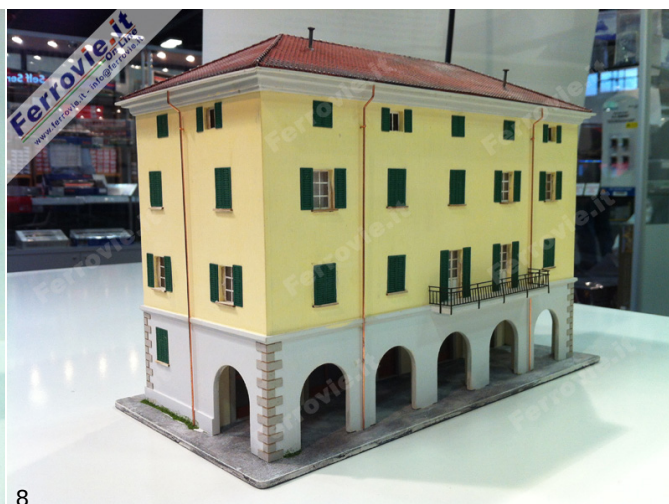
7. Con il marchio Scene Doc, dal 2014 Doc Models presenterà degli inediti fabbricati in perfetto stile italiano, costruiti in compensato e cartoncino. (Foto Ferrovie.it, 16 novembre 2013)