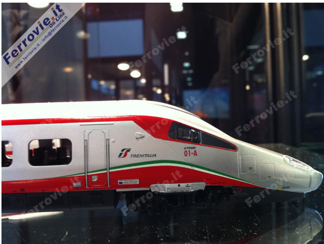
L'ETR.610 di Lima Expert, primo esemplare con la verniciatura definitiva di fabbrica, preannuncia l'imminente consegna del modello nei canali di vendita. (Foto Ferrovie.it, 16 novembre 2013)