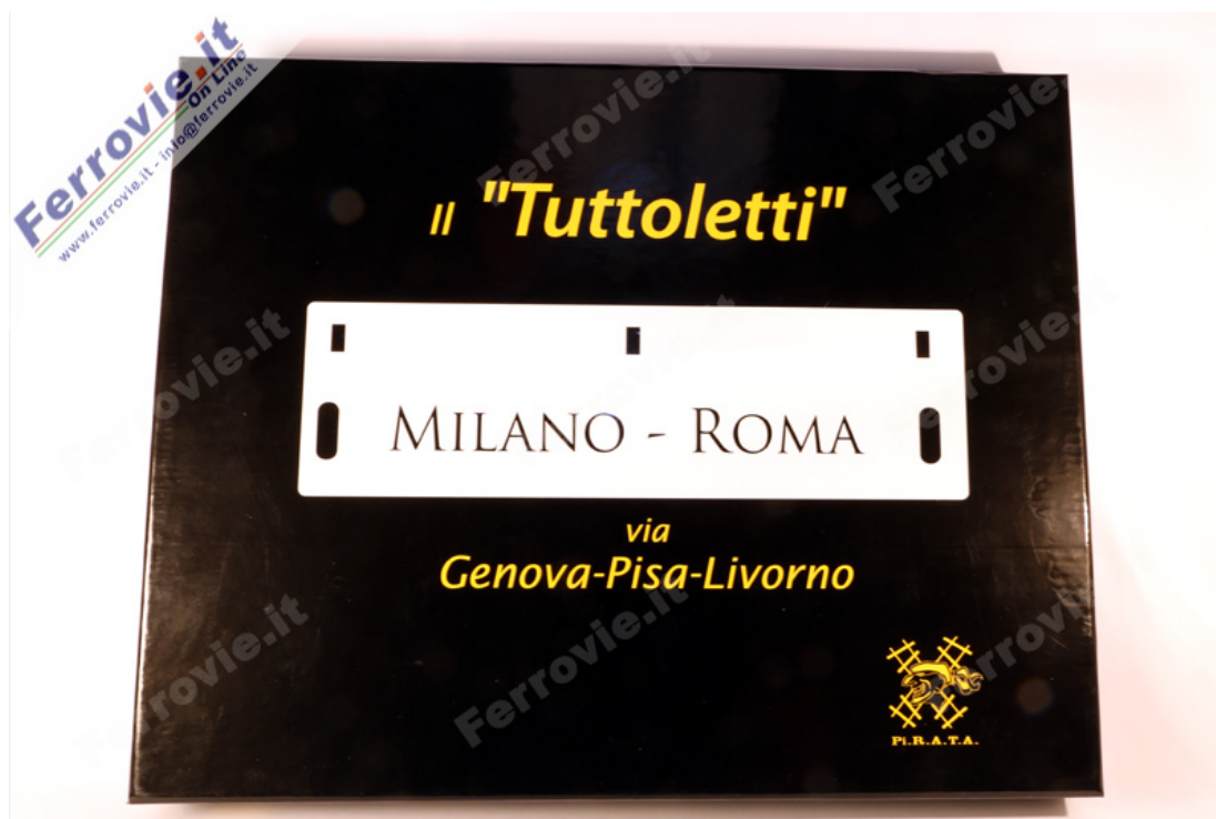
Pi.Ra.Ta. - Set "Tuttoletti" Milano - Roma - Art.90050