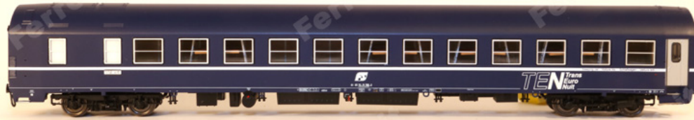
Carrozza letti ACME 61 83 72-71 752-2