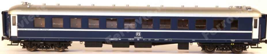
Carrozza letti LS Models 61 83 71-41 635-4 (3878 CIWL)