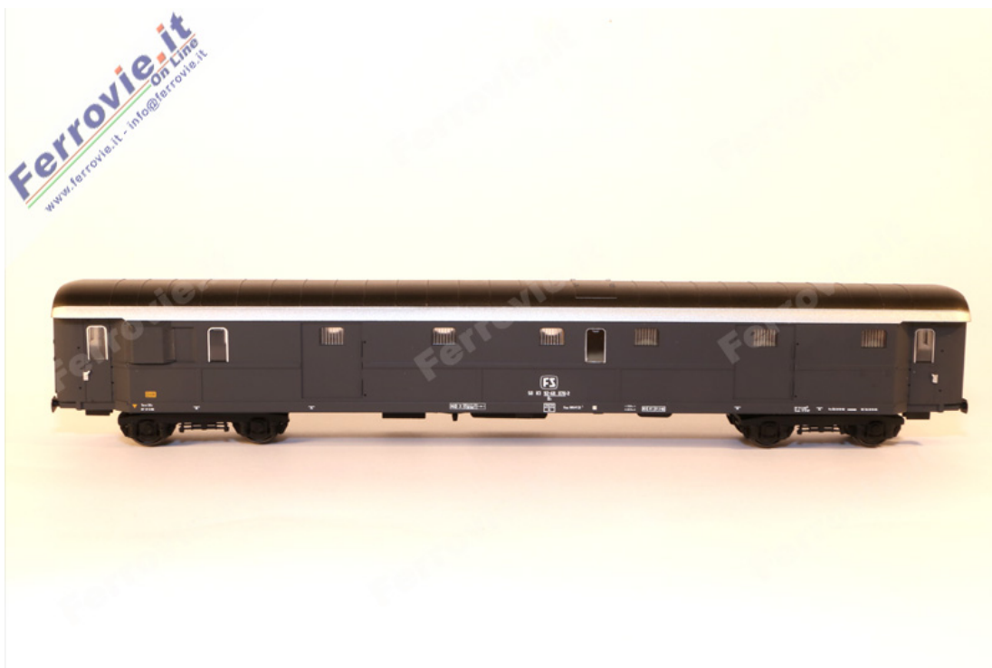
Bagagliaio ACME 50 83 92-48 076-2 Dz