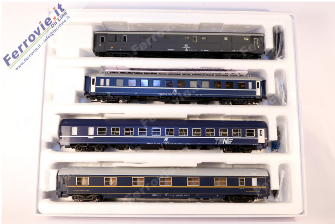
Pi.Ra.Ta. - Set "Tuttoletti" Milano - Roma - Art.90050