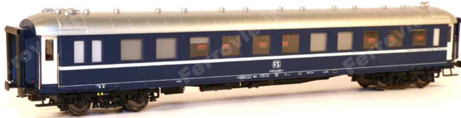
Carrozza letti LS Models 61 83 71-41 635-4 (3878 CIWL)