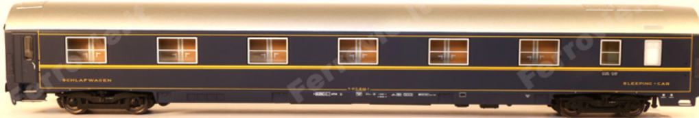
Carrozza letti ACME 71 83 72-80 614-2 (4764 CIWL)