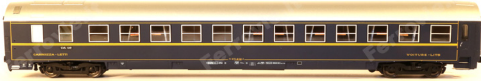
Carrozza letti ACME 71 83 72-80 614-2 (4764 CIWL)