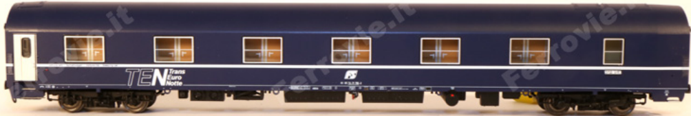
Carrozza letti ACME 61 83 72-71 752-2