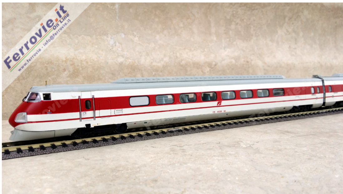
1. Rivarossi 2472 - Elettrotreno ETR.450 FS