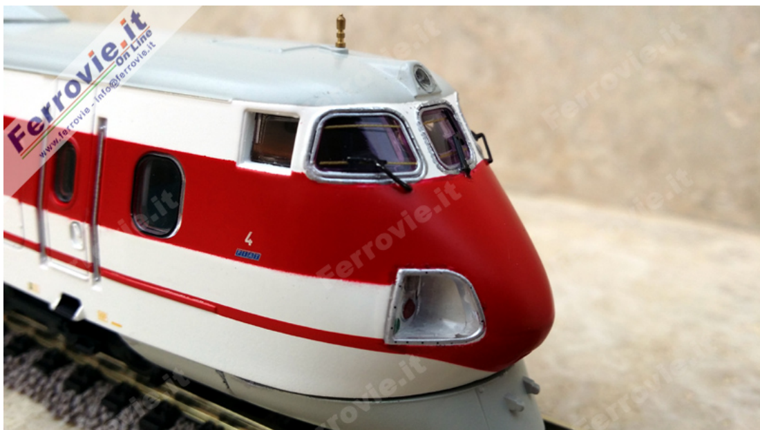
Rivarossi 2472 - Elettrotreno ETR.450 FS