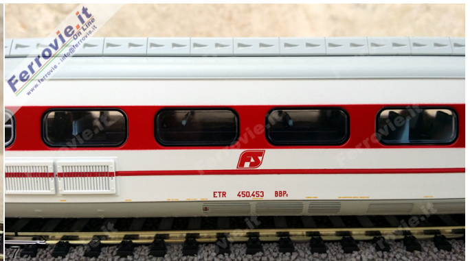
6/7. Rivarossi 2472 - Elettrotreno ETR.450 FS