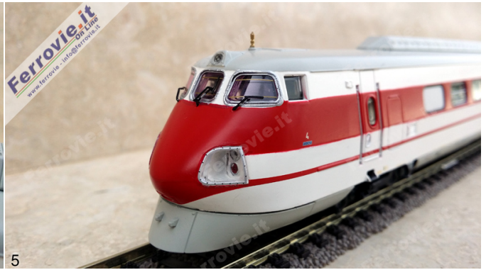
4/5. Rivarossi 2472 - Elettrotreno ETR.450 FS