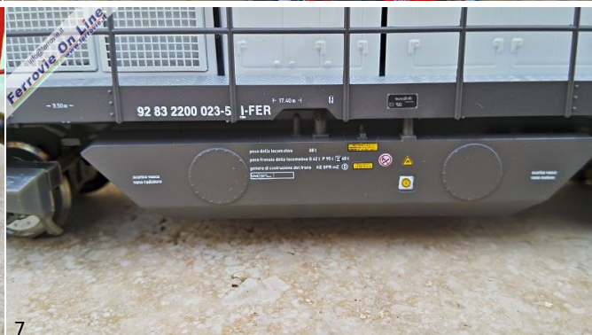
4/5/6/7. Mehano - CFB 200-023 - Locomotiva G2000 ER