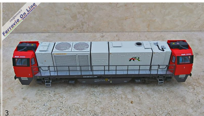
2/3. Mehano - CFB 200-023 - Locomotiva G2000 ER