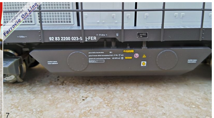
4/5/6/7. Mehano - CFB 200-023 - Locomotiva G2000 ER