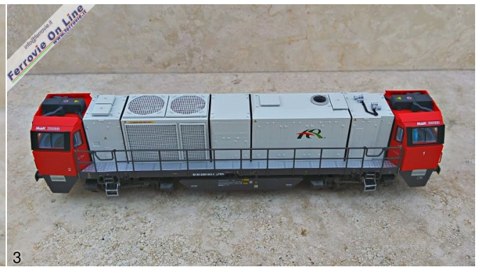
2/3. Mehano - CFB 200-023 - Locomotiva G2000 ER