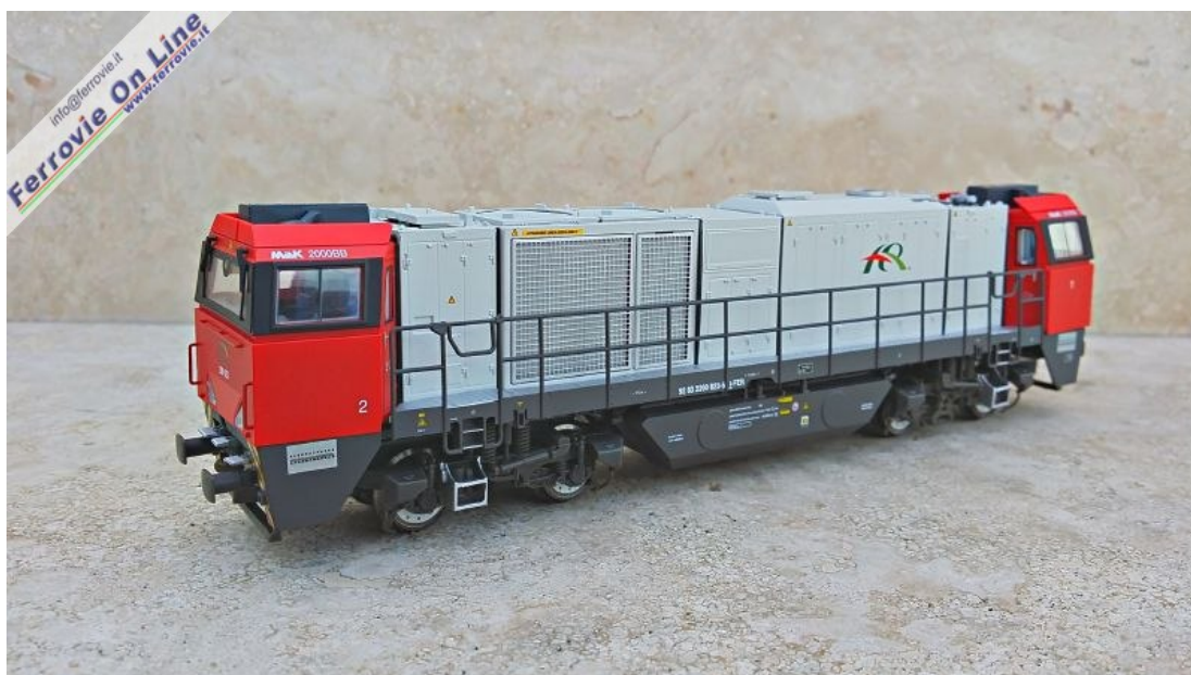
1. Mehano - CFB 200-023 - Locomotiva G2000 ER