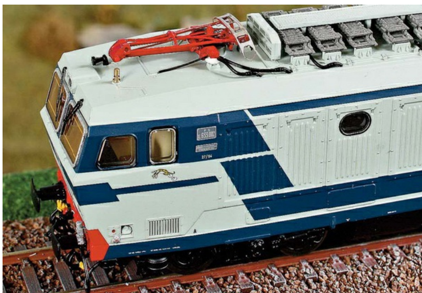
2/ ACME 60470 - Locomotiva elettrica E.633.002 FS