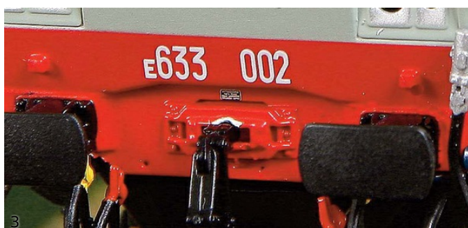
3/4. ACME 60470 - Locomotiva elettrica E.633.002 FS