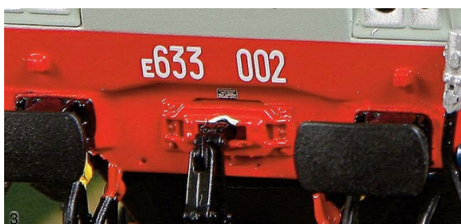
3/4. ACME 60470 - Locomotiva elettrica E.633.002 FS