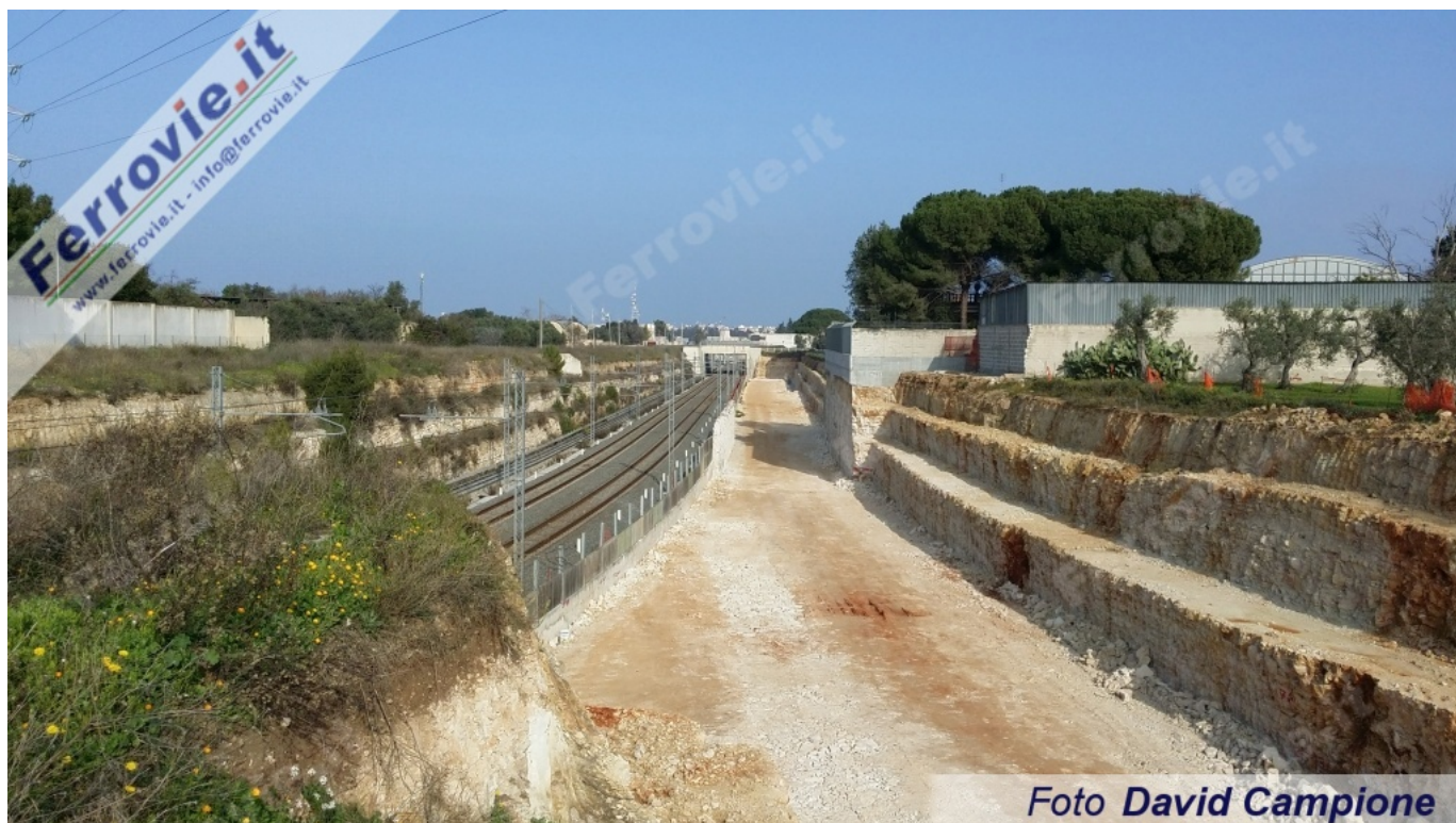
22 Il punto in cui la linea da Bitritto delle FAL confluirà nella linea Bari - Taranto di RFI. (Foto David Campione, 26 dicembre 2015)