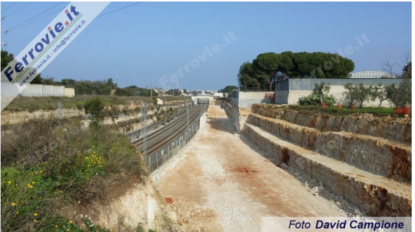
21 Il punto in cui la linea da Bitritto delle FAL confluirà nella linea Bari - Taranto di RFI. 26 dicembre 2015