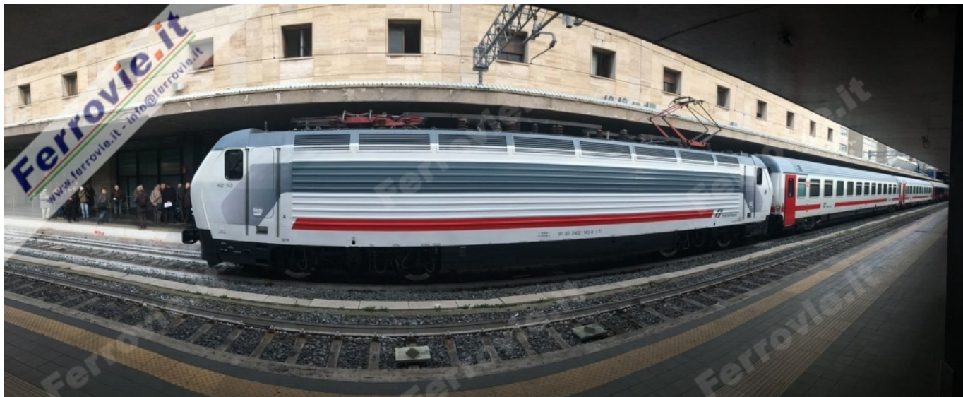
14. Effetto FishEye per la E.402.143 a Roma Termini, con le carrozze Intercity nei nuovi colori.

di Messa In Servizio da parte dell'ANSF, consentendo subito dopo l'impiego ordinario.