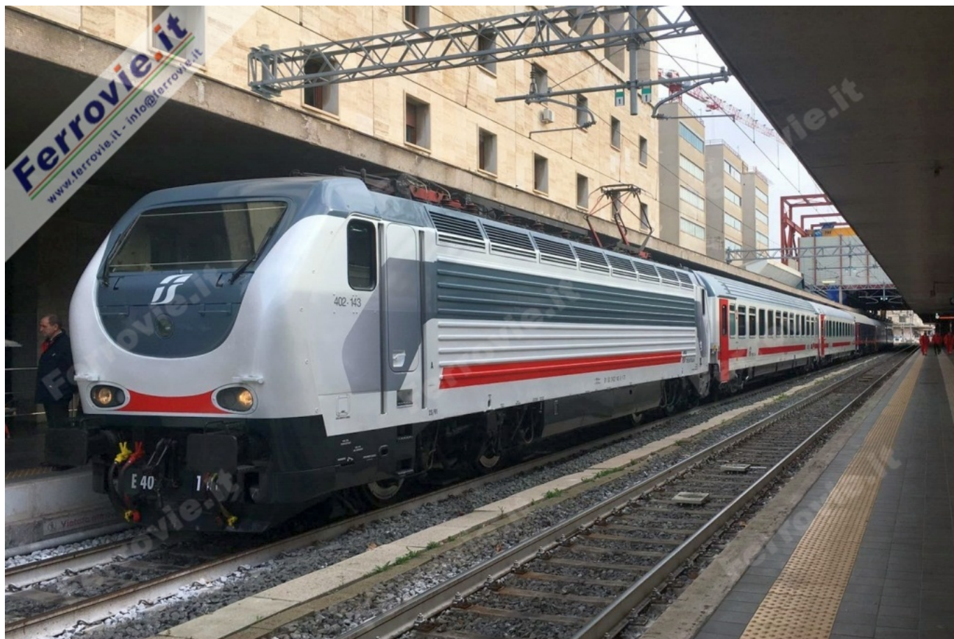
1 La E.402.143 con il convoglio di presentazione della nuova livrea.

ROMA - "Inizia una nuova era per gli Intercity". Così l'amministratore delegato di Trenitalia, Barbara Morgante, ha commentato il rinnovo del contratto di servizio fra Trenitalia e il Ministero delle Infrastrutture e Trasporti. Dopo anni di proroghe e numerosi rinvii (vedi News ferroviarie del 18/10/2016) Trenitalia e MIT hanno raggiunto l'accordo per il rilancio dei treni del Servizio Universale (Intercity Giorno e Notte) sul territorio nazionale, che continuerà ad essere affidato all'impresa ferroviaria del gruppo FS Italiane. Numerose le novità che questo accordo porta con sé, su tutte la durata dello stesso che è stata estesa a 10 anni contro i 5 del precedente contratto; altra importante novità riguarda il valore economico dell'operazione, che matura un aumento cospicuo della copertura finanziaria passata da 242 milioni di Euro anno a 347 (+105) milioni di Euro per il 2017 e 357 milioni (+112) per ciascun anno successivo dei restanti 9, accogliendo così le ripetute richieste di Trenitalia di adeguare il corrispettivo ai maggiori costi del servizio ed ai minori introiti da biglietti venduti negli ultimi anni per questa tipologia di treni.