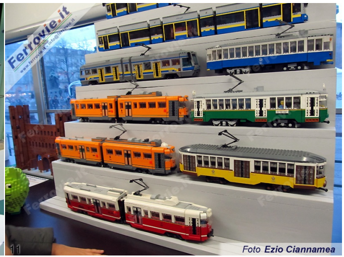
10. Uno dei diorami esposti nel tram 2759. (Foto Ezio Ciannamea, 6 dicembre 2015) 11. Modelli di tram realizzati con i Lego. (Foto Ezio Ciannamea, 6 dicembre 2015)

Come sempre era presente lo storico autobus a due piani Viberti CV61, costruito in occasione dell'Expo di Torino del 1961 e pazientemente recuperato e reso marciante dall'ATTS per il suo valore storico.