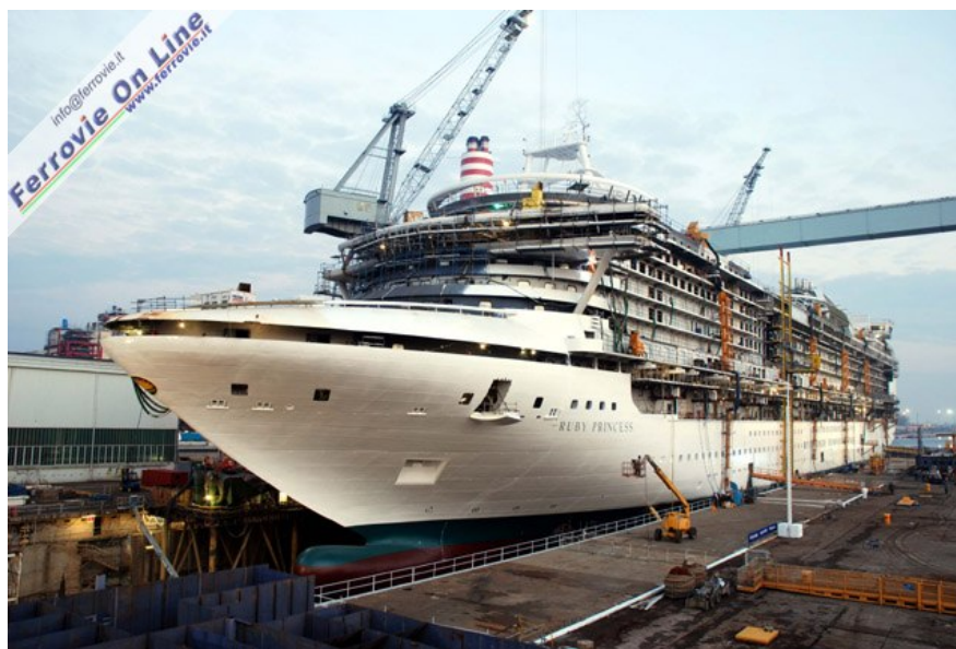
1.1 La "Ruby Princess" presso Fincantieri di Monfalcone.