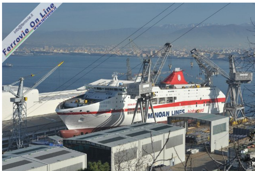
3 Il Cruise Roma di Grimaldi - Minoan Lines in Fincantieri. (14 marzo 2009)

Lunga 225 metri e larga 31 metri, con una stazza lorda di 54.310 tonnellate e una capacità di carico di 250 automobili e 3.000 metri lineari di autobus, camion, trailer, camper e roulotte, la Cruise Europa potrà ospitare fino a 3.000 passeggeri in 413 cabine, di cui 18 owner's Suite e 50 junior suite, oltre a 542 poltrone reclinabili. La nave potrà operare ad una velocità di 28 nodi.