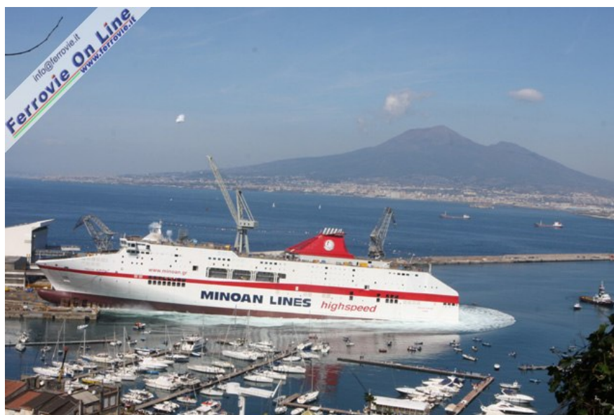
1. Il varo del Cruise Europa nelle acque di Castellammare di Stabia. 14 marzo 2009

La nave sarà consegnata ad ottobre e verrà impiegata sulla tratta Ancorna - Igoumenitsa - Patrasso operata da Minoan Lines, la compagnia di navigazione greca che fa parte dallo scorso anno del gruppo Grimaldi.