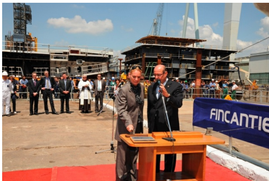
2 Un momento della cerimonia di varo.

Con le sue 116.000 tonnellate di stazza lorda, una lunghezza di 290 metri e la possibilità di ospitare nelle sue 2.180 cabine 3.118 ospiti oltre a 1.265 dell'equipaggio, Azura sarà un capolavoro dello stile italiano, un mix perfetto di alta tecnologia, eleganza e servizi esclusivi.