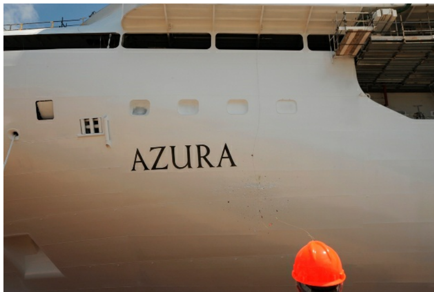
3 Beneaugurante lancio della bottiglia che si infrange contro lo scafo dell'Azura.

La nuova unità offrirà una vasta gamma di intrattenimenti a bordo, tra cui teatri, piscine, negozi, centro benessere, ristoranti e un'ampia area riservata agli amanti dello sport: dal calcio al tennis fino al campo da golf e un trampolino per bungee jumping.