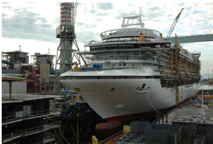
1 La Azura in allestimento presso la Fincantieri di Monfalcone.

È stata varata il 26 giugno, presso lo stabilimento di Monfalcone, la nuova nave passeggeri costruita da Fincantieri per il mercato britannico: si chiama "Azura" e sarà la nuova ammiraglia della flotta P&O Cruises, brand del gruppo Carnival, il primo operatore al mondo del settore crocieristico. Gemella di Ventura, consegnata lo scorso anno sempre nello stabilimento isontino, la nuova unità prenderà il mare nella primavera del 2010.