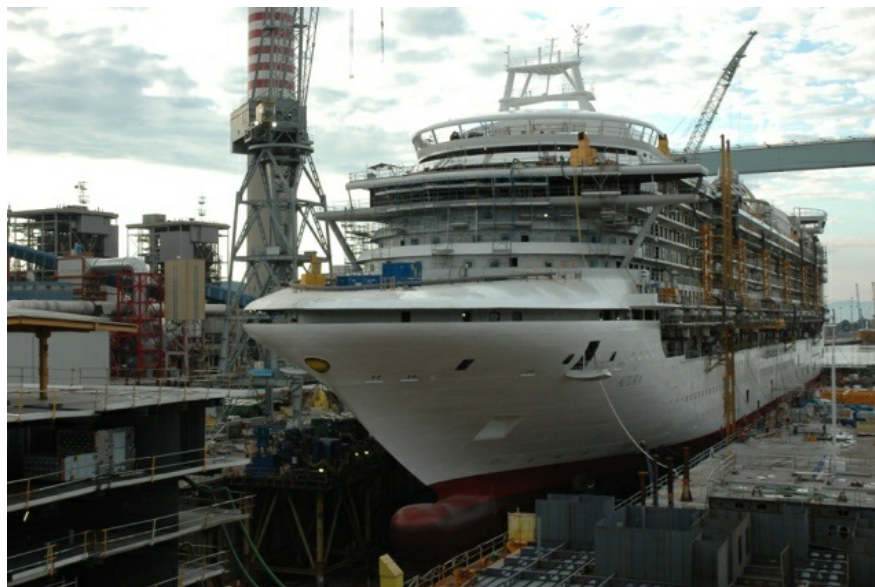
1.1 La Azura in allestimento presso la Fincantieri di Monfalcone.

È stata varata il 26 giugno, presso lo stabilimento di Monfalcone, la nuova nave passeggeri costruita da Fincantieri per il mercato britannico: si chiama "Azura" e sarà la nuova ammiraglia della flotta P&O Cruises, brand del gruppo Carnival, il primo operatore al mondo del settore crocieristico. Gemella di Ventura, consegnata lo scorso anno sempre nello stabilimento isontino, la nuova unità prenderà il mare nella primavera del 2010.