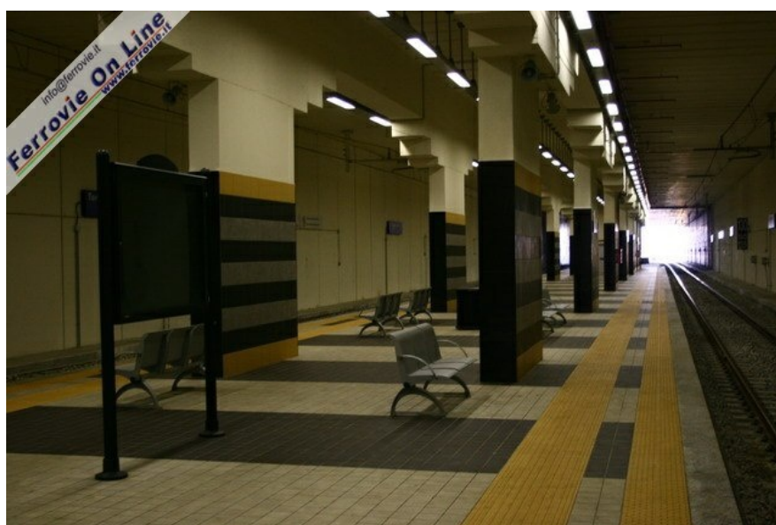
5 L'interno della nuova fermata di Tor Sapienza. (Foto David Campione, 1 febbraio 2007)

Ora quello che va all'occhio di tutti è la totale assenza di informazioni e di assistenza.