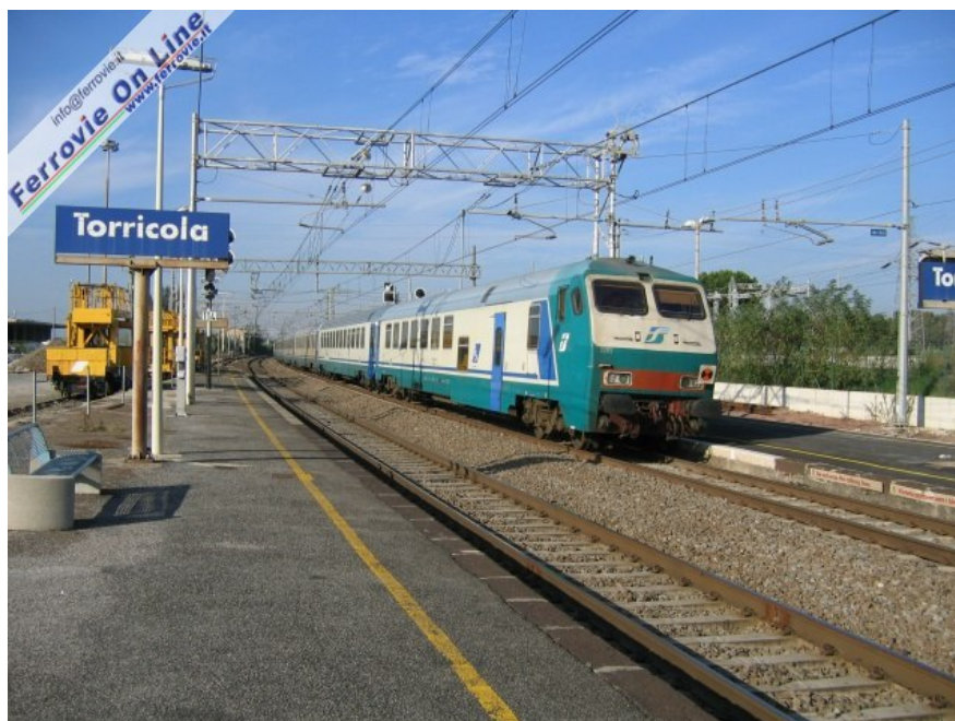
3. Un servizio Regionale Roma - Napoli in transito nella stazione di Torricola, sempre più spesso impresenziata e posta in una zona dove non ci sono esercizi commerciali.

FERROVIE: FS, SU LINEA TIVOLI-ROMA CIRCOLAZIONE INTERROTTA PER ROTTURA CAVO = Roma, 17 nov. - (Adnkronos) - Circolazione ferroviaria interrotta, questa mattina dalle 7.30 alle 11.15, sulla linea Fr2 da Tivoli a Roma per la rottura di un cavo della linea elettrica che ha causato danni agli apparati della centralina di Bagni di Tivoli. Lo riferiscono le Ferrovie dello Stato spiegando che per ridurre i disagi ai viaggiatori, il Gruppo Fs ha istituito servizi sostitutivi con autobus fra Roma Tiburtina e Tivoli. Il danno ha provocato anche un blackout out degli annunci sonori nelle stazioni della linea. Fs spiega che la circolazione è ancora perturbata dato che la complessità del guasto limita la potenzialità degli apparati. Attualmente la frequenza delle corse non è ancora quella programmata in orario. Il ritorno alla normalità del servizio è prevista nel tardo pomeriggio. (Ana/Col/Adnkronos) 17-NOV-09 16:32 NNN