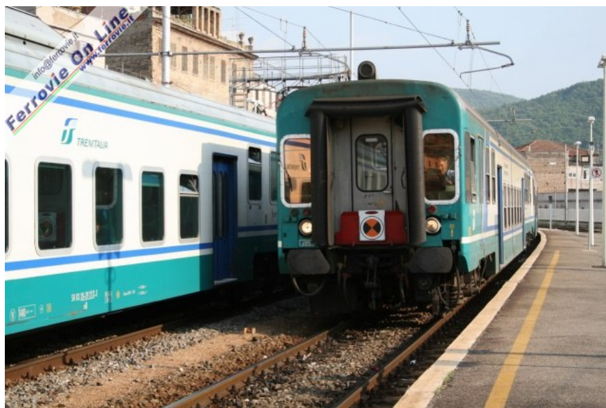
4, Un treno Regionale proveniente da Avezzano sta arrivando nella stazione di Tivoli, dove fanno capolinea gran parte dei treni della FR 2

Il giorno successivo, come nel film "Ricomincio da Capo", la scena si ripete. Arrivo fiducioso alla stazione di Tor Sapienza per prendere il 24015 per Tiburtina. Prima di scendere al piano binari controllo i tabelloni luminosi: tutti i treni in orario, ma è rimasto aggiornato alle 7 del mattino. Brutto presagio. Infatti passano i minuti e nessuna notizia del nostro treno. Stavolta neanche gli annunci audio. Qualche viaggiatore in attesa comincia a fare un giro di telefonate. E alla fine esce la notizia che tutti temevamo: anche oggi linea interrotta per la caduta della linea aerea.