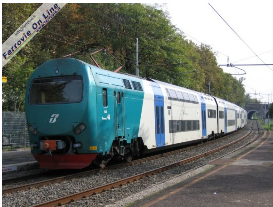
2. Anche nella fermata di Roma Nomentana sulla FR 1 Orte - Fiumicino Aeroporto i viaggiatori sono abbandonati a loro stessi, specie in caso di guasti o interruzioni. Nella foto un TAF ha appena lasciato Roma Nomentana, sui binari della linea merci, in direzione di Roma Tiburtina

La rabbia comincia a farsi sentire, abbandonati a noi stessi senza uno straccio di informazione. Dopo 45 minuti di vana attesa si decide di affidarci ai servizi pubblici di superficie. Mentre attendiamo il nostro autobus vediamo fermarsi davanti alla stazione di Tor Sapienza un pullman Gran Turismo con la scritta "Servizio sostitutivo FS". Solo che nessuno ci ha detto nulla. Una volta arrivato in redazione scopro che il treno che stavo aspettando era stato sostituito da un autobus!! Intanto alle 16,32 le principali agenzie di stampa lanciano la notizia di un guasto sulla Roma - Tivoli. Ecco il testo completo: