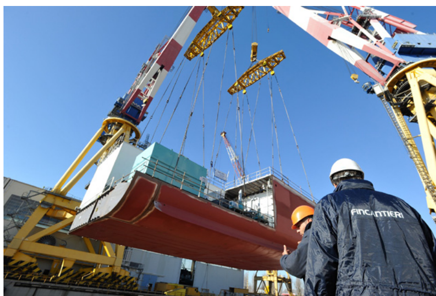
1 1 Posa del primo blocco della futura Costa Diadema nel bacino dello stabilimento Fincantieri. 10 dicembre 2012

Durante la cerimonia, il primo blocco della nave - del peso di 504 tonnellate, largo 15,7 metri e lungo 29 metri, che costituirà la parte centrale della nave - è stato sollevato da una gru e depositato sul fondo del bacino, dove la nave sarà costruita. I lavori di costruzione e allestimento dureranno sino al 30 ottobre 2014, data prevista di consegna della nave. Il progetto Costa Diadema coinvolgerà complessivamente circa 1.000 addetti diretti del cantiere e altri 2.500 dell'indotto. I benefici per l'occupazione non riguarderanno solo il cantiere ma, soprattutto per l'allestimento degli interni, anche circa 400 imprese esterne, la maggior parte della quali sono italiane.