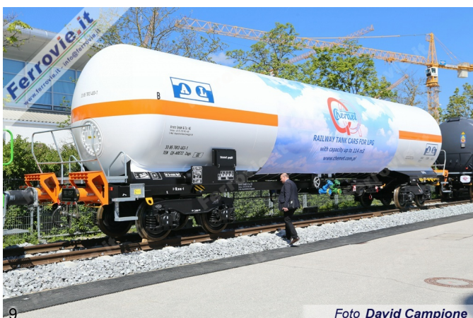
9 Foto David Campione

8. ARS Altmann - Lo stesso carro Laaers può essere impiegato per il trasporto di furgoni, con l'abbassamento del piano di carico superiore. (Foto David Campione, 10 maggio 2017)