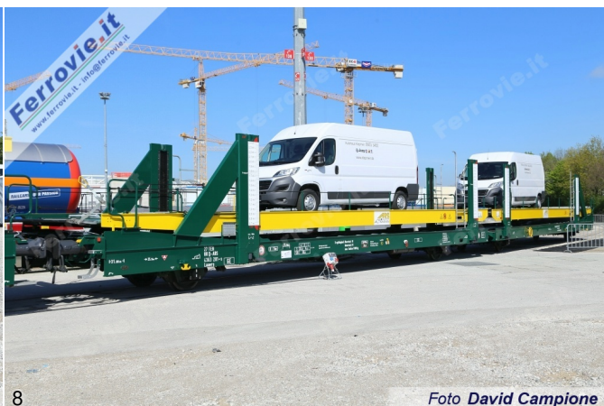
8 Foto David Campione

7. ARS Altmann - Biscarica per trasporto veicoli stradali tipo Laaers, composto da due carri permanentemente accoppiati a due assi ciascuno. (Foto David Campione, 10 maggio 2017)