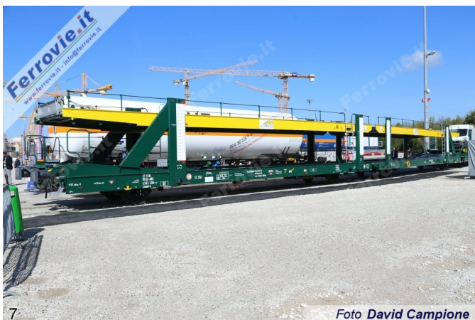
7 Foto David Campione

6. Alstom - Locomotiva ibrida Prima H3 per InfraLeuna, nella livrea speciale che celebra i 100 anni dello stabilimento di Leuna specializzato nella produzione di sostanze chimiche. (Foto David Campione, 10 maggio 2017)