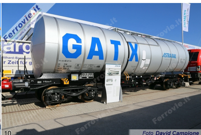
10 Foto David Campione

9. Aretz - Chemet - Carro Zags per il trasporto di GPL, con capacità di 114 metri cubi. (Foto David Campione, 10 maggio 2017)