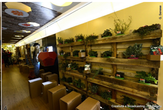
3/4. Treno Verde 2015