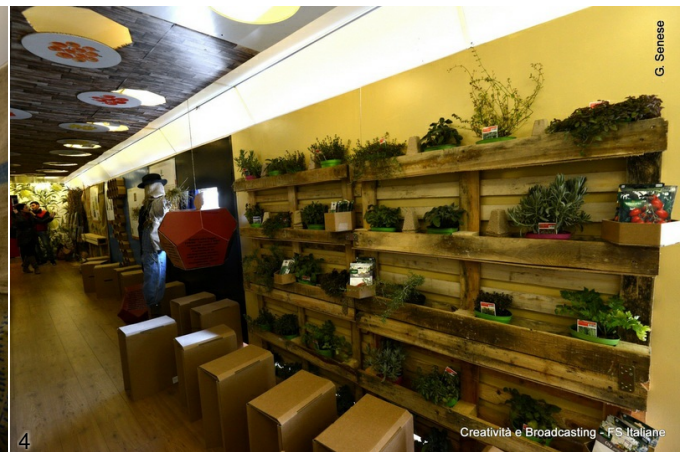
3/4. Treno Verde 2015