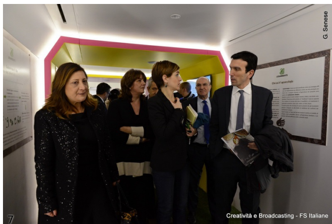
7. La visita al Treno Verde durante la presentazione.