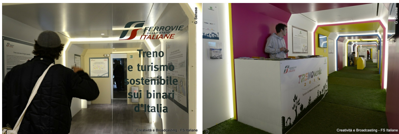
1/2. Treno Verde 2015

La campagna nazionale di Legambiente e Ferrovie dello Stato Italiana