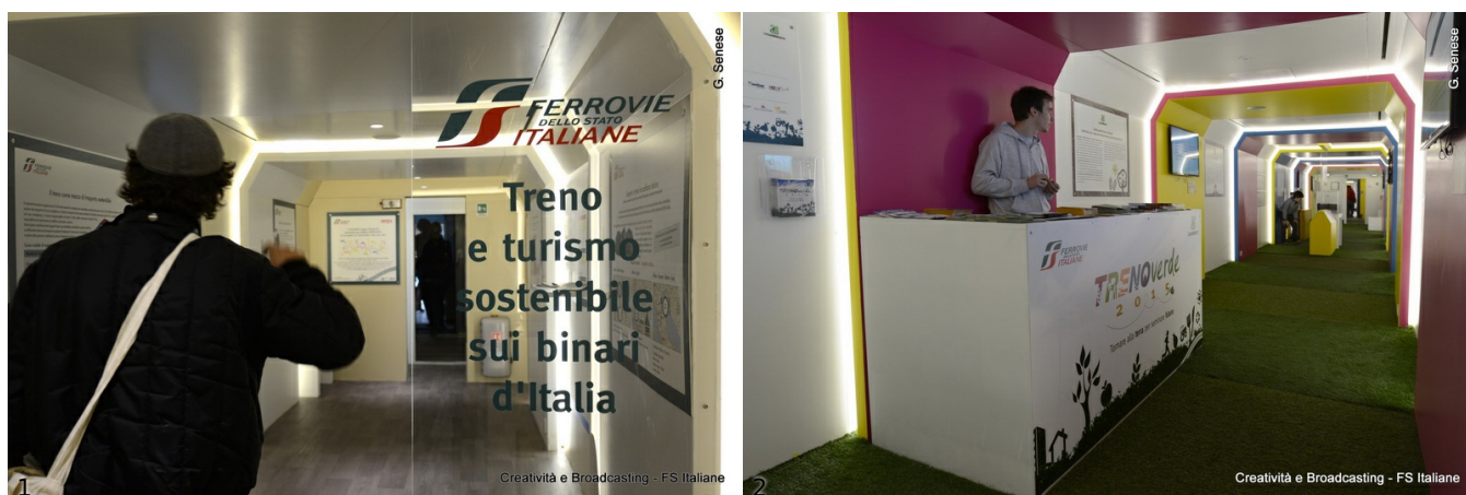
1/2. Treno Verde 2015

La campagna nazionale di Legambiente e Ferrovie dello Stato Italiana