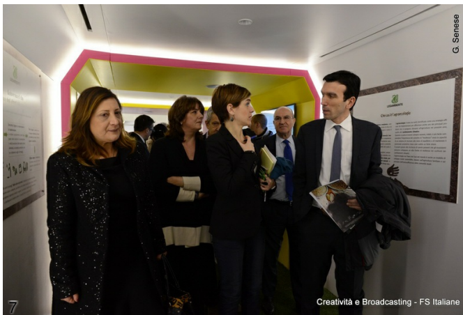
7. La visita al Treno Verde durante la presentazione.