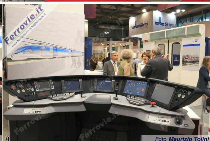
5. Lo stand di CZ Loko. (Foto Maurizio Tolini, 03 ottobre 2017)