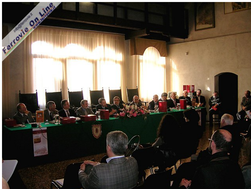
24 relatori e le autorità durante la cerimonia di presentazione dell'opera, nella Sala consiliare del Municipio di Portogruaro (VE). Foto Davide Cester, 27 febbraio 2010

In 4 anni di lavoro, gli autori hanno messo insieme più di 1500 pagine di documenti storici, cartine ed immagini d'epoca, riprodotti su carta patinata; l'opera è suddivisa in due volumi, il primo dei quali dedicato al solo Veneto, racchiusi in un elegante cofanetto. I documenti che riguardano le varie linee è preceduta da una corposa introduzione storica, che procedendo dalla Serenissima Repubblica di Venezia all'Unità d'Italia, ne contestualizza la costruzione e lo sviluppo.