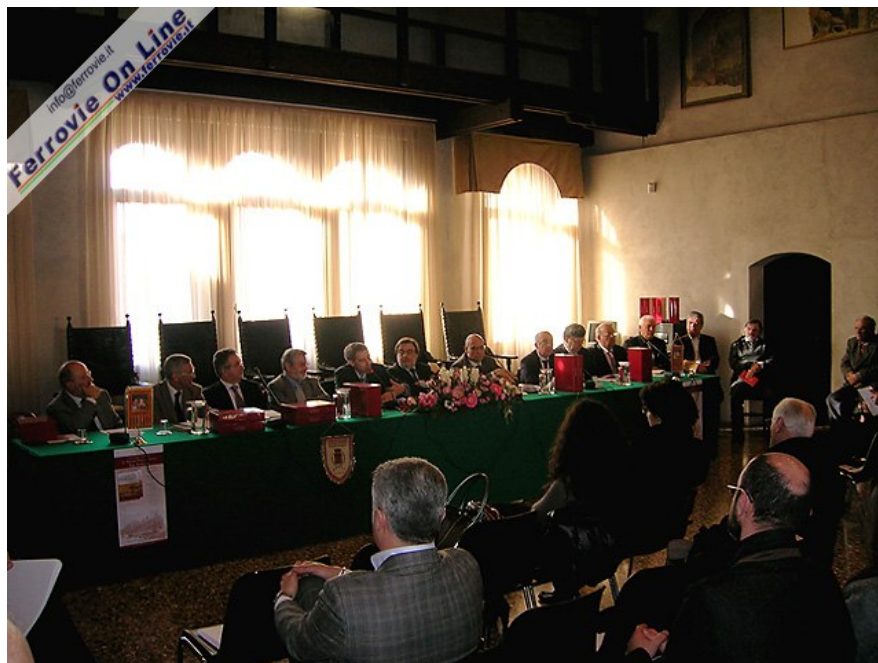
2. I relatori e le autorità durante la cerimonia di presentazione dell'opera, nella Sala consiliare del Municipio di Portogruaro (VE). 27 febbraio 2010

In 4 anni di lavoro, gli autori hanno messo insieme più di 1500 pagine di documenti storici, cartine ed immagini d'epoca, riprodotti su carta patinata; l'opera è suddivisa in due volumi, il primo dei quali dedicato al solo Veneto, racchiusi in un elegante cofanetto. I documenti che riguardano le varie linee è preceduta da una corposa introduzione storica, che procedendo dalla Serenissima Repubblica di Venezia all'Unità d'Italia, ne contestualizza la costruzione e lo sviluppo.