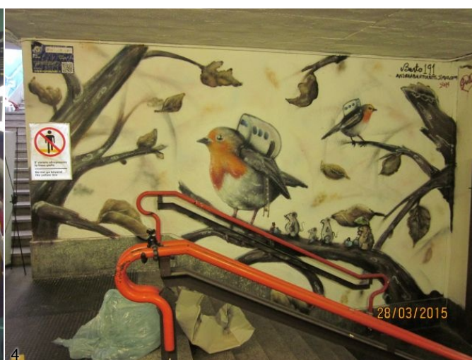
3/4. Murales nella stazione di Milano Porta Genova.

Comunicato stampa Gruppo FS - 22 aprile 2015