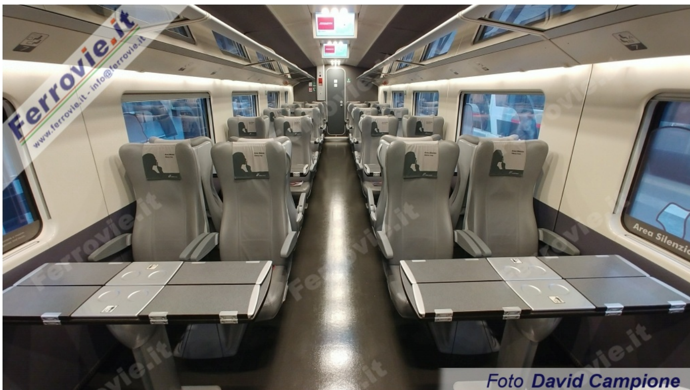
4. Vista d'insieme della carrozza 8 dell'ETR.400 n. 34, di livello Standard e destinata ad "Area silenzio". Foto David Campione, 10 dicembre 2019