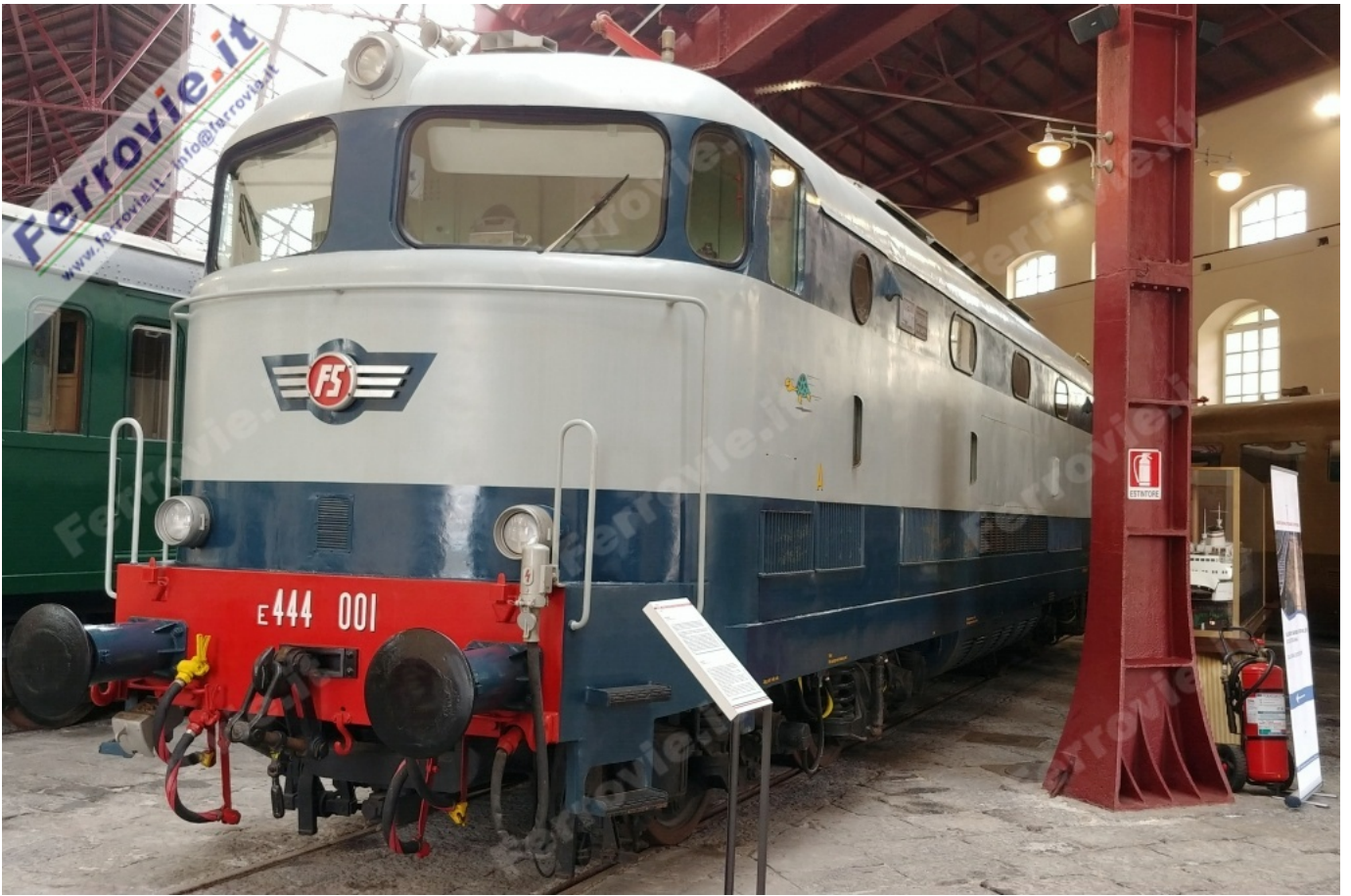
4 a E.444.001 - Museo Nazionale Ferroviario di Pietrarsa. (Foto Ferrovie.it, 26 aprile 2009)