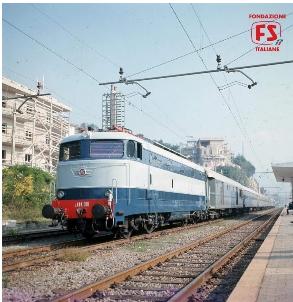
1 1 E.444.001.