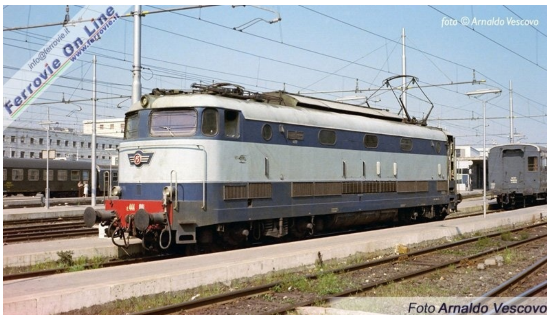
2 2 E.444.001 - Roma Termini. (Foto Arnaldo Vescovo, marzo 1981)