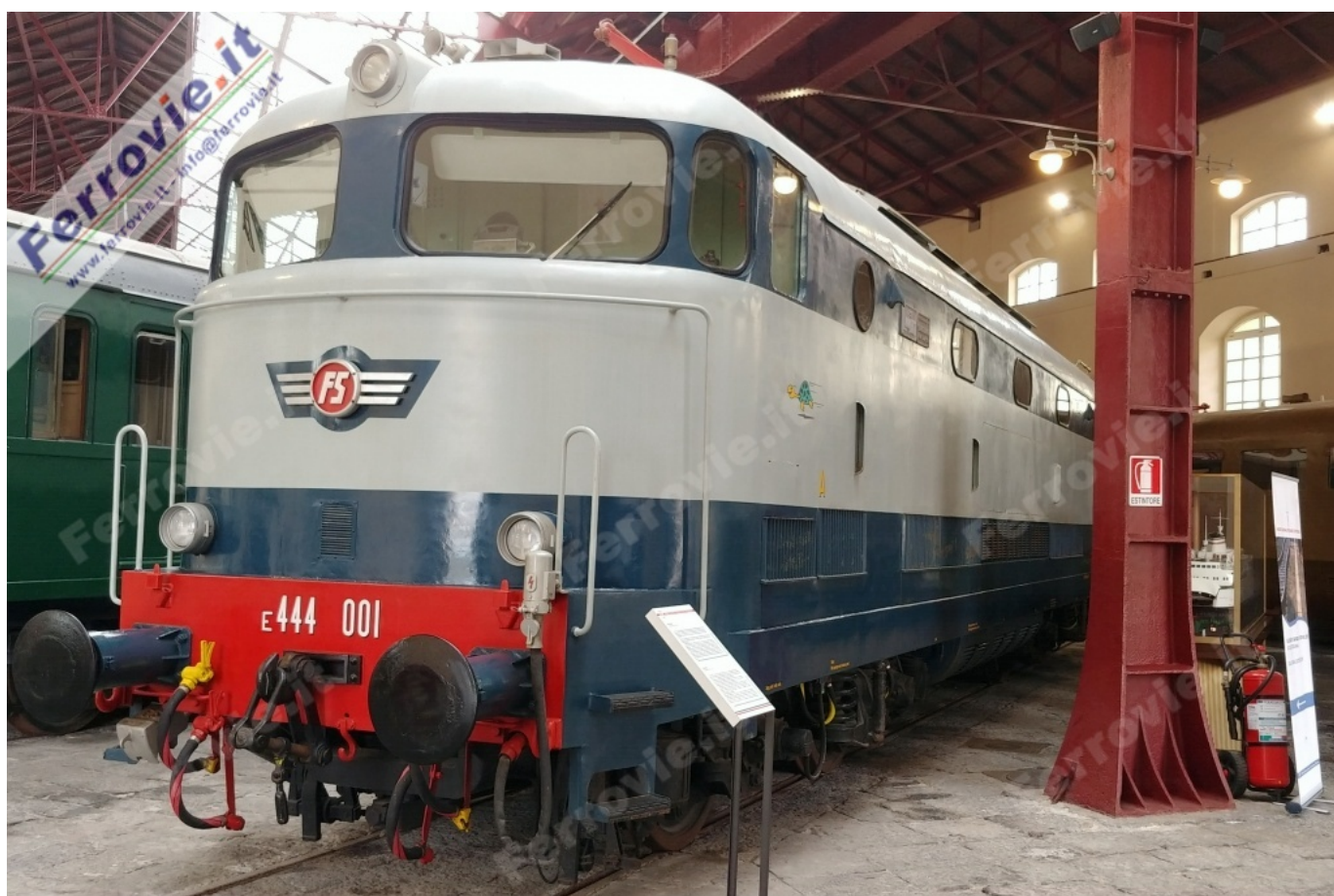
4 4 E.444.001 - Museo Nazionale Ferroviario di Pietrarsa. (Foto Ferrovie.it, 26 aprile 2009)