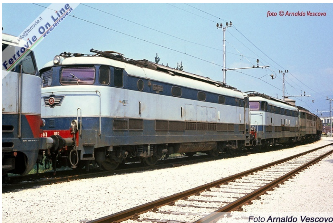
8 8 E.444.002 - Foligno. (Foto Arnaldo Vescovo, luglio 1982)