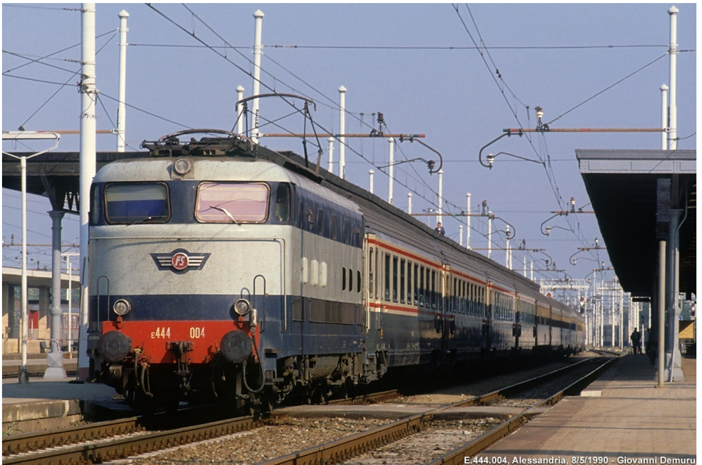
13. E.444.004 - Alessandria. (Foto Giovanni Demuru, 08 maggio 1990)