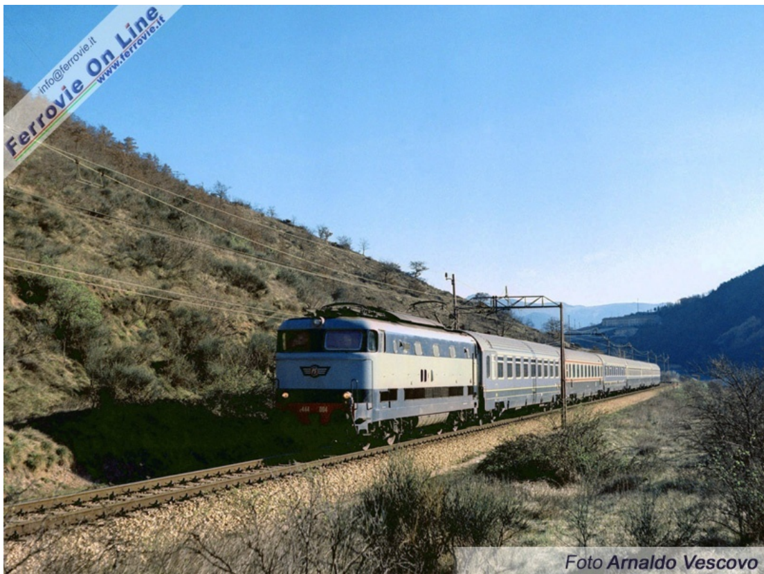
12. E.444.004 - Intercity Ancona - Roma "Federico II" - Linea Orte - Ancona. Foto Arnaldo Vescovo, marzo 1990