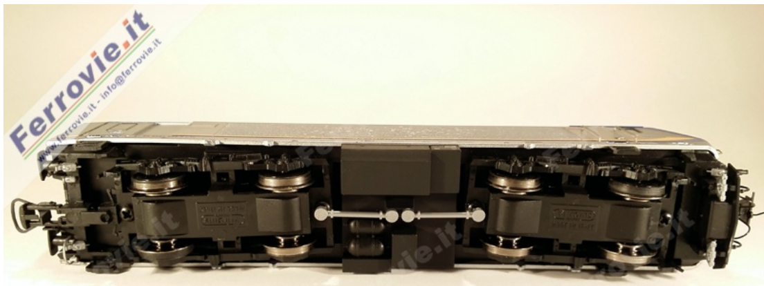
8. Vitraains 2208 - Locomotiva E.464.589 FS