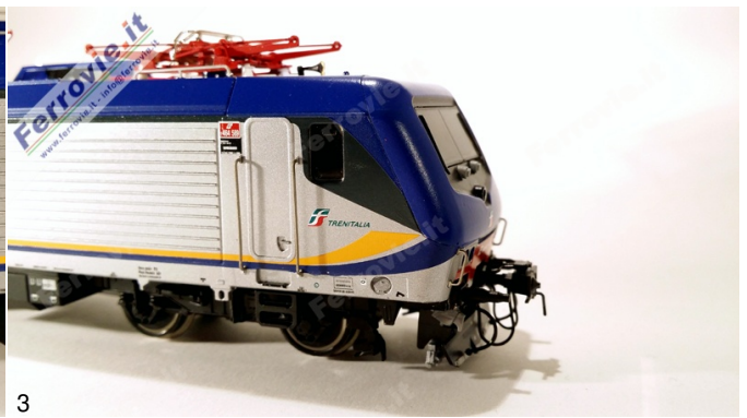
2/3. Vitraains 2208 - Locomotiva E.464.589 FS