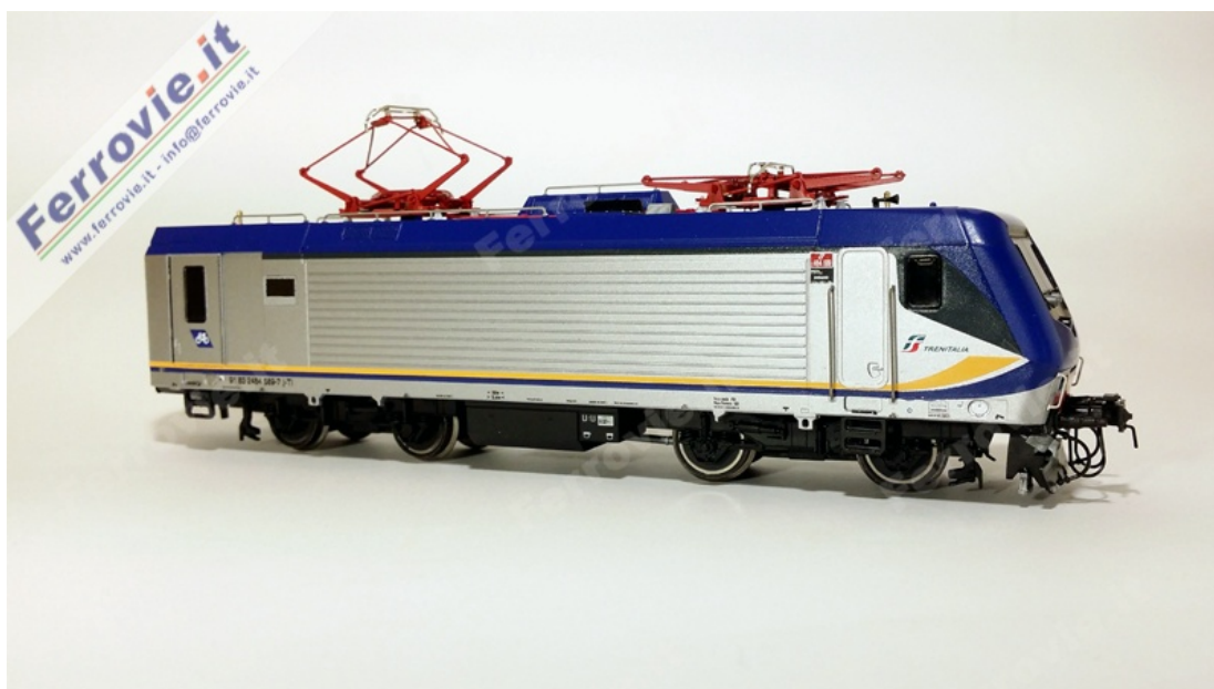
1. 1 Vitrains 2208 - Locomotiva E.464.589 FS