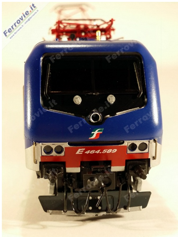
9 Vitrains 2208 - Locomotiva E.464.589 FS